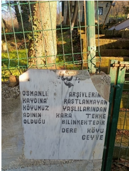
Resim 1: Kara Tekke Türbesinin girişindeki yazı