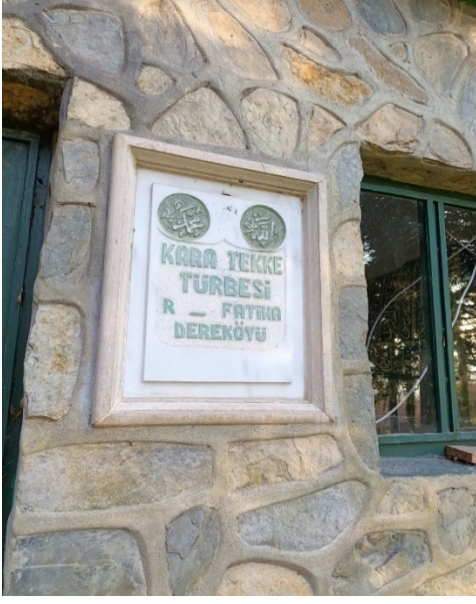
Resim 3: Kara Tekke Türbenin giriş kapısı