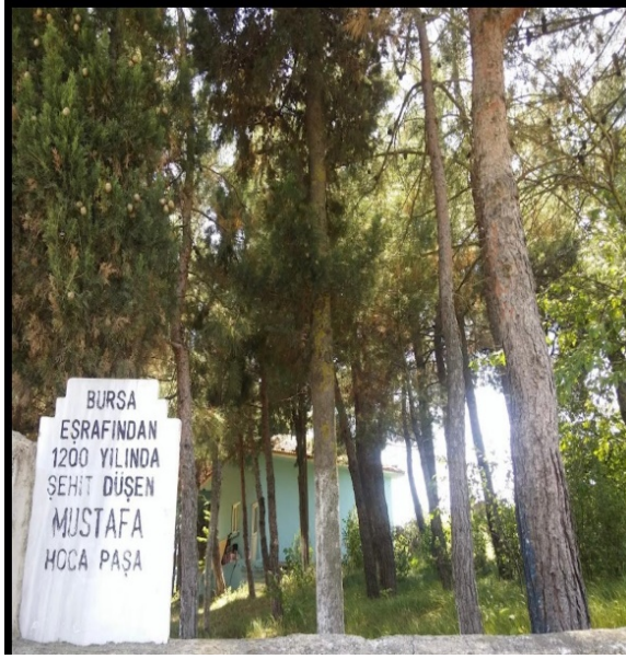
Resim 6: Koç Baba Türbesinin başındaki yazı