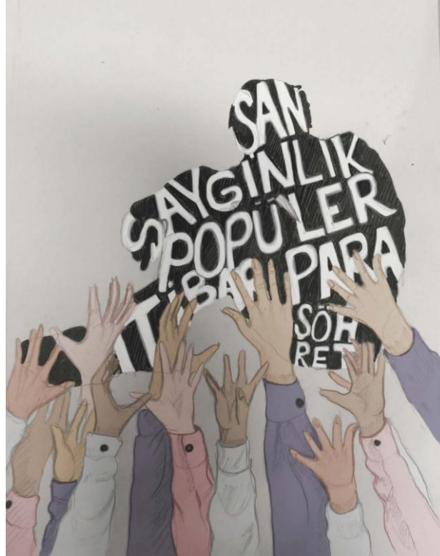
Şekil 11. Odak Grup katılımcısı Öğrenci 6 tarafından geliştirilmiştir. [Telif Hakkı (2025) Öğrenci 6]. (kişisel iletişim, 09 Mayıs 2025).

Yapay zekâ tarafından oluşturulan görsel (Bkz. Şekil 11), dört farklı karede bir insan silüetinin elleri yukarıya doğru uzandığı ve üstte "SUCCESS", "FAME", "MONEY", "POPULARITY" ve "ACHIEVEMENT" gibi kelimeleri içeren benzer temaları işlemektedir. Görselde kalabalık kitleyi, koyu tonlar ile gösterilen eller temsil etmektedir. Görsellerdeki kelime grupları ve bu kelimelerden oluşan figürler, kapitalist sistemde başarının para, şöhret ve popülerlik gibi kavramlarla nasıl tanımlandığını göstermektedir. Bu kelimeler insanların arzuladığı ve ulaşmaya çalıştığı metalaşmış hedefleri temsil eder. Aşağıdan uzanan ellerin yoğun ve bazen tekdüze görünümü, kapitalist sistemde bireylerin ortak bir arzu nesnesine doğru nasıl yönlendirildiğini ve bu süreçte tek tipleşme eğilimini düşündürülebilir. Silüetin çoğu zaman ellerin üzerinde, yüksekte ve bazen ulaşılamaz gibi görünmesi, kapitalist başarı mitinin çoğu insan için bir yanılısama olduğunu ve gerçekte sadece küçük bir azınlık tarafından