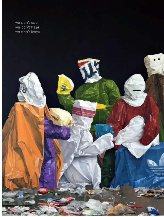
Şekil 9. Odak Grup katılımcısı Öğrenci 5 tarafından geliştirilmiştir. [Telif Hakkı (2025) Öğrenci 5]. (kişisel iletişim, 09 Mayıs 2025).

olması, bu cazibenin aldatıcı olduğunu gösterir. Zemin üzerindeki atıkların yapısı, tüketimin çevresel ve toplumsal etkilerini gösterir. Görsel (Bkz. Şekil 9.) kapitalist tüketim kültürünün dönüştürücü ve zararlı etkilerine, özellikle bilinçsizlik ve yabancılaşma üzerinden güçlü bir bakış açısı sunmaktadır. Görsel, modern toplumun aşırı tüketim, kimliksizleşme ve çevresel sorunlara duyarsızlığını sembolik ve çarpıcı bir dille ifade eder.