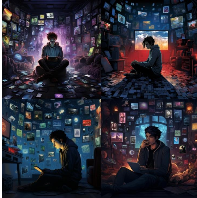
Şekil 4. Midjourney. (2025). In a dimly lit, surreal room cluttered with social media icons, a lonely young man sits surrounded by screens displaying his various curated personas, his eyes reflecting a deep yearning for true connection as he compulsively seeks digital validation through his phone [Dijital Görüntü]. Midjourney. https://www.midjourney.com/

Yapay zekâ üretimi (Şekil 4), her ne kadar kapitalist ideolojinin sonuçlarını estetik bir dille betimlemede başarılı bir "ayna" görevi üstlenmiş olsa da bu sonuçların ardındaki nedensel ilişkileri eleştirel bir perspektifle sorgulamakta başarısız olduğu söylenebilir. YZ'nin (Şekil 4) ideolojiyi sentezlenecek bir veri seti olarak işlemesi, üretimin kavramsal bir derinlikten öte sadece biçimsel bir yapı olarak kurgulanmasına neden olmaktadır.