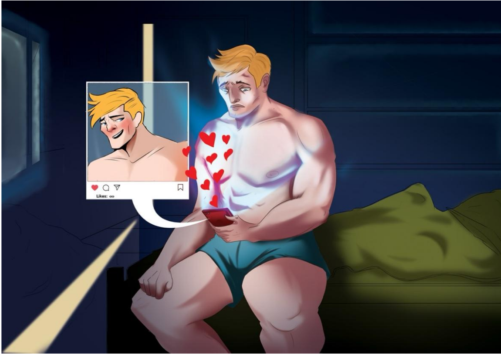
Şekil 3. Odak Grup katılımcısı Öğrenci 2 tarafından geliştirilmiştir. [Telif Hakkı (2025) Öğrenci 2]. (kişisel iletişim, 09 Mayıs 2025).

Yapay zekâ tarafından üretilen kompozisyon (Şekil 4), merkezine ekranlarla çevrili yalnız birey figürünü alarak dijital izolasyon temasını işlediği söylenebilir. Bu görsel kurgu, duvarları ve zemini istila eden ekran yığınları aracılığıyla, çağdaş bireyin maruz kaldığı yoğun enformasyon