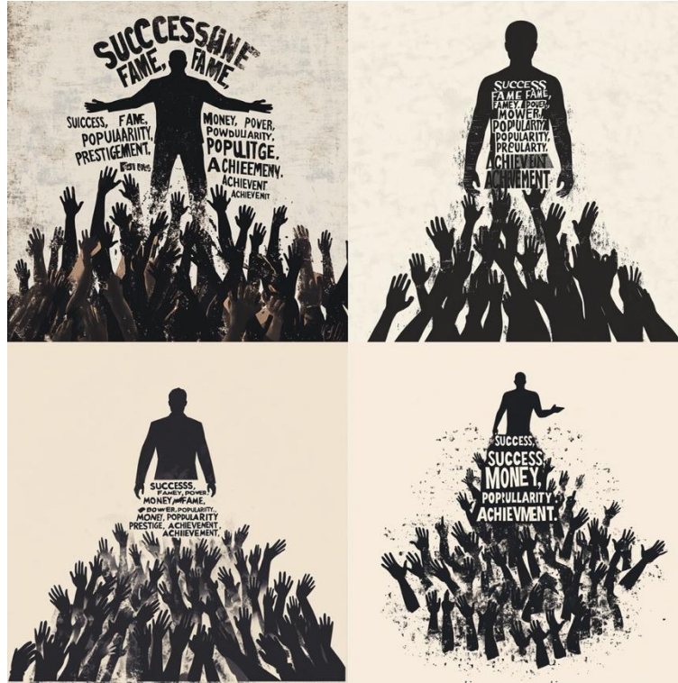
Görsel 12. Midjourney. (2025). A minimalist, high-contrast illustration featuring a towering dark silhouette inscribed with bold white typography of capitalist aspirations like 'SUCCESS' and 'POWER', looming over a dense sea of diverse hands reaching upward in a collective yet futile struggle for these illusory goals. [Dijital Görüntü]. Midjourney. https://www.midjourney.com/