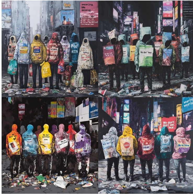
Görsel 10. Midjourney. (2025). In a somber, contemporary art-style illustration, a group of anonymous figures stands amidst a desolate urban wasteland of consumer debris, their bodies and faces entirely obscured by branded packaging and plastic waste to symbolize the dehumanizing alienation and loss of individuality within late-capitalist society

[Dijital Görüntü]. Midjourney. https://www.midjourney.com/