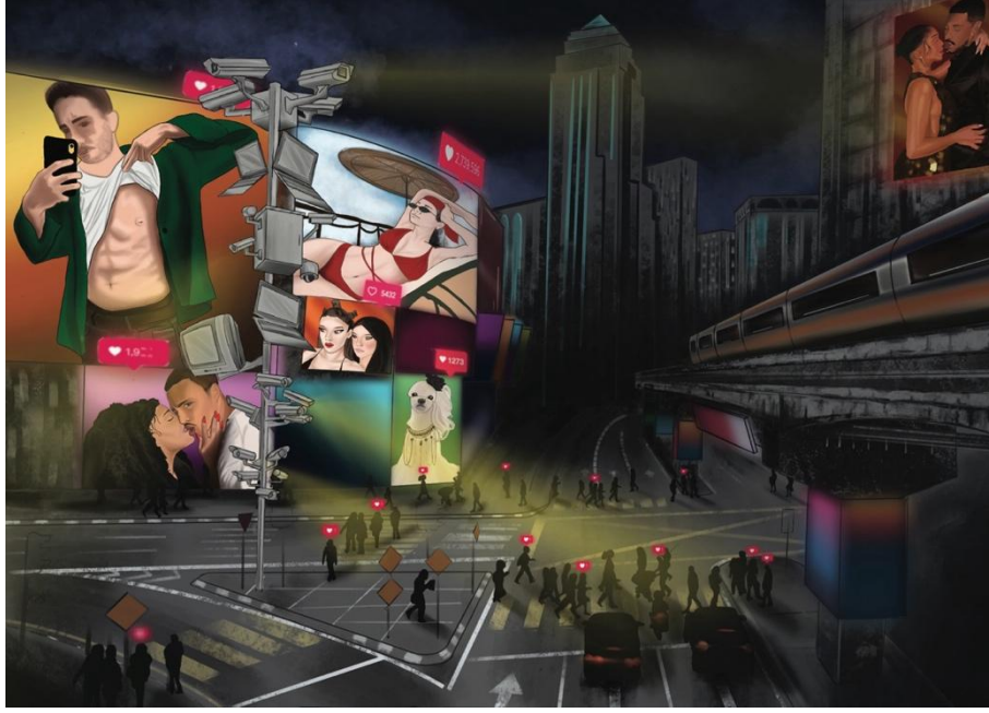
Şekil 1. Odak Grup katılımcısı Öğrenci 1 tarafından geliştirilmiştir. [Telif Hakkı (2025) Öğrenci 1]. Öğrenci 1 (kişisel iletişim, 09 Mayıs 2025).