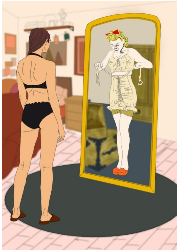
Şekil 5. Odak Grup katılımcısı Öğrenci 3 tarafından geliştirilmiştir. [Telif Hakkı (2025) Öğrenci 3]. (kişisel iletişim, 09 Mayıs 2025).

Yapay zekâ tarafından üretilen görselde ise (bkz. Şekil 6), dört farklı karede kadın figürlerine yer verilmiş ve genellikle ayna veya yansıma teması etrafında şekillenen estetik kompozisyonlar kurgulanmıştır. Görseller Art Deco veya Art Nouveau tarzı bir estetiğe sahiptir, bu da geçmiş güzellik standartlarına yapılmış bir gönderme olarak yorumlanabilir. Figürler genellikle zarif, stilize edilmiş ve idealize edilmiş beden formlarına sahiptir. Görsellerdeki kadın figürleri, kusursuz hatlara, pürüzsüz tenlere ve zarif duruşlara sahiptir. Bu durum, kapitalist güzellik endüstrisinin sürekli olarak “mükemmel” ve “ulaşılabilir” bir güzellik imajı pazarlamasını yansıtır. Güzellik, bir arzu nesnesi olarak estetize edilmiştir. Görsellerde kadınların aynaya bakması veya kendilerini incelemesi, güzellik endüstrisinin bireyi sürekli kendini “geliştirmeye” ve “düzeltmeye” teşvik eden tüketim döngüsüne