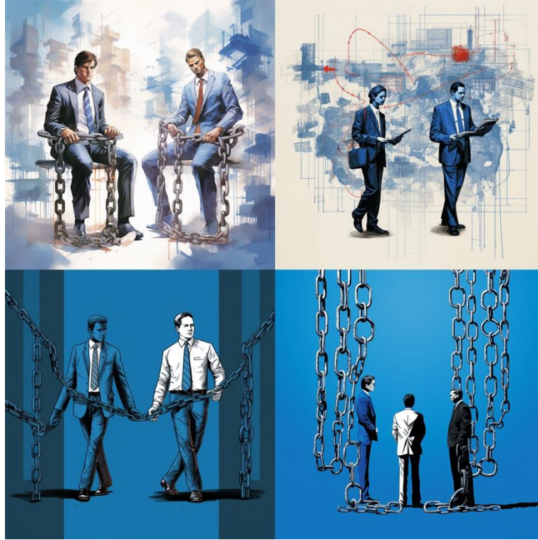
Görsel 8. Midjourney. (2025). A thought-provoking illustration depicting a white-collar and a blue-collar worker chained together in a dynamic landscape of office buildings and industrial machinery, symbolizing the inescapable interdependence and shared constraints imposed by the capitalist economic system. [Dijital Görüntü]. Midjourney. https://www.midjourney.com/

tarafından üretilen görsel (Bkz. Şekil 7) izleyiciyi sorgulamaya ve kapitalist sistemin emeği nasıl dönüştürdüğünü düşünmeye teşvik eder. Yapay zekâ tarafından üretilen görsel ise (Bkz. Şekil 8) bu olguyu bir gerçeklik olarak gösterir ve izleyiciyi durumu gözlemlemeye teşvik ettiği söylenebilir. Bu iki görselin analizi, insan odaklı yaratıcılığın, özellikle eleştirel bakış açısı, kavramsal derinlik ve metaforik zenginlik açısından kapitalist ideolojideki emek, üretim ilişkileri ve yabancılaşma kavramlarını derinlikli bir şekilde görselleştirebilmektedir. Yapay de araçları ise belirli temaları sanatsal ve estetik açılardan etkileyici bir şekilde aktarabilmesine rağmen ideolojinin yapısal mekanizmalarını, tarihsel dönüşümünü ve insanın bu süreçteki karmaşık konumunu insan kadar derinlemesine ve eleştirel bir şekilde ifade etmekte yetersiz kalmaktadır. Ortaya koyulan bu durum eleştirel, sosyolojik ve sanatsal yorumlamanın görsel iletişim için hayati önemini öne çıkartmaktadır.