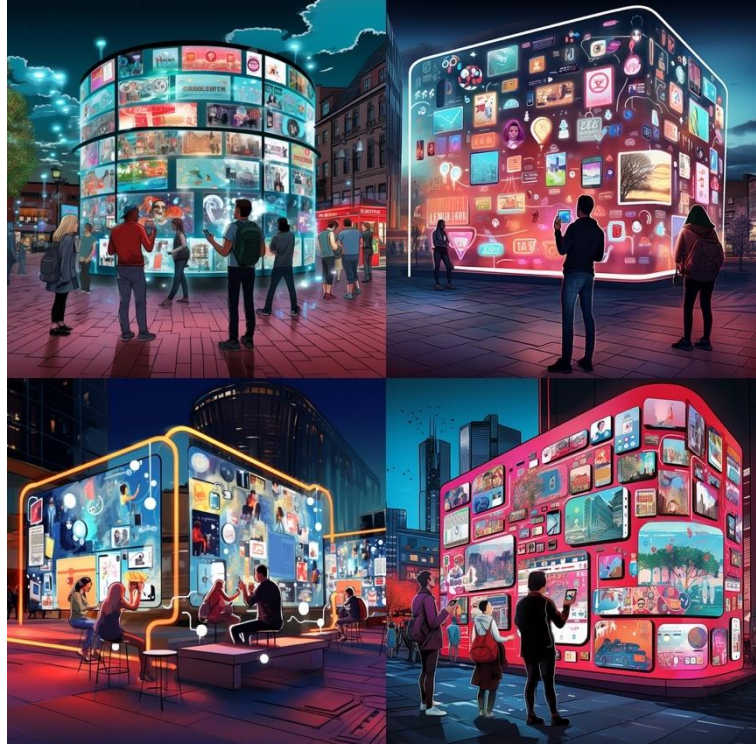
Şekil 2. Midjourney. (2025). In a bustling city square dominated by high-tech surveillance cameras and massive digital screens showcasing luxury lifestyle social media profiles, a diverse crowd of individuals remains isolated and engrossed in their devices, illustrating the intersection of capitalist consumption and digital validation [Dijital Görüntü]. Midjourney. https://www.midjourney.com/

karanlık ortam, kapitalist ideolojinin yarattığı kaygı ve baskı duygularını başarıyla aktarmaktadır. Yapay zekâ görsellerinde (Şekil 2) derin, duygusal veya deneyimsel ifade biçimi yoktur. Öğrenci çalışmasında (Şekil 1) distopik mimari, kalp ikonları ve güvenlik kameraları gibi öğeler, ideolojik eleştiriyi destekler ve güçlü sembolik anlamlar taşır. Yapay zekâ görsellerinde (Şekil 2) oluşturulan ikonlar ve ekran panolarında mecazi anlatıma başvurulmamıştır, görseller daha çok tüketim çeşitliliğini ve enformasyon yoğunluğunu vurgulamaktadır. Foucault'nun "gözetim toplumu" kuramı gibi ileri düzey teorik kavramların görselleştirilmesindeki başarı, öğrencinin konuyu sadece betimlemediğini, aynı zamanda özgün bir yorum ve bakış açısı geliştirdiğini kanıtlar niteliktedir. Yapay zekâ üretimleri ise belirli istemler (prompts) doğrultusunda, mevcut görsel veri setlerinden sentezlediği estetik çıktılar sunmakla sınırlı kalmakta ve kavramsal bir inşa sürecinden ziyade biçimsel bir kolaj sergilemektedir.