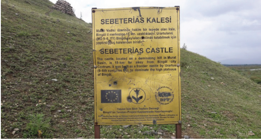
Foto 10: Sebeterias Kalesi Olarak Hatalı Adlandırılan Genç Kalesi'nin Proje Kapsamında DPT ve Avrupa Birliği ile Yerel STK tarafından Hazırlanmış Tabelası