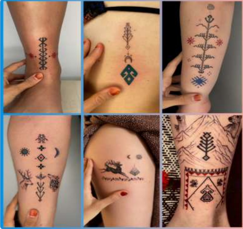
Görsel 8: Yeliz Dursun'un kilim motifli dövme tasarımlarından örnekler (Kişisel Arşiv).

çoğunluğu 25-50 yaş aralığındaki kadınlardan oluşmaktadır. Kilim motifli dövme-leri tercih edenler, kendi öz değerlerine, atalarına ve köklerine inen detayları bedenlerinde taşımaktan ötürü heyecan duymakta, ayrıca kadim motiflerin izlerinin kendilerine şifalı geleceğine dair bir inancı da temsil etmektedirler. Anadolu kilimlerinde koruyucu işlevi ile görülen muska motiflerinin, talep üzerine aynı iş-levle bedene işlenmesi bu durumun bariz örnekleri arasındadır.