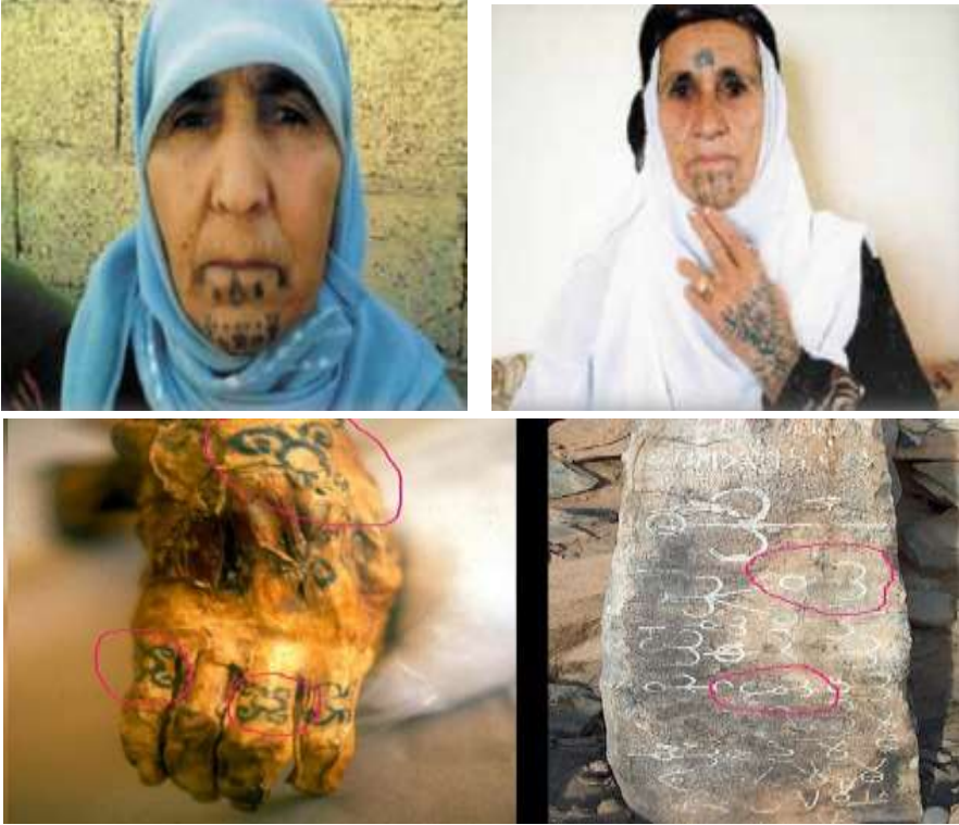
Görsel 2-3-4-5: Anadolu'dan ve Pazırık Kurganı'nda leşfedilen bir kadın mummyasından dövme örnekleri (Öncül, 2012; URL-2).

oldest-tattoos). Anadolu ve çevresinde dövme geleneği etnografik ve bölgesel çalışmalardan anlaşıldığı kadarıyla kırsal ve göçebe topluluklarda (özellikle Mardin, Şanlıurfa, Tunceli, Van civarı) kadın ve erkeklerde el/ayak/yanak/çene/kol bölgele- rine uygulanan figürler hem süs işlevi hem de özel kültürel işlevler taşımıştır. Ge- leneksel dövmelerin özellikle belirtilen lokasyonlarda yoğun olarak uygulanması- nın temelinde; etnik ve dinsel çeşitlilik, göçebe yerleşim biçimi ve bölgesel ritüel pratikler yer almaktadır (Öncül, 2012). Konuya yönelik araştırmalarda dövmelerin geleneksel olarak korunma, bereket, kötü göze karşı tılsım, kimlik/sadakat işareti veya estetik amaçlarla kullanıldığı ortaya konulmuştur.