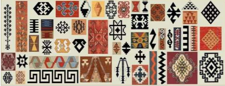
Görsel 1: Kilim motiflerinden örnekler (URL-1).

Geleneksel kilim motiflerinin simgesel bir ifade aracı olarak kullanılmasının sebepleri, halkbilimsel iletişim kuramları ve kültürel bellek perspektifinden değerlendirildiğinde daha açık hale gelir. Öncelikle motifler, işaret ve sembol düzeyinde, kültürün kendine özgü kodlarını yansıtan görsel göstergeler olarak işlev görür. Assmann'ın (1992) kültürel bellek kuramı bağlamında, bu motifler yalnızca görsel bir süsleme değil, aynı zamanda toplulukların tarihsel deneyimlerini ve ortak değerlerini görsel hafızaya kaydeden kodlardır. Halkbilimsel iletişim açısından ise kilim motifleri, "sözsüz iletişim" aracı olarak bireylerin inanç, duygu ve düşüncelerini kuşaktan kuşağa aktarmalarına imkân tanır. Örneğin koçboynuzu motifi, güç, erkeklik, bereket ve koruyuculuk simgesi olarak işlev görürken hem üretim kültürünü hem de toplumsal cinsiyet rollerini görünür kılar. Eli belinde motifi, dişiliği, doğurganlığı ve aile kurumunun sürekliliğini simgeler; böylece kadın kimliğiyle bağlantılı toplumsal değerlerin sembolik ifadesi olur. Göz motifi, kötülükten ve nazardan korunma işlevi taşır; inanç sistemlerinin gündelik yaşamla bütünleştiği bir "koruyucu işaret" niteliğindedir. Hayat ağacı motifi ise ölüm-yaşam döngüsünü, nesiller arası sürekliliği ve kutsal kozmos anlayışını temsil eder. Bu motif, bireysel yaşamın sınırlılığını aşarak kültürel belleğin sürekliliğini sembolleştirir.