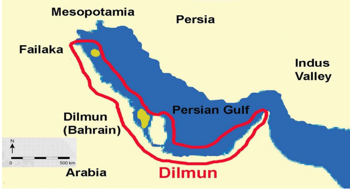
Şekil 2: Dilmun Bölgesi 63

yaklaşımına göre Dilmun, Basra Körfezi'nin ortasındaki Bahreyn adasını, Körfez'in başında bulunan Feyleke (Failaka) adasını ve bunların arasında uzanan Arap kıyı şeridini kapsamaktadır. 60 Failaka Adası'nda Dilmun kültürünün varlığını gösteren arkeolojik kanıtlar (çanak-çömlekler, damga mühürler, taş aletler ve yerleşim yerleri kalıntıları gibi) bulunmuştur. 61 Bunun yanında Dilmun'un doğu sınırının düşünülenden çok daha uzakta olduğu ve hatta İndus veya Harappa uygarlığının geliştiği İran, Pakistan ve Hindistan'ın tamamını olmasa da büyük bir bölümünü kapsadığı dile getirilmektedir. 62