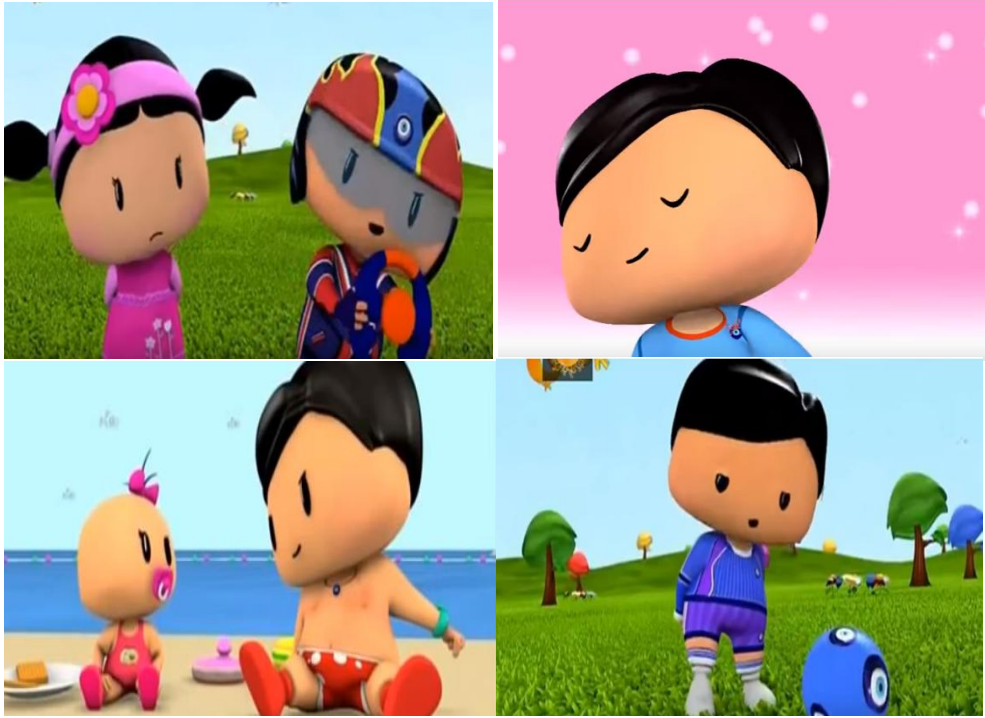
Görsel 4: Pepee Çizgi Filminde Yer Verilen Nazarlık

kullanılmıştır. Eski dönemlerde sade bir formda yapılan nazarlıklar, günümüzde zarafet, süs ve aksesuar amaçlıda kullanılmaktadır (Uygur, 2013). Bu değişim içerisinde nazarlıklar, geçmişten günümüze varlıklarını sürdürmüşlerdir. Son olarak Pepee çizgi filminde Pepee’ de inanç unsuru olarak karşımıza çıkan öğelerin sayısı pek fazla değildir. Buna rağmen çizgi film içerisine yerleştirilen birkaç inanç unsuru kendisini belirgin bir şekilde göstermektedir. Pepee’nin gerek kıyafetlerinde, gerekse çevresinde konumlanan nesnelere çoğunda nazar boncuğu kullandığı (28) görülmektedir. Dahası zaman zaman bölümlerde “Maşallah” gibi Türk kültüründe nazardan koruduğu düşünülen ifadeler Pepee’nin aile üyeleri tarafından sıklıkla kullanılmaktadır.