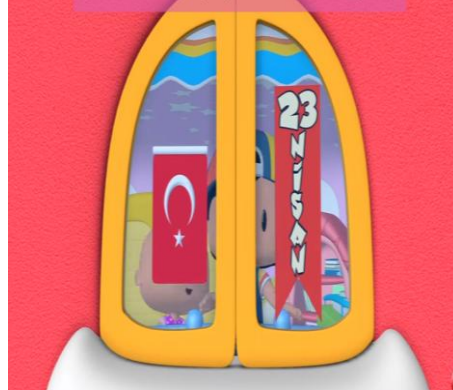
Görsel 1: Pepee Çizgi Filminde Kullanılan Türk Bayrağı Örnekleri Pepee çizgi filminde yer alan aileye ait model aşağıda verilmiştir.