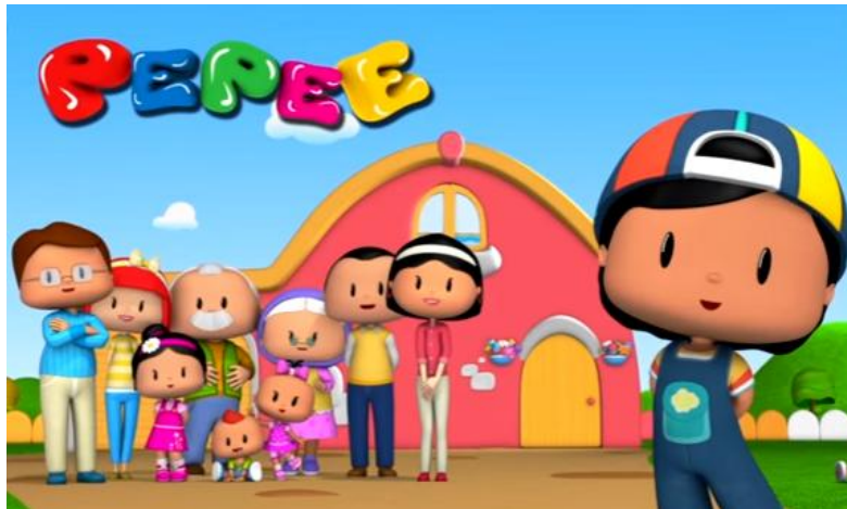
Görsel 2: Pepee Çizgi Filminde Yer Verilen Aile Üyeleri

Pepee çizgi filmde yer verilen aile üyelerine ait model incelendiğinde; bütün bölümlerde aile fertlerinden en az birisine (117) yer verilirken; en çok sırası ile Pepee'nin kız kardeşi Bebe (36), Anne (21), Dede (20) Nene (16), Baba (11), kuzeni Şıla (16) ya yer verildiği görülmektedir. Nitekim aile kurumunun Türk toplumunda ayrı bir yeri ve önemi vardır. Türk aile yapısının çoğu batılı ülkelerden farklı olarak evlilik kurumu üzerine inşa edilmiş olması; toplumu ve aile kurumunu sosyal açıdan daha sağlıklı ve güçlü hale getirmiştir (Kuru, 2016). Aile hem onu oluşturan bireylerden etkilenen hem de bireylerini sürekli olarak çeşitli derecelerde etkileyen bir sosyal sistemdir. Bu sistem, bir yandan içinde büyüyen insanın sosyalleşmesini, yetişmesini ve kişiliğini bulmasını sağlarken öte yandan da toplumun yapısını, değerlerini, beklentilerini, kurallarını ve kültürünü yansıtır (Torun, 1995). Kısacası toplumun sosyal ve kültürel temelleri aile içinde beslenir (Sarıkaya, 2004). Buradan yola çıkılarak Pepee çizgi filmde Türk kültüründe aile ve aile bağlarının önemi, çocuğun gelişiminde aile fertlerinin büyük bir öneme sahip olduğu görülmektedir (117).