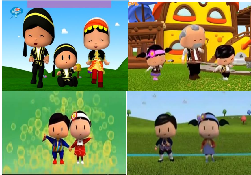
Görsel 3: Pepee Çizgi Filminde Yer Verilen Geleneksel Kostümler

Pepee çizgi filminde yer alan Müzik türlerine ait model incelendiğinde genel olarak çocuk şarkılarına yer verildiği gibi (52), folklorik olarak Türk kültürüne ait şarkılarında zaman zaman bölümlerde verildiği (9) ayrıca bu şarkılara yer verilir iken bu yörelere ait geleneksel kıyafetlerin giyildiği, danslarının da yapıldığı görülmektedir. Aşağıda bu farklı yörelere ait geleneksel kostümlere ilişkin görsellere yer verilmiştir.