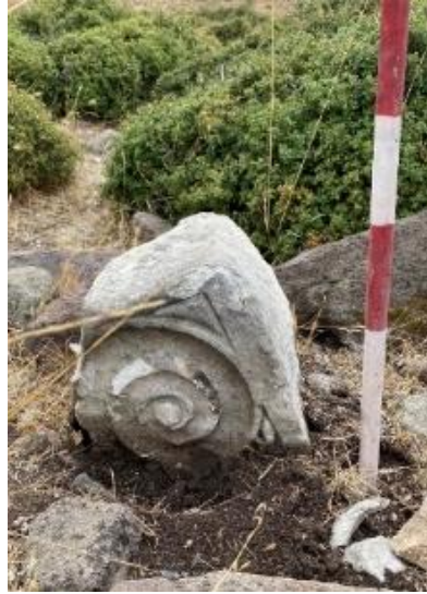
Resim 13: Sütun başlığı