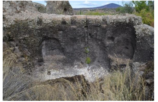
Resim 5: Preslere ilişkin mekanizmaların yerleştirildiği kaya oyukları