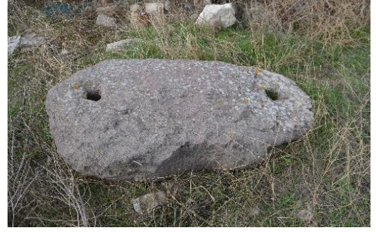
Resim 17: Preslemede kullanılmış olan ve üzerinde iki adet delik bulunan ağırlık taşı.