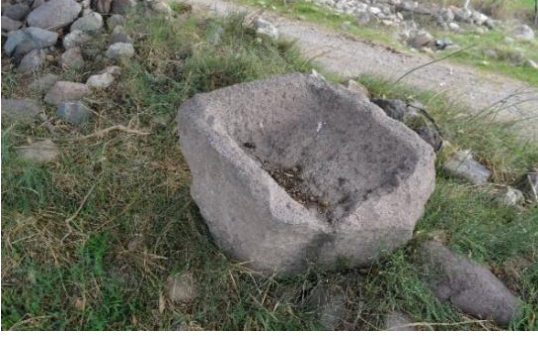
Resim 16: Bir şarap işliğine ait olabilecek kırık durumdaki çanak.

preslemede kullanılmış olan ve üzerinde iki adet delik bulunan bir ağırlık taşı tespit edilmiştir (Resim 17).