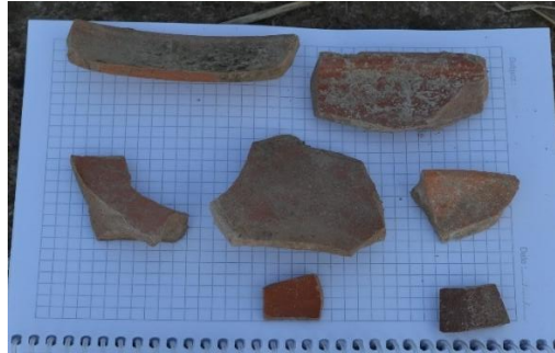
Resim 23-24: Karakova Düzü'nde tespit edilen Roma – Geç Roma dönemlerine tarihlendirilebilecek seramikler