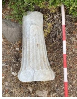
Resim 11: Masa/Altar ayağı