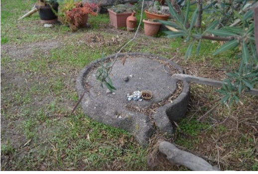
Resim 30-31: Bir zeytinyağı işliğine ait olduğu anlaşılan ezme teknesi ve ezme taşı (orbis)

Yine liman bölgesindeki yazlık evlerin bulunduğu bölgede yaptığımız taramalar sırasında etrafı duvarlar ve tel örgülerle çevrili bir yazlık evin bahçesinde birtakım buluntular dikkat çekmiştir. Bahçe içerisinde günümüzde masa olarak kullanılan bir adet granit sütun ve üzerinde bir zeytin ezme