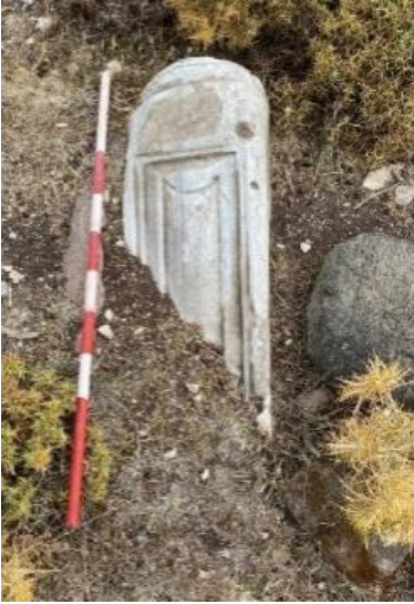
Resim 12: Korkuluk payesi