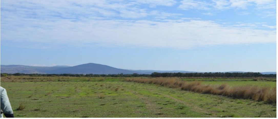
Resim 32. Hocalar mevki