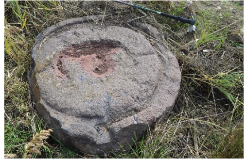
Resim 36: Zeytinyağı üretiminde kullanıldığı anlaşılan silindirik formda ezme teknesi

Yine Hocalar mevkiinde, tali yol ile dere kenarı arasındaki sazlıkların hemen dibinde bir zamanlar zeytinyağı üretiminde kullanıldığı anlaşılan silindirik formda bir ezme teknesi tespit edilmiştir (Resim 36). Ayrıca bu alanda yine tarla kenarlarında biriktirildikleri anlaşılan bazı blok taşlar ve mimari yapılara ait oldukları anlaşılan parçalar da gözlemlenmiştir.