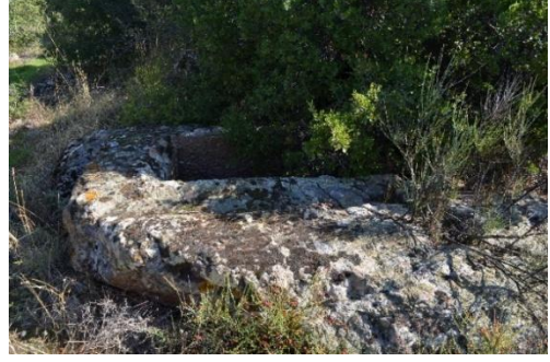
Resim 8-9. Karaağaç Tepe'de tespit edilen kaya mezarı

Bu tür kayaya oyu mezarların daha önce çok defa kullanılmış olmaları yanında, sıklıkla defneciler tarafından tahrip edilmeleri nedeniyle tarihlendirilmeleri oldukça problemlidir. Ancak, benzer mezarların genel olarak Helenistik ve Roma Dönemlerinde yaygın olarak kullanım gördükleri, dolayısıyla da bu mezarın da bahsettiğimiz dönemlerde kullanılmış olma ihtimali yüksektir.