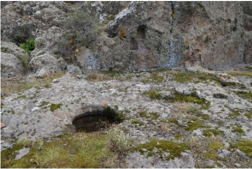
Resim 4: Preslere ilişkin mekanizmaların yerleştirildiği kaya oyukları