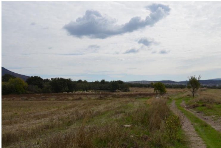
Resim 18: Karatepe

dönemlerine tarihlendirebileceğimiz kırmızı astarlı seramikler yanında Geç Bizans Dönemi'ne ait çok sayıda kazıma dekorlu sırlı seramik tespit edilmiştir (Resim 19).