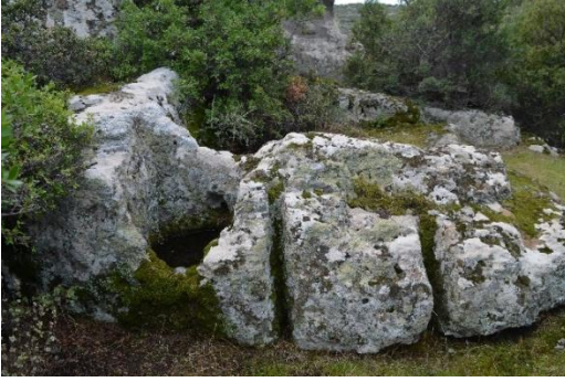
Resim 2: Biriktirme havuzu ve ezme teknesi