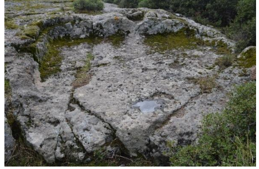
Resim 3: Biriktirme havuzu ve ezme teknesi