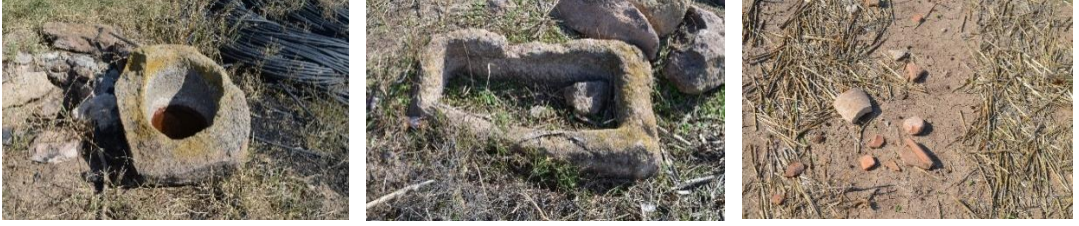
Resim 26-28: Pres çanakları ve çanaklarla birlikte yüzeye dağılmış az sayıda Roma seramikleri