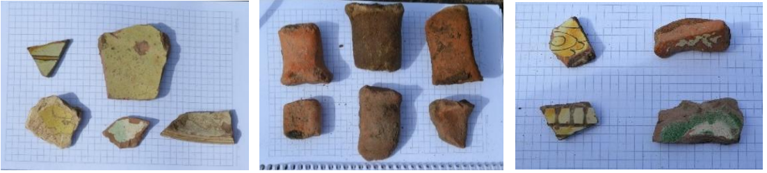
Resim 33-35: Hocalar Mevkii'nde Bizans dönemine tarihlendirilen sırlı ve sırsız seramik parçaları

Yine Hocalar mevkiinde, tali yol ile dere kenarı arasındaki sazlıkların hemen dibinde bir zamanlar zeytinyağı üretiminde kullanıldığı anlaşılan silindirik formda bir ezme teknesi tespit edilmiştir (Resim 36). Ayrıca bu alanda yine tarla kenarlarında biriktirildikleri anlaşılan bazı blok taşlar ve mimari yapılara ait oldukları anlaşılan parçalar da gözlemlenmiştir.