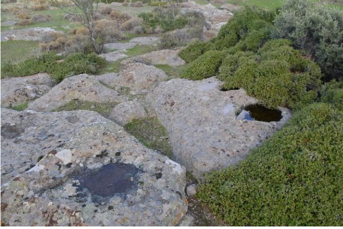
Resim 6: Andikkaya Tepe'de yer alan kayaya oygu işlikler

edilerek bazı tespitler gerçekleştirilmiştir. Burada da tıpkı Kepez Tepe'deki gibi şarap işliğine ait olabilecek birtakım kayaya oygu ezme tekneleri ve çanaklar önem arz etmektedir (Resim 6-7).