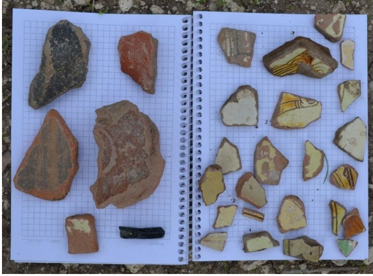
Resim 19: Karatepe’de gözlemlenen Geç Roma ve Erken Bizans Dönemi seramik parçaları