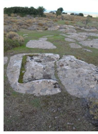
Resim 7: Andikkaya Tepe