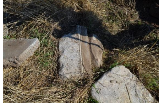
Resim 21-22: Karakova Düzü'nde tarla kenarlarında atılı vaziyette bulunan Bizans plastikleri