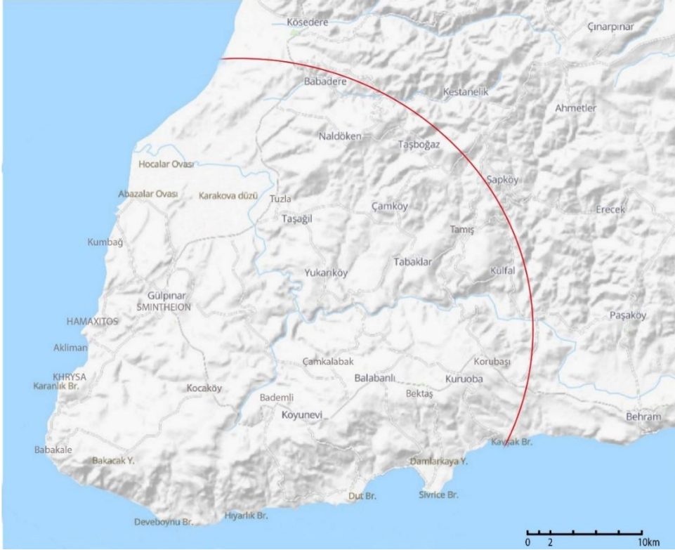
Harita 1: Smintheion ve yakın çevresi

Bu anlamda Smintheion çevresindeki kırsal yaşamı ve arazi kullanımını detaylandırmak ve ekonomik ilişkilerini çözebilmek amacıyla yerleşim alanının yakın çevresi diyebileceğimiz bir alan içerisinde kısa süreli bir yüzey araştırması planlanmıştır (Harita 1).