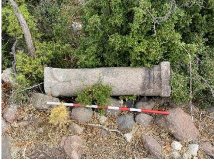
Resim 10: Çifte sütun