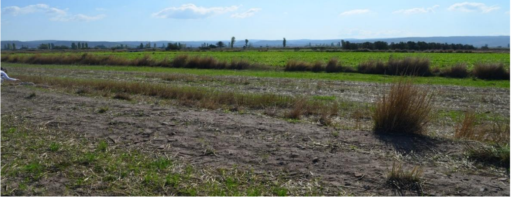
Resim 20. Karakova Düzü

döneme ilişkin bir çiftlik evinin var olabileceğini ifade eder (Böhlendorf-Arslan, 2016: 82, Abb. 23).