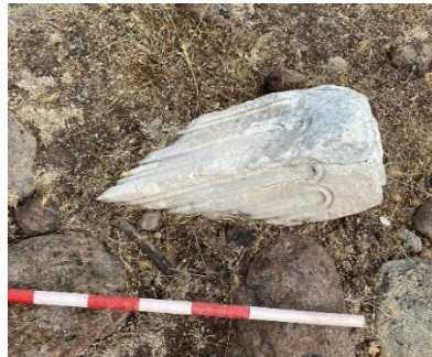
Resim 15: Korkuluk payesi