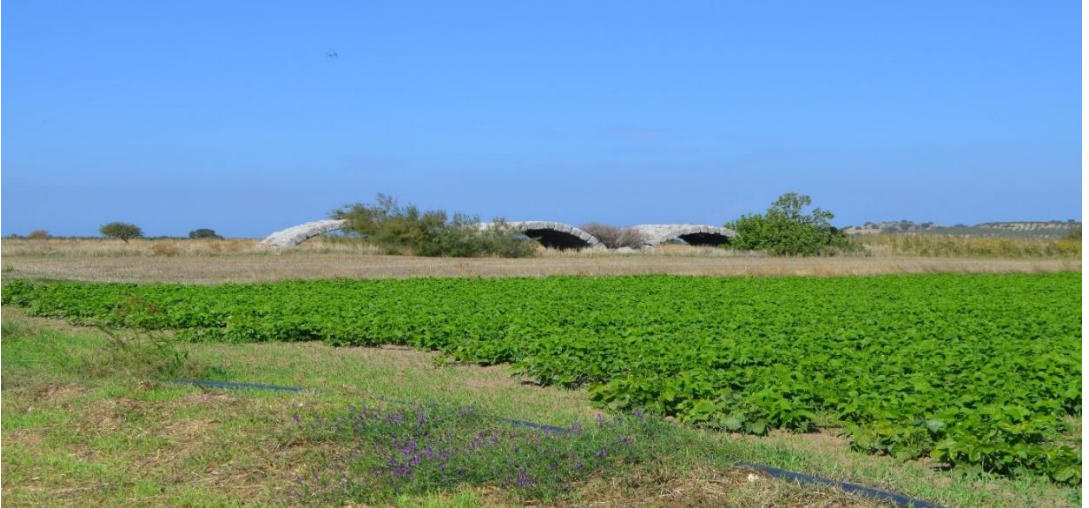
Resim 25: Yapılar Mevkii'nde bulunan Roma köprüsü kalıntıları

Sözü edilen köprü ile Geç Antik Dönem Smintheion arasındaki organik bağın daha iyi anlaşılabilmesi için bölgeye gidilmiş ve burada incelemeler yapılmıştır. Nitekim, burada köprünün hemen yakınlarındaki ekili tarlaların kenarlarında gelişigüzel olarak atılmış bazı blok taşlar ve Geç Roma-Erken Bizans dönemlerine ait olabilecek mimari plastik parçaları ve şarap üretimi ile ilgili oldukları anlaşılan presler ve çanaklarla birlikte yüzeye dağılmış az sayıda Roma seramiği tespit edilmiştir (Resim 26-28).