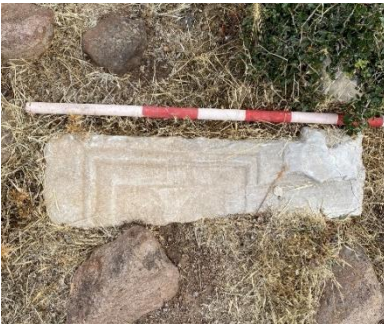
Resim 14: Korkuluk levhası