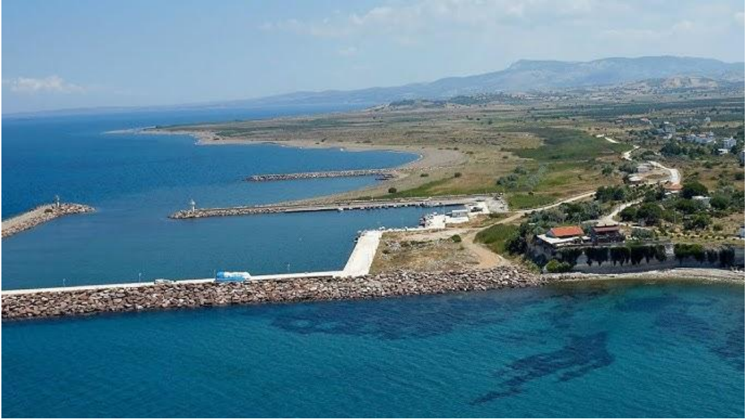
Resim 29: Kumbağlar. Doğal Liman ve arkasında uzanan yazlık evler

limandan biri yer alır. Burası bugün küçük bir balıkçı barınağı olarak hizmet vermekle birlikte, liman çevresinde çok sayıda modern yapı ve yazlık olarak kullanılan evler bulunur (Resim 29).