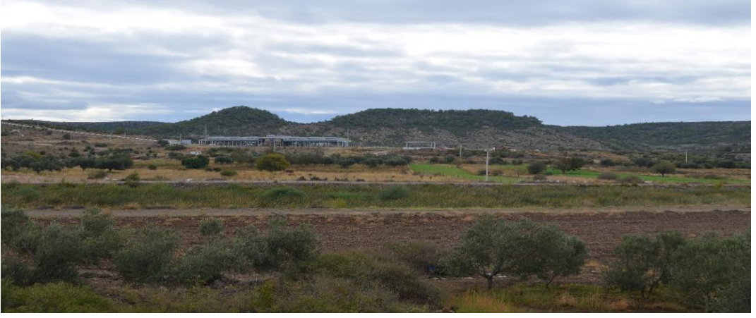
Resim 1: Kızılkeçili Köyü sınırları içerisinde yer alan Kepez Tepe ve Küçük Kepez Tepe