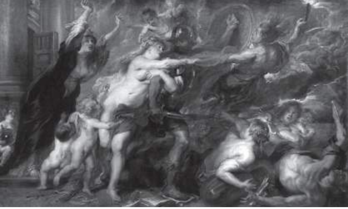
Resim 5: Savaşın Sonuçları, (1637-38), tuval üzerine yağlıboya, 206 x 342 cm., Palazzo Pitti, Floransa.