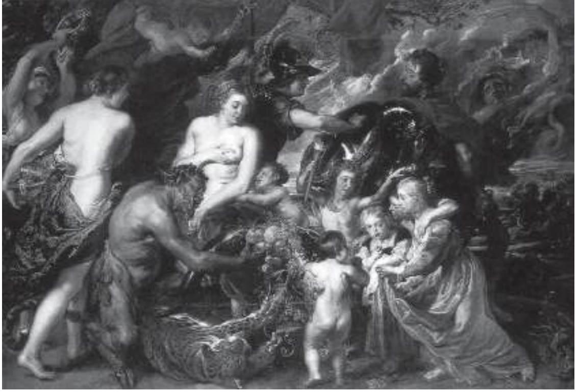
Resim 4: Barışın Kutsanması Alegorisi, (1629-30), tuval üzerine yağlıboya, 203,5 x 298 cm., National Gallery, Londra.

Bu resmi tamamlayıcı olarak, "Savaşın Sonuçları" (1637-38), resmini (Resim 5), Toskana dükü Ferdinand de Medici için yapmıştır. Bu resmin mesajı oldukça karamsardır: Savaşın korkunçluğunu hiç birşey durduramaz. Resimde, aşk tanrıçası Venüs, savaş tanrısı Mars'ın yıkıcılığını engellenmeye çalışmakta, ancak başarısız olmaktadır. Sanatçı, bu resmiyle, Avrupayı sarsan, büyük acılara yol açan, tüm zenginlikleri yok eden, Otuz Yıl Savaşları'na gönderme yapmaktadır.