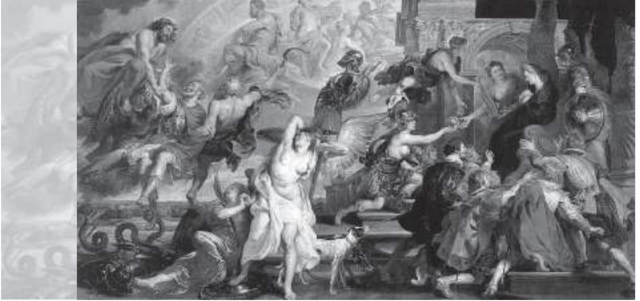
Resim 2: Henry IV.'ün Tanrısallaştırılması ve Marie de Medici'nin Naipliğinin İlanı", (1621-25), tuval üzerine yağlıboya, 3,94 x 7,27 cm., Louvre Müzesi, Paris.

Resmin sol alt köşesinden başlayan ve sağ üst köşeye doğru ilerleyen diyagonal bir eksen ile, tuval, biri büyük, diğeri küçük iki üçgene bölünmüştür. Resmin sol tarafındaki küçük ters üçgen içerisinde, Kral, ölümünden sonra, Jüpiter ve Saturn tarafından kollarından tutularak mitolojik tanrılar katına yükseltilmektedir. Bu figürleri Olimpos dağında Merkür ve Herkül beklemektedir. Bu bölümde, okla vurulan yılan, suikastçi Ravaillac'ı, kartal Jupiter'i, Saturn'un orağı, zamanın kralın yönetimini unutmayacağını, Herkül, Bourbon hanedanını simgelemekte ve Kral, Galyalı bir Herkül olarak kahramanlaştırılmaktadır. (www.louvre.fr)