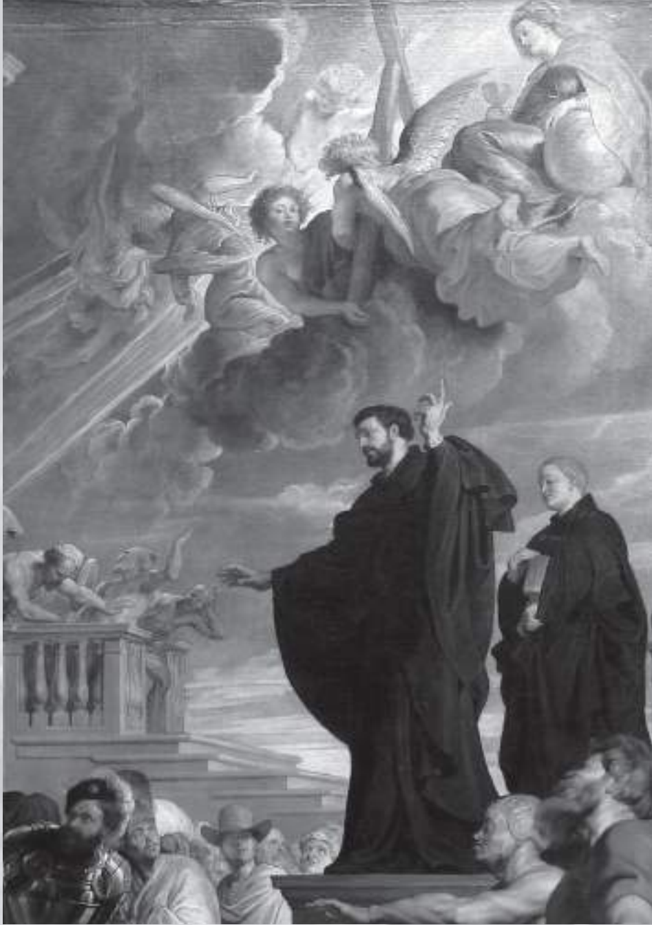
Resim 1: Aziz Francis Xavier'in Mucizeleri, (1616-17), tuval üzerine yağlıboya, Kunsthistorisches Museum, Viyana.