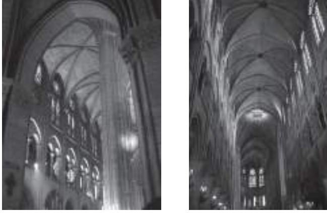
Resim 4-5: Katedralin içinden görüşler ( http://www1.cs.columbia.edu/~sedwards/photos/paris2002/Images/ )

Katedral tamamlandıktan 400 yıl sonra ilk durumu büyük değişim geçirdi. Çünkü Gotik mimari artık insanlara negatif hisler veriyordu ve barbar tarz olarak anılıyordu. Bu yüzden katedrali barok tarza getirmek için gül pencere ve vitraylar tahrip edildi. Altar bölümü daha yüksek inşa edildi ve katedralin içi beyaz badanayla kaplandı (Wilson, Hudson 1990).