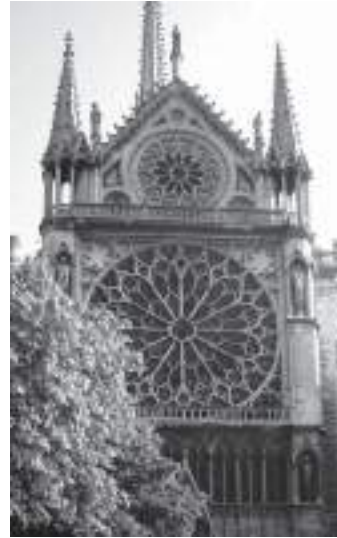
Resim 2-3: Dünyada gotik katedrallere gönderme yapabilmek için Paris Notre Dame Katedrali örnek gösterilir ( http://ndparis.free.fr/notredamedeparis/dossiers_photos/sud/parisnotredame_sud7.html ).

900 yaşından fazla olan Paris Notre Dame Katedrali, günümüzdeki strüktürüne kavuşmadan önce 1193'e kadar romanesk tarzda bir kiliseydi (Şekil 1) (Resim 4 - 5).