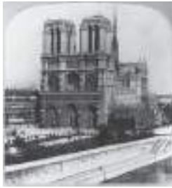
Resim 1: 1800’lerde Paris Notre Dame Katedrali, ( http://www.elore.com/gothic/history/overview/paris.htm ).

Ürpertici bir ihtişama sahip olan Notre Dame Katedrali’nin 70 metre yükseklikte olan kuleleri ancak 18. yüzyılda tamamlanabilmiştir (Resim 1, 2, 3).