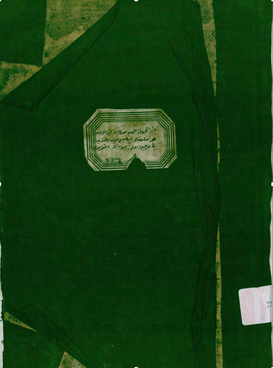
Ek-5. İstanbul Müftülüğü Meşihat Arşivi, 2283 numaralı İstanbul Medreseleri Talebe Kayıt Defteri'nin kapak görüntüsü.