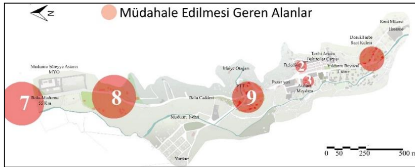
Şekil 4. Mudurnu İlçesi'nde müdahale edilmesi gereken alanlar

Yapılan görüşmeler sonucunda kadınların büyük bir çoğunluğunun kentin sirkülasyon sisteminden şikayetçi olduğu belirlenmiştir. Özellikle Bakırcılar Çarşısı'nda (2 Numaralı alan) Arnavut kaldırımlarının kilit parke taş ile değiştirilmesi kentin tarihi dokusunu bozduğu için ilçe kadın esnafını rahatsız ettiği ifade edilmiştir. Bir diğer büyük sorun teşkil eden alan da Bolu- Mudurnu yoludur (7 numaralı alan). Yapımı henüz tamamlanmamış keskin virajlı ve bozuk zeminli yol tehlikelidir. Kent dokusuyla uyumsuz, yapılaşmış, donatı eksikliği olan ve güvensiz bir diğer alan ise "Atatürk Meydanı" (3 numaralı alan)'dır. "ActionAid International" isimli STK'nın Nepal'de gerçekleştirdiği bir çalışmada ulaşım, aydınlatma, kirlilik gibi kamusal hizmet yetersizliğinden kaynaklı sorunların yaşandığı şehirlerde kadınların taciz, şiddet, korku hissine daha çok maruz kaldığı saptanmıştır (Altay Baykan, 2015). Altay Baykan (2015)'a göre kadınların ihtiyaç ve talepleri göz önüne alınarak eşitlikçi bakış açısıyla tasarlanan kentler yaşamlarına olumlu katkılar sunacaktır. O halde görüşmeler sonucunda tespit edilerek müdahale gerektirdiği belirlenen alanlarda (Şekil 4) kadınların "refah seviyesini" yükseltmek adına kadın dostu düzenlemeler ve kentsel hizmetlerin artırılmasına ihtiyaç duyulmaktadır.