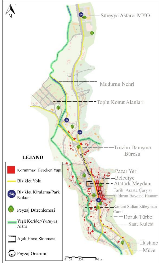
Şekil 5: Mudurnu İlçe Merkezi İçin Öneriler