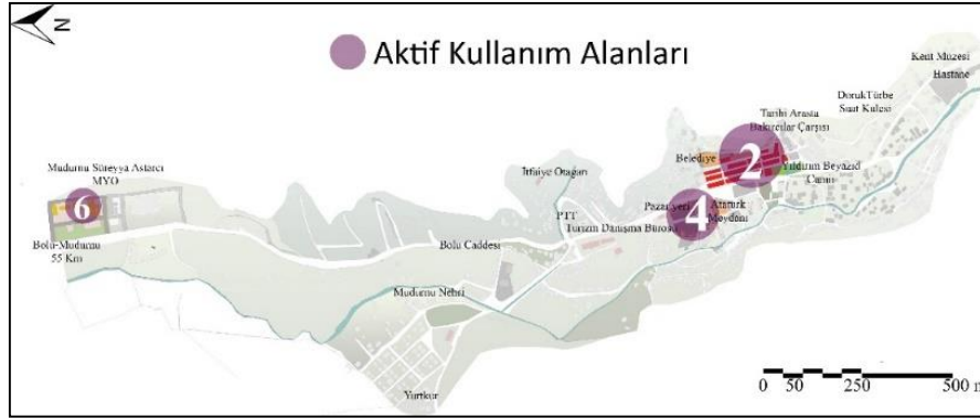
Şekil 2. Mudurnu İlçesi’nde aktif kullanım alanları