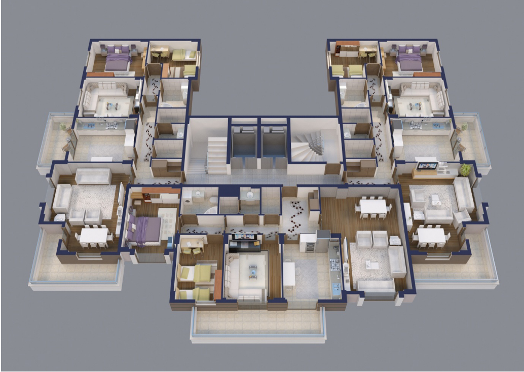
Şekil 2: Kat Planı