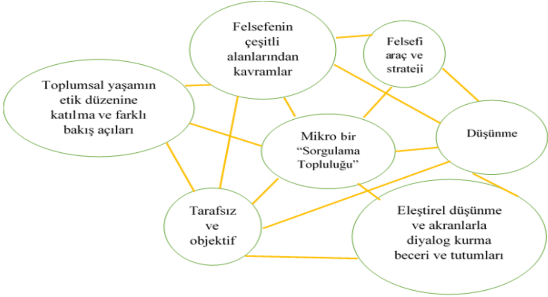
Şekil 1. Lipman Metodu Öğeleri