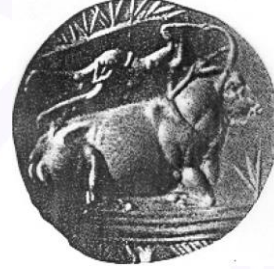
Şekil-6-Bir boğa üzerinde sporcunun uzun atlaması, Milattan önce 1500 dolaylarında, Girit