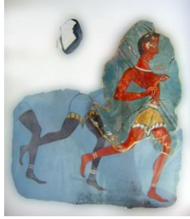
Şekil-4: Fresklerde asil Minos kadınları (Milattan önce 1500), Fresco at Knossos, Agia Triada, Koşan insanlar/Atletizm