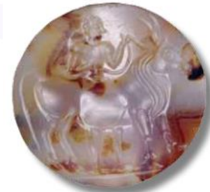
Şekil 11: Bir akik lentoid mühür, yaklaşık Milattan önce 1500-1300 yılları arasında Minoan Girit kültürüne ait.