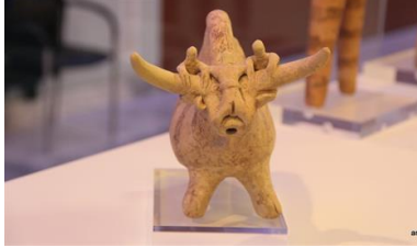
Şekil 2-Boynuzlara yapışan küçük figürler ile boğa başlıklı içecek kapları,Koumasa, Girit, Milattan önce 2000 yılları civarında.