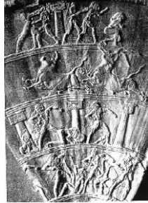
Şekil 7: Steatite talk / wax hunisi, Hagia Triada, yumruk savaşı, Boğa oyunları, Girit, Milattan önce 2000.