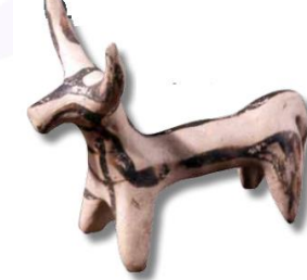
Şekil-12: Bir boğaya ait bu pişmiş toprak heykelcik, Milattan önce 1300 yılları, Rodos'ta Ialysus.