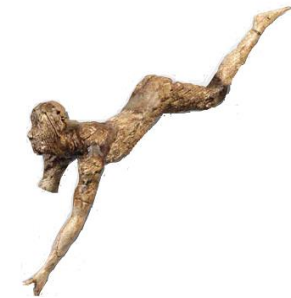
Şekil -10:Boğa üzerinden atlama: Milattan önce 1600-1500.