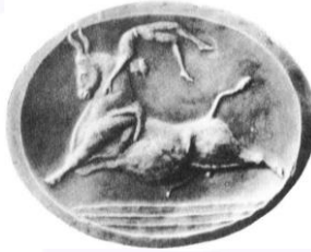
Şekil 4- Bir boğa üzerinde akrobatik bir atlama tasvir, Milattan önce 1500 dolaylarında, Girit.