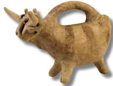
Şekil 3-Boğa başlı figürler