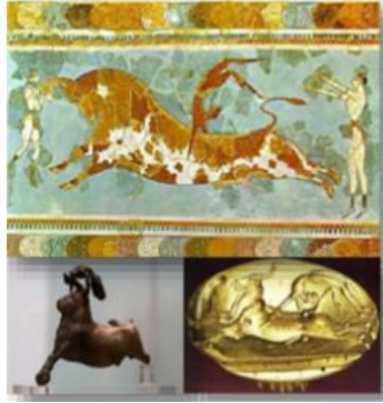
Şekil 1-Knossos Sarayı'ndan Girit boğa oyunları