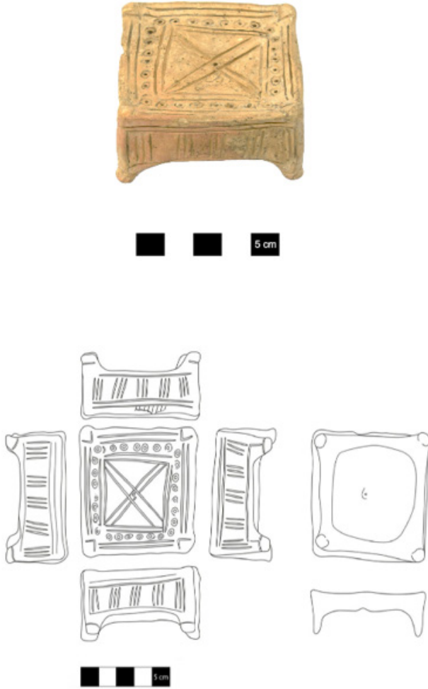
Fig. 5: 4 No.lu Objenin Fotoğrafi ve Çizimi