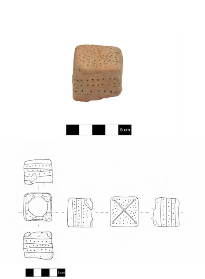
Fig. 4: 3 No.lu Objenin Fotoğrafi ve Çizimi