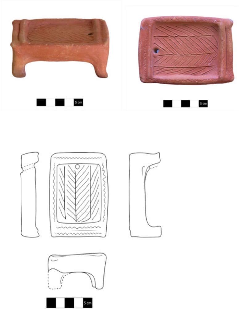
Fig. 6: 5 No.lu Objenin Fotoğrafi ve Çizimi