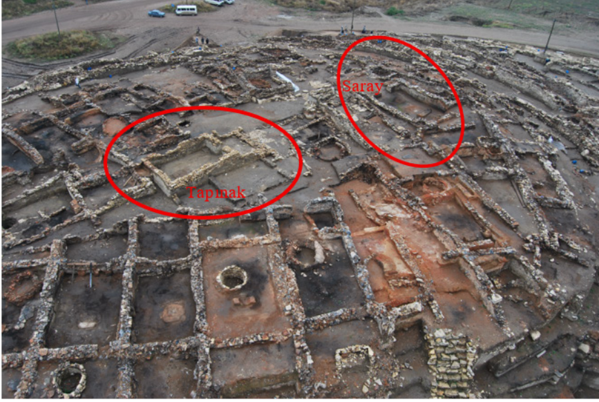
Fig. 1: Seyitömer Höyük Erken Tun Çağı Yerleşimi, Tapınak ve Saray Yapısının Konumu