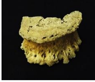
Resim 1: Osteofit

Dragos toplumunda; 18 cervical, 17 thoracal ve 4 lumbar olmak üzere 39 adet vertebra osteofit açısından incelenmiştir. Yapılan incelemeler sonucunda bir lumbar vertebra da ileri derece osteofit tespit edilmiştir. Osteofit oranı %2,56 olarak belirlenmiştir(Resim 1).