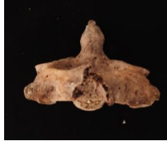
Resim 4: Cervical osteoartrit

Haliç Metro Geçiş Köprüsü Kazıları nda Metro kazısı bireyelerine ait 36 Cervical, 51 Thoracal,36 Lumbar olmak üzere toplam 123 vertebra osteofit ve schmorl nodülü açısından incelenmiştir.