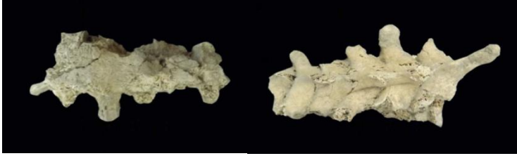
Resim 2-3: Diffüz İdiyopatik Skeletal Hiperostozis (DISH)

Dragos toplumunda tespit edilen bambu oluşumu ileri erişkin erkek bireyde görülmüştür. Bu patolojik olgunun DISH olduğu düşünülmektedir (Resim 2-3).