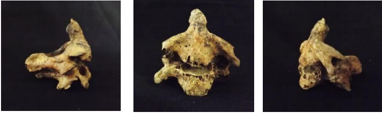
Resim 8-9: Vertebral Ankylosis

Bir eklemin kaynaması ya da sertleşmesi sonucu hareket yeteneğinin ileri derecede kısıtlanması anlamına gelen vertebral ankylosis Metro toplumunda ileri erişkin erkek bir bireyin vertebralalarında gözlenmiştir (Resim 8-9).