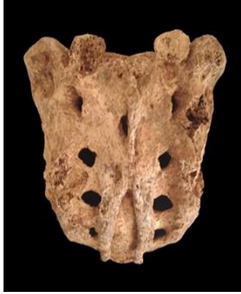
Resim 10: Spina Bifida

Metro kazılarında ele geçirilen 14 bireye ait 5 sacrumun 1'inde (%20) spina bifida olgusuna rastlanmıştır. Spina bifida ileri erişkin erkek bireyde gözlenmiştir (Resim 10).