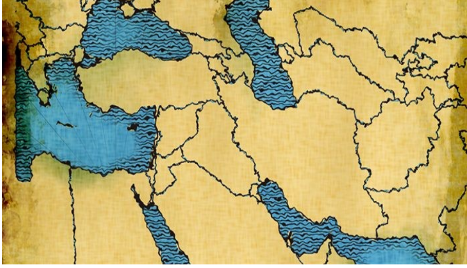
Şekil 1. Ortadoğu Haritası.

denizi, Karadeniz ve Akdeniz üzerinden enerji hatlarını birleştirmek için bu tanımlara ihtiyaç duymaktadır. Nitekim süreç içerisinde birçok toprağın Ortadoğu içerisinde belirtilmesi, coğrafi olmaktan ziyade siyasi temel üzerine dayanmaktadır 11 .