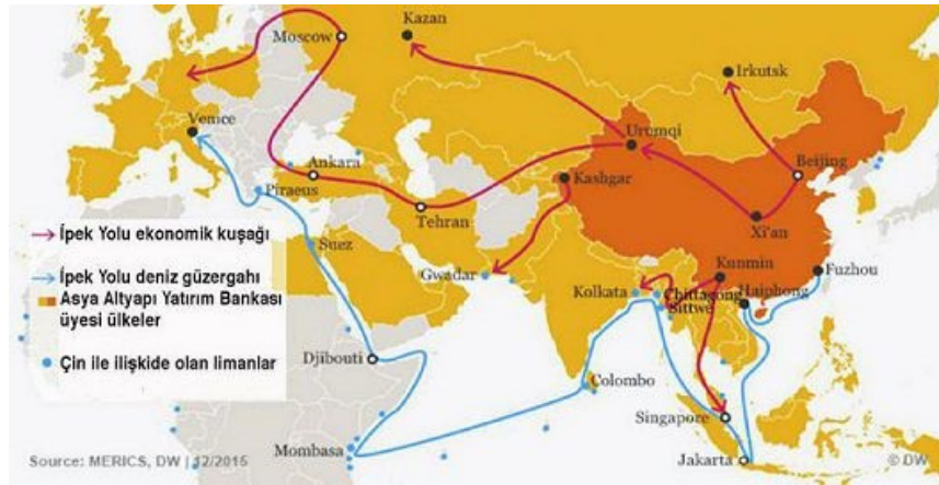
Şekil 4. Bir Kuşak Bir Yol Haritası.

atmıştır. Yaklaşık 70 ülke ve 3 kıtayı birleştirecek olan yol projesi ile dünya sahnesine çıkan Çin, dünya ekonomik sahasında önemli bir konuma sahip olmak istemektedir 35 . Proje doğrultusunda çalışmalarına hız kesmeden devam eden Çin Hükümeti, projenin sürdürülebilirliği için ulusal ve uluslararası düzeyde birçok toplantı yapmakta ve yüzyılın ekonomik kuşağını temellendirmeye çalışmaktadır. Özellikle Ekonomik yatırımların desteklenmesi ve projenin parasal boyutta sistemleştirilmesi için 2013 yılında kurulan Asya Altyapı Yatırım Bankası bu çalışmaların başında gelmektedir 36 . (Bir Kuşak Bir Yol Haritası İçin Şekil 4'e Bakınız) 37 .