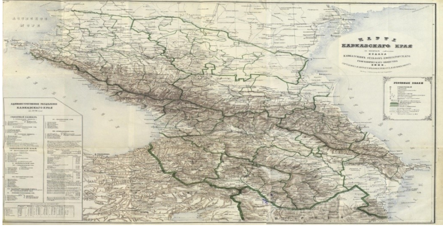
Şekil 2. Kafkasya Haritası.