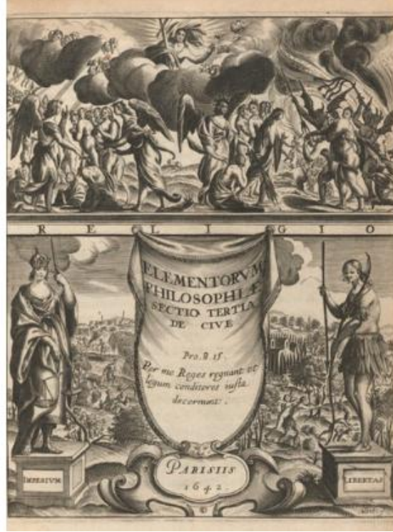
Şekil 1: De Cive kapak görseli.

doğa/kaos) ve imperium (düzen/adalet) karşıtlığı, yurttaşın karşı karşıya olduğu varoluşsal tercihi simgeler.