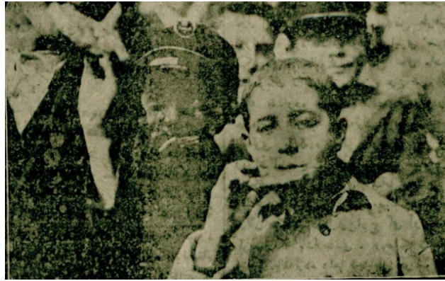
Resim 2: Öğrenciler Dağıtılan Poğaçaları Yerken, Milliyet, 24 Şubat 1926,3.

Türkiye Hilâl-i Ahmer Cemiyeti İstanbul Merkezi'ne bağlı Beyoğlu Şubesi tarafından 23 Şubat 1926 tarihinde ilk mekteplerde öğrenim gören öğrencilere toplamda 1246 poğaça dağıtılmıştı. 40 28 Mart günü de şube tarafından bölgedeki okullara dağıtılması için poğaça hazırlanmış ve okullara yollanmıştı. 41