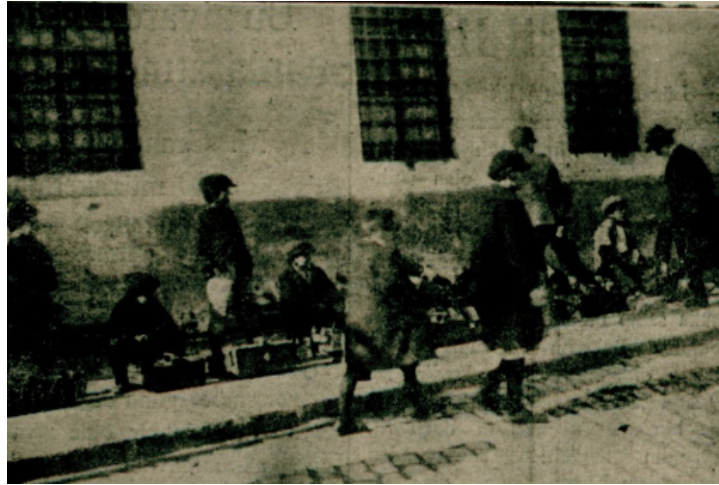
Resim 1: Milliyet, 18 Kanunuevvel 1928, 1.

Aradan hayli zaman geçmesine rağmen Maarif Müdüriyetinden Türkiye Hilâl-i Ahmer Cemiyeti İstanbul Merkezi'ne gıda yardımı yapılacak öğrencilerin listesi gelmemiş, çocuklara gereken gıda yardımı yapılmamıştı. Hem maddi yetersizlikler hem de listelerin gelmemiş olması gergin bir hava oluşmasına sebep olmuştu. Yardım alamayan çocukların eğitimlerini bırakabilecekleri belki de ayakkabı boyamak için sokaklarda çalışabilecekleri ihtimali bir görselle paylaşılmış, gerekli adımların atılması istenmişti. 33