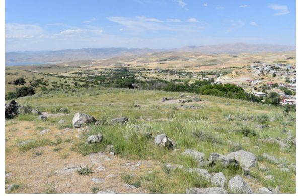
Mağaradamı Yerleşimi