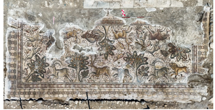
Mozağin genel görünümü.

Kazıların ilerleyen aşamalarında, mozağin hemen batısında muhtemel şarap mahzeni ve mimari duvar kalıntıları açığa çıkarılmıştır. Düzgün kesme blok taşlardan oluşan mahzenin derinliği yaklaşık 1,5 metredir. İşliğin kot seviyesi mozaikten 0.50 m derinde olup bulunduğu alana 5 basamaklı bir merdiven ile inilmektedir. İşliğin, mozaığın ve aşağıda değinilecek olan deponun hemen yakınında yer alması şarap mahzeni olabileceği ihtimalini kuvvetlendirmektedir (Görsel 4).