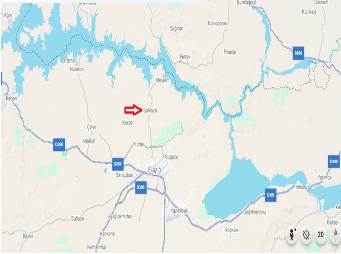
Salkaya Köyü Konumu.

Salkaya Köyü'nün yaklaşık 2 km kuzeyinde köyün bitiminde ve Tunceli karayolunun 350 m. batısında 236 ada 19 parselde yer alan alanda tarımsal faaliyetlerde bulunan bir çiftçi tarafından mozaiğe denk gelinmiştir. Fidan ekimi sırasında mozaiğe denk gelen çiftçi durumu Elazığ Müze Müdürlüğü'ne bildirmiştir. Müze müdürlüğü tarafından yapılan incelemelerde alanda taban mozaiği olduğu anlaşılmıştır. Mozağin doğal ve beşeri etkenler nedeniyle zarar görmesini engellemek ve olası devamlılığını tespit etmek amacıyla kazı ve sondaj çalışmalarının yürütülmesi kararlaştırılmıştır (Görsel 2).