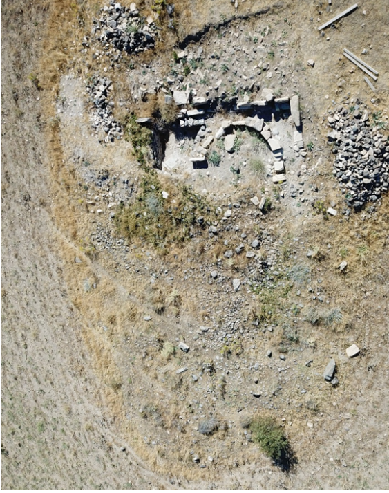
Kilise (Salkaya kazı arşivi)

Salkaya Köyü'nde yer alan yerleşim alanı hakkında gerek antik kaynaklarda ve gerekse modern kaynaklardaki bilgilerimiz yok denecek kadar azdır. Elazığ bölgesini ziyaret eden seyyahların notlarında da Salkaya Köyü'ndeki yerleşim hakkında herhangi bir bilgiye rastlanmamıştır. Bu durum muhtemelen bölgenin seyyahların güzergâhında yer almamasından kaynaklanmaktadır. Kazı alanının yaklaşık 3 km güneyinde tepelik alanda Mağaradamı olarak adlandırılan bir yerleşim yer almaktadır (Özdemir, 2023, ss. 269-270). Yerleşimde neolitik, tunç ve demir çağları ile daha geç dönemlere ait buluntuların olduğu yüzey araştırması ile tespit edilmiştir (Özdemir, 2023, s. 11). Mağaradamı Yerleşimi'nde mimari yapıların temellerinin varlığı bilinmektedir (Görsel 8). Bunun yanı sıra Salkaya kazı alanına en yakın tarihi yerleşim yeri Harput'tur. Harput tarih öncesi dönemlerden günümüze değin sürekli yerleşim görenek birçok medeniyete ev sahipliği yapmıştır (Ardıçoğlu, 1964; Gaspak, 2015; Kızıroğlu, 2022; Özdemir ve Can, 2024). Osmanlı Dönemi'ndeki adıyla Hersenk Köyü'nün Harput'la ilişkili bağlantısını gösteren yazılı belgeler Osmanlı Dönemi şer-iyeleridir (Danık, 2015, s. 125). Yine Osmanlı Dönemi salnamelerinde Hersenk Köyü'nde kale yapısının ve antik harabelerin bulunduğu ifadesi geçmektedir (Duruksu, 2015, ss. 55-56). Burada Hersenk Köyü'nde antik binaların varlığından ve bir yerleşim alanından bahsedilmektedir. Yine aynı metinde Hersenk Köyü muhafazası için bir kale yapısından bahsedilmektedir.