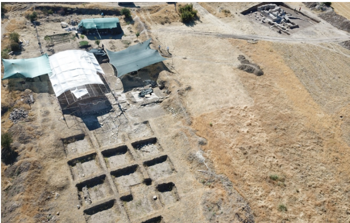
Kazı alanı havadan genel görünümü (Salkaya kazı arşivi).

Mozağin açığa çıkarılması amacıyla Elazığ Müze Müdürlüğü tarafından 01 Ağustos 2023 tarihinde bölgede arkeolojik kazı ve sondaj çalışmalarına başlanmıştır. Mozaikli alanda yapılan çalışmalarda yer yer farklılık gösterse de yürüme seviyesinden 0.40 m. derinliğindeki mozaik tamamen açığa çıkarılmıştır. Yaklaşık 84 metrekarelik alanı kapsayan mozağin etrafını temeli sağlam kalmış örgü taş duvar ve blok taşlar çevrelemektedir. Bu yönüyle bir kabul salonu görüntüsü veren mozaikli alanın kuzey doğu ve güney yönünden olmak üzere 2 girişi bulunmaktadır. Kuzey doğu yöndeki giriş alanın zemini blok taşlardan oluşmakta ve karşılıklı 2 sütun kaidesi yer almaktadır. Kuzey doğu yöndeki bu girişin güney yöndeki girişe oranla daha özenli olması soylu ve misafir girişi olabileceğini düşündürmektedir. Güney taraftaki giriş kısmında özenle işlenmiş detay görünmemektedir. Güney girişin aşağıda değinilecek olan şarap mahzeni tarafında yer alması görevli kişilerin giriş kapısı olduğunu düşündürmektedir.