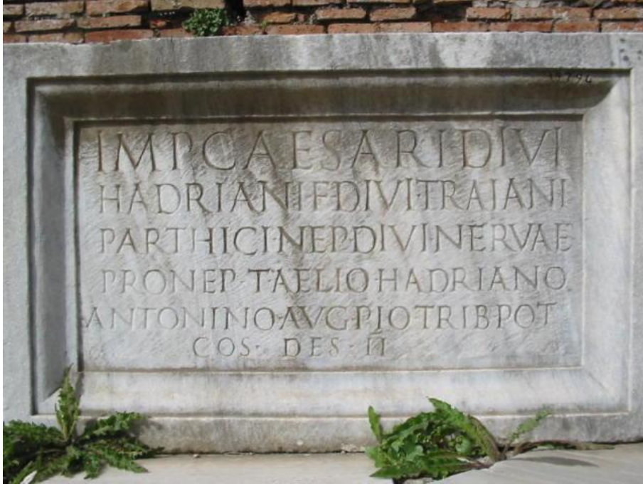
Resim 2. Ostia Antica'da Antoninus Pius'a adanmış bir yazıt. 17 (M.S. 138)

1 IMPERATORI · CAESARI · DIVI HADRIANI · FILIO · DIVI · TRAIANI PARTHICI · NEPOTI · DIVI · NERVAE PRONEPOTI · TITO · AELIO · HADRIANO 5 ANTONINO · AVGVSTO · PIO · TRIBVNICIA · POTESTATE CONSVLI · DESIGNATO · II