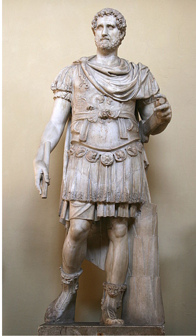
Resim 1. Antoninus Pius 16

Antoninus, bir akşam yemeğinde Alp peynirini fazla kaçırdıktan sonra ateşlendi, durumu ağırlaşınca, devleti ve kızını M.S. 138 evlat edindiği Marcus Aurelius'a teslim etti. M.S. 7 Mart 161 yılında öldü. Evlat edindiği iki oğlu Marcus Aurelius Antoninus ve L.Aurelius Verus birlikte imparator oldular.