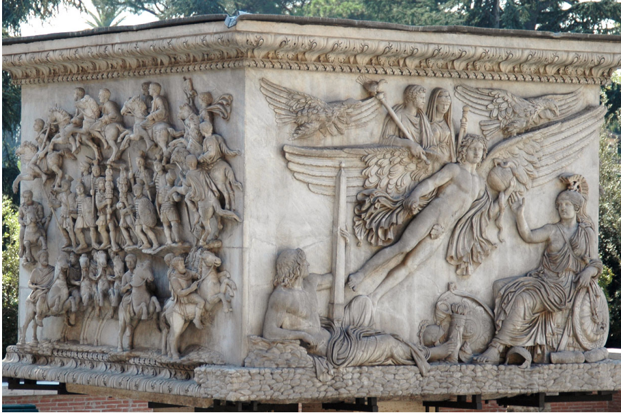
Resim 3. Antoninus Sütunu. Antoninus ve Faustina'nın ölümünün kollarında tanrılaşdırılması. 18 (M.S. 161 Roma)