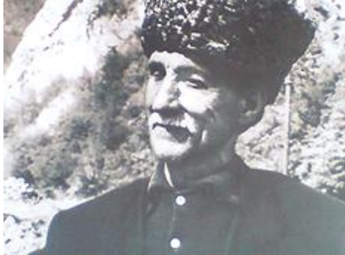
Şekil 2. Âşık Şemşir GOCAYEV.

20. yüzyılda Azerbaycan saz sanatının ve söz dünyasının ünlü ozanı Kurbanoğlu Şemşir Gocayev (bkz: Şekil № 2) 15 Mart 1893 yılında Kelbecer ilinin Demirçidam köyünde