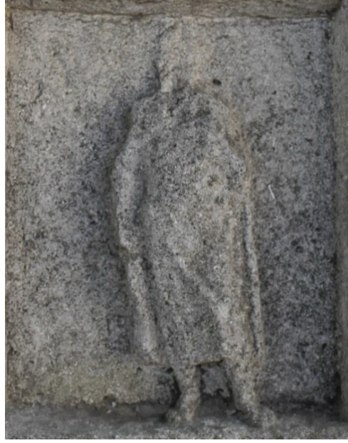
Kat Nr. 4