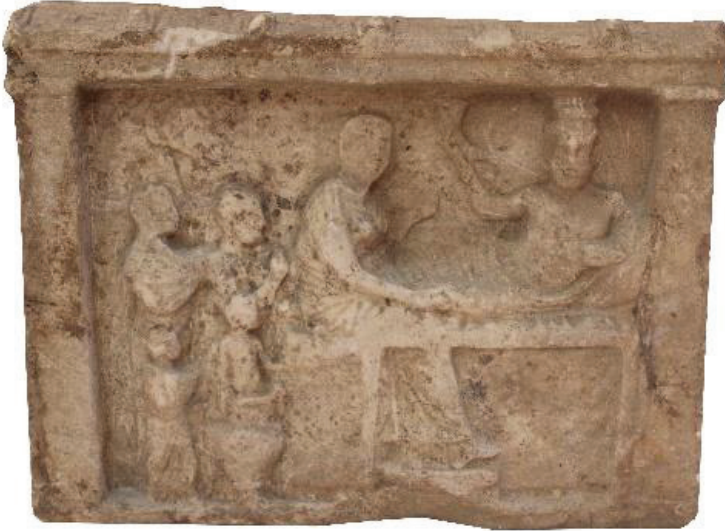
Kat. Nr. 7

Figürler üzerindeki giysi kıvrımlarına baktığımızda; gerek Sinop ve gerekse Samos steli üzerindeki erkek ve kadın figürlerinin giydikleri khimationun üzerinde görülen yay çizen derin kanallı kıvrımlar, oturan kadın figürünün etek kısmındaki aşağı doğru sarkan yuvarlak sırtlı, paralel giden kıvrım yapısı büyük ölçüde benzerdir. Sinop stelinin yüzeyinin yer yer tahrip olmuş olması, kıvrımların tam olarak tespit edilmesini güçleştirmekle birlikte İstanbul ve Samos örnekleri dikkate alındığında stelimizi M.Ö. 1. yy.'ın başlarına tarihlemek uygun olacaktır.