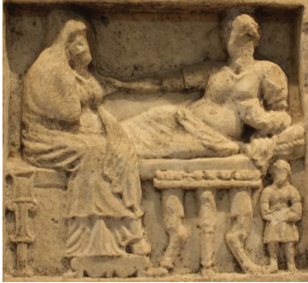
Kat. Nr. 6