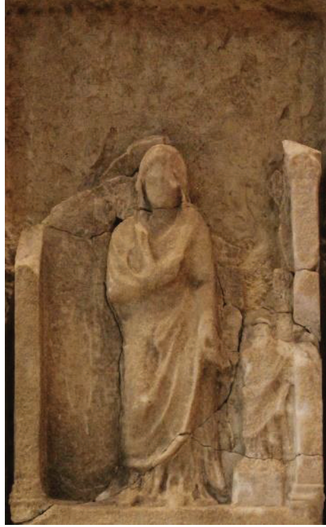
Kat. Nr. 9