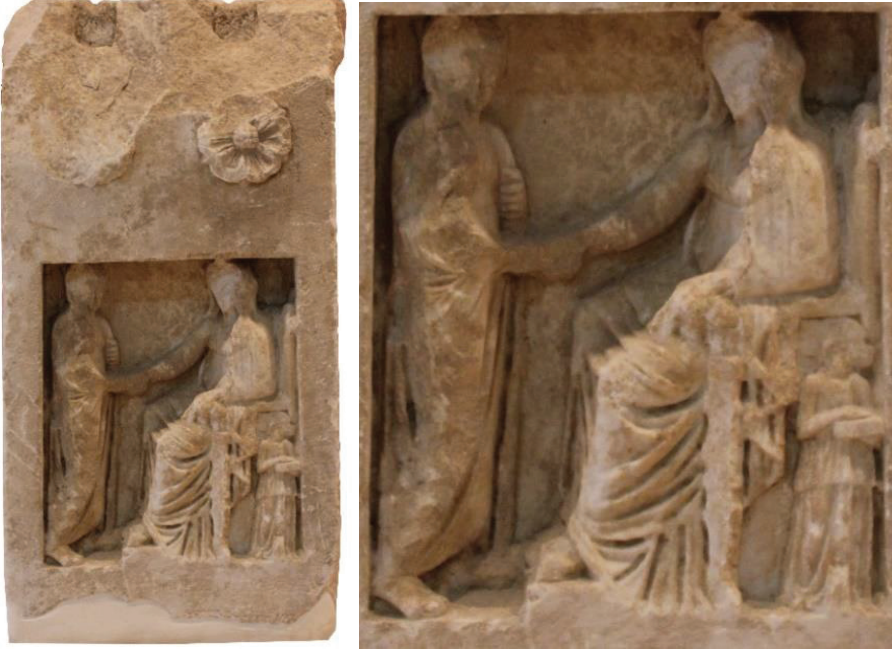
Kat. Nr. 2

tanrıça, yine khiton ve üzerine khimation giymiş olarak tasvir edilmiştir. Göğüsler üzerine yerleştirilen kemer, khimationun geniş, bol ve kalın kıvrım yapısı, aşağı doğru sarkan derin ve geniş kanallı kıvrımlar üç eserde de izlenen genel özelliklerdir. Bu özellikler ışığında Sinop örneğini M.Ö. 2. yy.'ın ortalarına tarihleyebiliriz