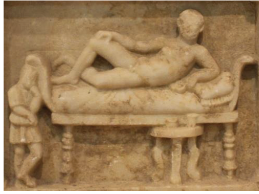
Kat. Nr. 8