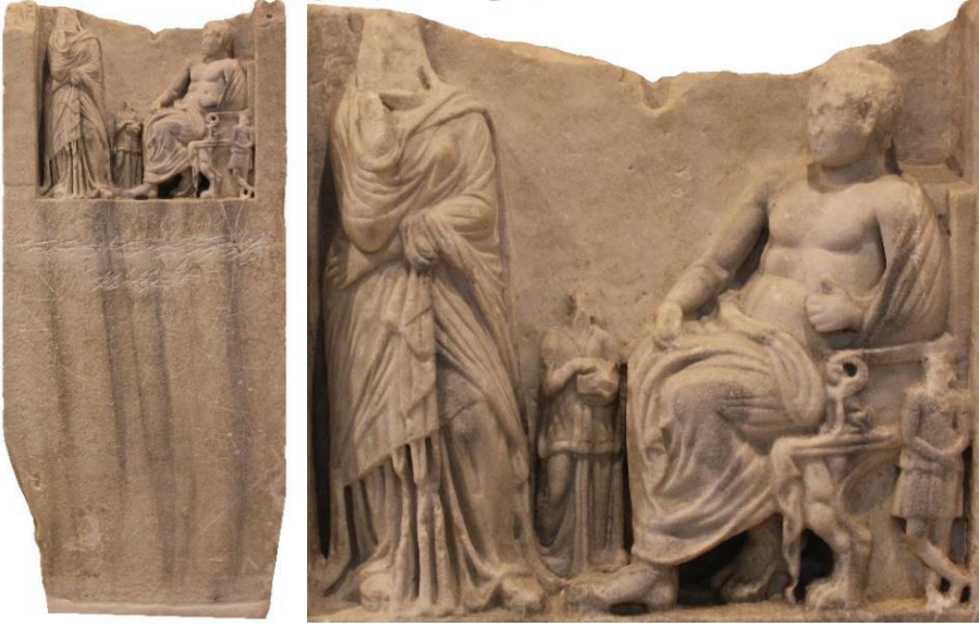
Kat. Nr. 3