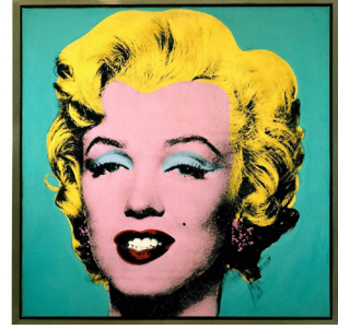
Görüntü 2 (Solda). “Telephone” Müzik Klipinden Bir Sahne. Görüntü 3 (Sağda). Warhol’un “Marilyn Monroe” Serisinden Bir Baskı.