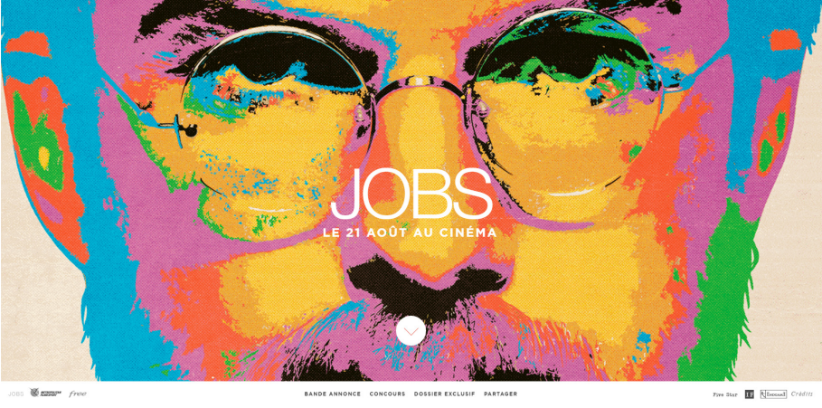
Görüntü 1. "Jobs" İnternet Sitesi Ekran Görüntüsü.

Warhol'un biçemi kurumsal ağ siteleri ve çevrimiçi tanıtım malzemelerinde de kullanılmaktadır.