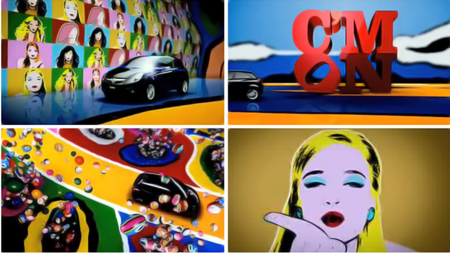
Görüntü 10. Vauxhall Corsa Reklamı.

Bir otomobil reklamında Warhol'dan esinlenilmesi bir anlamda da ilginçtir çünkü satılmakta olan ürünün Warhol'un hayatı ya da çalışmaları ile ilgisi yok denecek kadar azdır, denebilir. Sanatçının ünü ürünün satışı için veya satışının artması için büyük kitlelere tanıtılması amacıyla kullanılmaktadır.