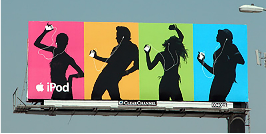
Görüntü 4. Apple İpod Taşınabilir Müzikçalar Açık hava Reklamı.

ğında - bunlardan bir tanesi Apple şirketinin dans eden insan figürü silüetlerinin renkli arka planlar üzerinde resmedilmesiyle hazırlanmıştır - genellikle her çeyrekte farklı ve tamamlayıcı figürler bulunan dörtlü çalışmalar olduğu görülür (Bkz. Görüntü 4). Bu reklamlar, gerçek aktörlerin video görüntülerinden yakalanan karelerin bilgisayar teknolojisiyle boyanmaları sonucu oluşturulur ve birden fazla medyumun harmanlanmasını avantaj olarak kullanır.