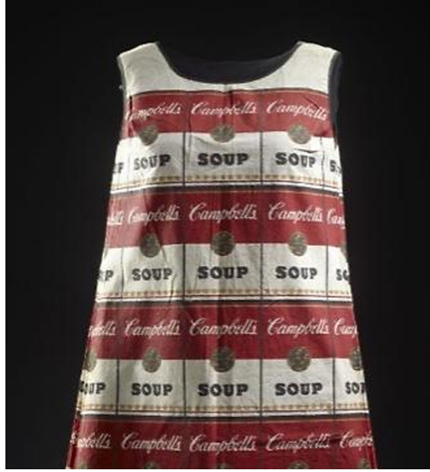
Görüntü 7. "Souper" Elbise.

Bu eser günümüzde saygı görürken, o zamanlar garip ve kötü olarak nitelendirilmiştir. Çağdaş moda ve tekstil dünyası grafik tasarımın işlevselliğini kullanarak Warhol'un Campbell çorbası üzerinden yaptığı tüketim kültürü yorumlarından esinlenerek tek kullanımlık kâğıt elbiseler tasarlamıştır (Bkz. Görüntü 7).