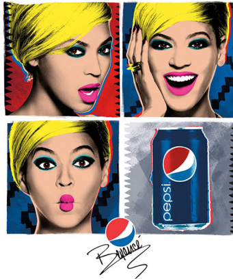
Görüntü 11. "Live just just for NOW" Kampanya Afişi

Warhol'un imgeleminden etkilenen bir başka örnek ise 2013 yılında ülkemizde de yayınlanan Pepsi'nin "Live just just for NOW" kampanyası reklamıdır (Bkz. Görüntü 11). Tasarım biçimsel açıdan incelendiğinde Warhol'un Marilyn Monroe serisi ve bazı diğer çalışmalarındaki gibi çoklu kompozisyonu, aşırı canlı renkleri sadeleştirilmiş portre fotoğraflarına uygulama tekniği kullanıldığı açıkça görülmektedir.