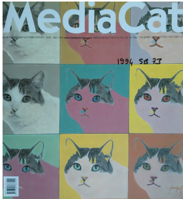
Görüntü 5. Mediacat 2007 Şubat Sayısı Kapaak Tasarımı.

Warhol'un grafik tasarıma olan etkisi ülkemizde yayınlanan çalışmalarda da özümsemiştir. Mediacat Dergisi 2007 yılı Şubat sayısı kapağındaki çalışmada (Bkz. Görüntü 5) sanatçının ipek baskı tekniğiyle kullandığı tekrarcı yaklaşımının ve sadeleştirdiği fotoğraflar üzerinden ürettiği ritmik renk biçiminin etkisi açıkça görülmektedir.