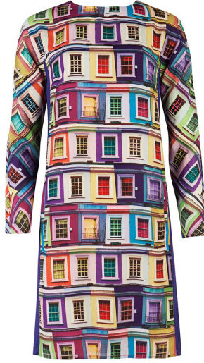
Görüntü 8. Ted Baker "Pop Art" Elbise.

Andy Warhol'un çalışmalarının "Souper" elbise üzerinde görsel doku olarak kullanılması moda tasarımcılarına ilham kaynağı olmuştur. Günümüzde hem Warhol etkileri taşıyarak sadeleştirilmiş ve renklendirilmiş imge tekrarından oluşan ritmik yapısına dayanan (Bkz. Görüntü 8) hem de sanatçının eserlerinin doğrudan imgesel doku olarak kullanıldığı pek çok tekstil ürünü satılmaktadır.