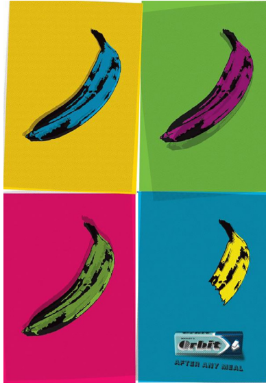
Görüntü 6. Orbit Sakız Reklamı

Warhol'un üretim sırasındaki farklılıkları ve hataları kabullenerek çoğaltma yaklaşımına dört muz arasındaki küçük farkları içeren Orbit sakız reklamında öykünlüştür (Bkz. Görüntü 6). Bu tasarımda da yine fotoğraftan yola çıkılmış, sadeleştirilen imgenin arka planında kullanıldığı bir dördü kompozisyon oluşturulmuştur.