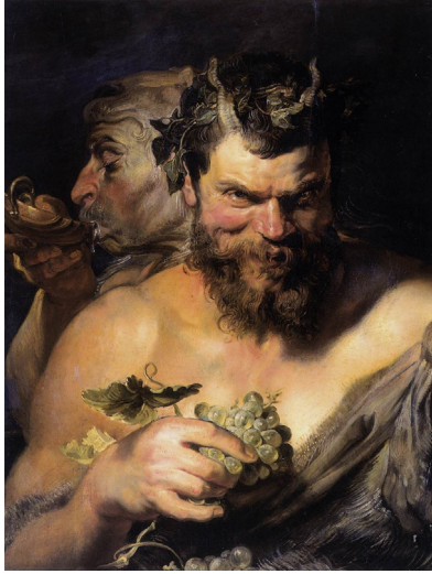
Görsel 1. Peter Paul Rubens, İki Satir, 1619, Tuval Üzerine Yağlıboya, 76 x 66 Cm

Dionysos, bir doğa tanrısıdır. Bitkileri ve bu bitkilerin insanları en çok etkileyenlerini simgeler. Ama onun simgelediği asıl büyük güç, doğadan çok, insanla doğa arasındaki ilişkidir; insanı doğanın sırlarına ulaştıran