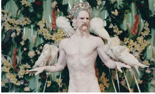
Görsel 6. Mathew Barney, Cremaster 4 , 1994

'Cremaster 3', tümüyle Hiram Abiff'in Mason mitine ve Kelt mitolojisine dayanır. Film, Kelt mitolojisinden bir hikâyenin anlatımıyla başlar. Daha sonra New York'a, Chrystler binasına gideriz. Burada, sembolik ve simgesel bir Hiram Abiff – çırak mücadelesini izlemeye başlarız. Mason mitine göre Hiram Abiff, ya da Mimar, evrenin sırlarına sahip olan Solomon'un tapınağını inşa etmektedir. Çırak da bunu engelleyecek ve Abiff'i öldürecektir. Burada, inşa edilen Chrystler binasıdır. İnşaata sabote eden çırak da Mathew Barney'nin kendisidir. Film boyunca Mason sembollerini ve Mason felsefesinin izlerini görürüz. Mason kardeşliğinin ayinleri, 5 bölümlük Cremaster döngüsünde alegorik ifadelerle yinelenir. Cremaster 3, başladığı gibi, Kelt mitolojisinden aldığı hikâyeyle biter 4 .