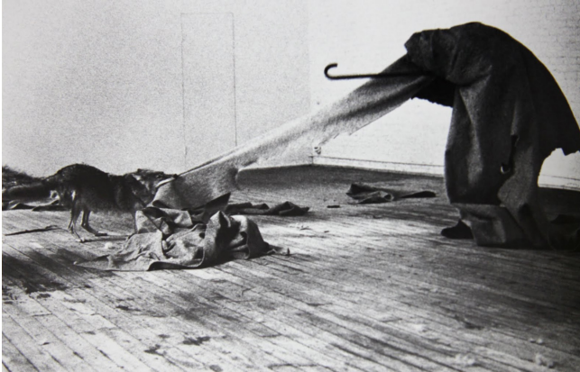
Görsel 10. Joseph Beuys, Amerika'yı Seviyorum, Amerika da Beni, 1974, Performans

Çakal (Coyote), tüm Kuzey Amerika mitolojilerinde görünen önemli bir figürdür. "...Gerçekten de, öbür Kuzey Amerika mitolojilerinde Coyote hileci, dalavereci, gözbağcı ve tam bir alçak görünümü altında belirir (Elaide, 2001: 19)." Bu anlamda, Beuys için Amerika'yı simgelemektedir.