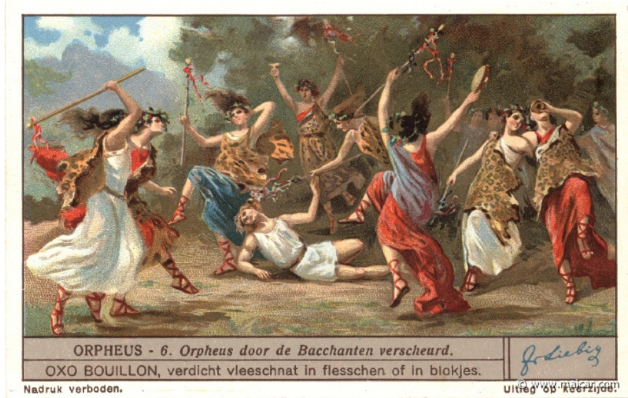
Görsel 2. Mainadlar

Dionysos adına yapılan tüm bu şenlik ve oyunlardan Yunanlıların dramatik edebiyatı ve tragedya doğar. Dionysos ise Tiyatro Tanrısı olur. Dionisien