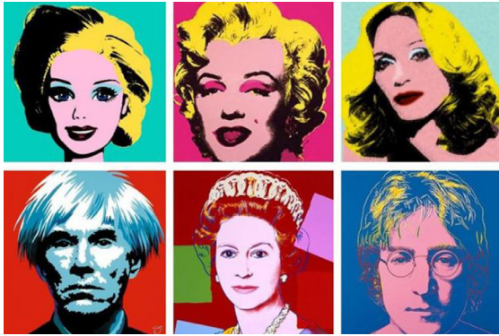
Görsel 9. Andy Warhol, Farklı İkonlar, Tuval Üzerine Serigrafî