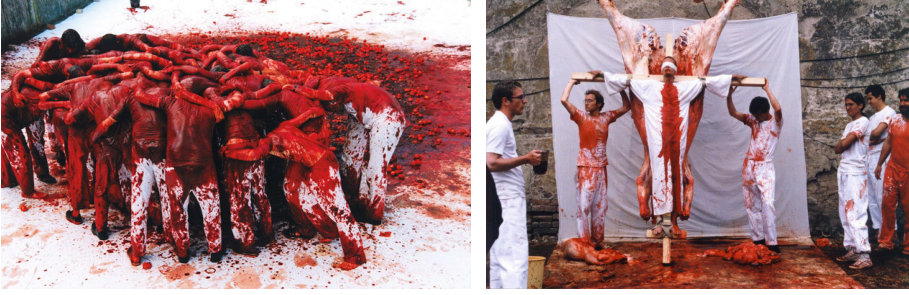
Görsel 3, 4. Herman Nitsch, Farklı Performanslardan Kareler

Feminist Sanat'ın da Dionysos ve mainad'ları yaşattığı iddia edilebilir. Feminist Sanat, sanatın cinsiyetini yeniden belirlemek ve sanat dünyasındaki erkek egemenliğiyle rekabete girebilmek amacıyla 1960'larda kadın sanatçıların giriştikleri harekettir. En belirgin özelliği, erkek egemen tüm konu, yöntem ve malzemeleri reddetmesi; sanatta tümüyle yeni ve kadınca bir yapılandırmaya gitmesidir. Böylelikle kadınca malzeme ve elişi sanata dâhil olur. Daha da önemlisi, özel hayat, gündelik hayat gibi konular devreye girer. Bunlar sadece kadın sanatı için değil, Sanat Tarihi için önemli yeniliklerdir. Feminist Sanat için bu yenilik fikri önceliklidir. Yeni; farklı, değişik, yapılmamış olandır. Bu da, fotoğraf ve video gibi, teknolojinin en yeni malzeme ve yöntemlerini getirir.