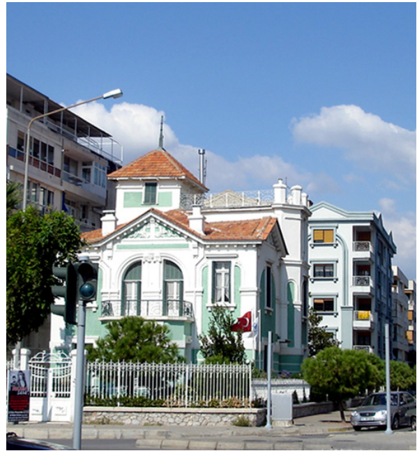
Şekil 5a ve 5b: Geçmişte kıyıya daha yakın konumda yer alan ancak dolgularla kıyıdan uzaklaşmış Karşıyaka köşkerlerinin günümüze ulaşabilen örnekleri. Bugün anaokulu olarak kullanılan Penetti Köşkü (solda) ve kültürel etkinlikler için kullanılan, Yaşar Eğitim Vakfı'na ait bir başka yapı (Eski Aliotti Evi, sağda)

Figure 5a ve 5b: Examples of houses previously located nearer to sea in Karşıyaka. The Penetti House on the left serves as a kindergarten today. On the right is another house which serves for cultural activities, owned by Yaşar Educational Foundation (previously owned by Italian Aliotti Family).