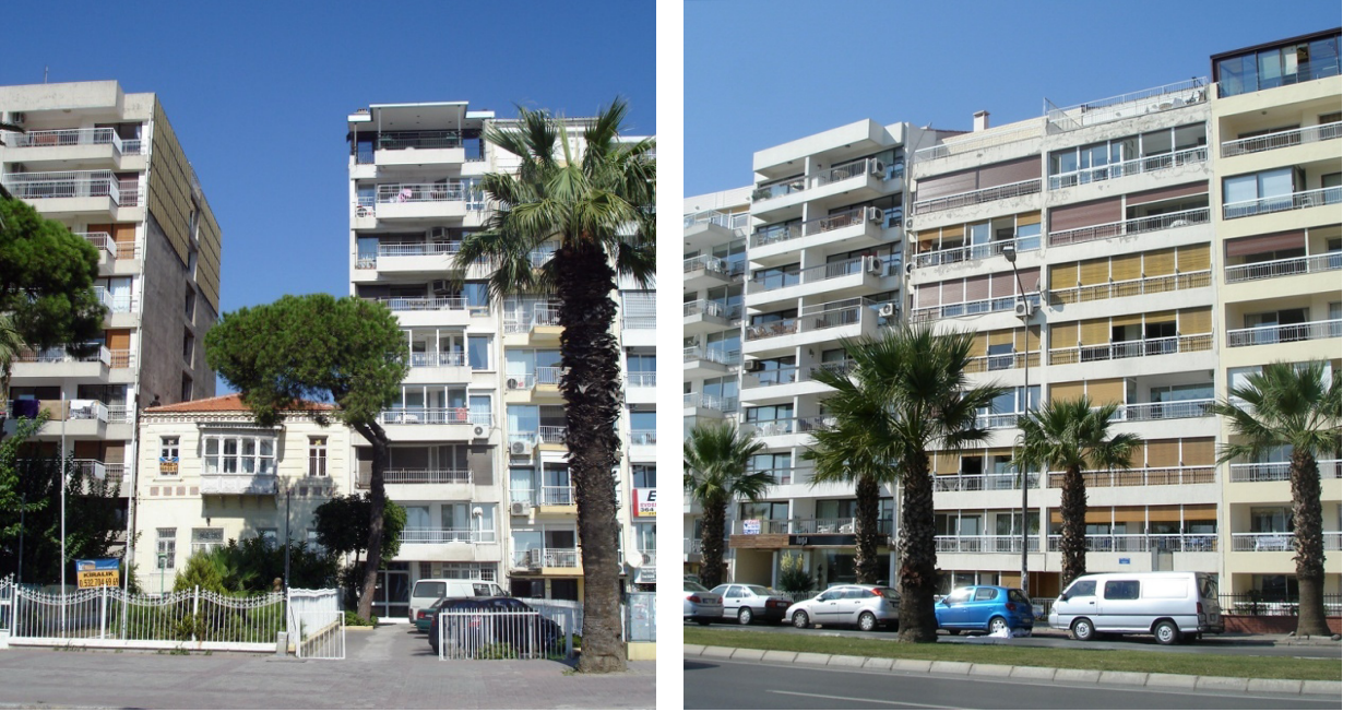
Şekil 7a ve 7b: Günümüzde Karşıyaka kıyısı

Figure 6a and 6b: Karşıyaka Coast in Late Ottoman Period the current situation the same part of the coast