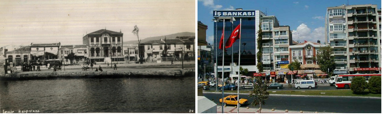
Şekil 6a ve 6b. Geç Osmanlı Dönemi'nde Karşıyaka kıyısı ve aynı kesimin günümüzdeki durumu. Soldaki fotoğrafın merkezinde yer alan günümüze ulaşan tek yapı olan büyük bina, halen Öğretmenevi Lokali olarak kullanılmaktadır.

Figure 6a and 6b: Karşıyaka Coast in Late Ottoman Period the current situation the same part of the coast