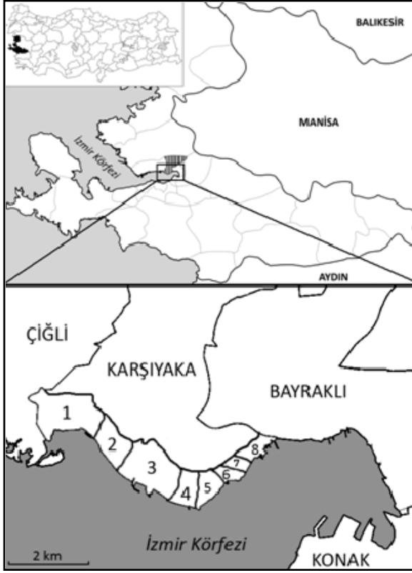
Şekil 1: Araştırma alanının konumu ve Karşıyaka'nın kıyı mahalleleri: (1) Mavişehir (2)Atakent (3)Bostanlı (4)Aksoy (5)Donanmacı (6)Tuna (7)Alaybey (8)Tersane

Figure 1: Location Map of the Research Area and the Coastal Districts of Karşıyaka: (1) Mavişehir (2)Atakent (3)Bostanlı (4)Aksoy (5)Donanmacı (6)Tuna (7)Alaybey (8)Tersane