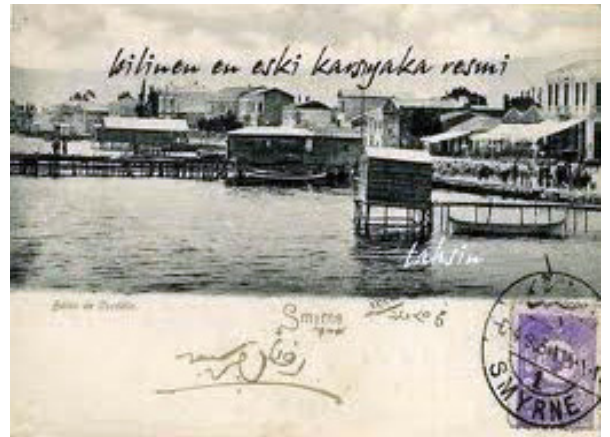
Şekil 2: Geç Osmanlı Dönemi'nde Karşıyaka Kıyısında Deniz Banyoları.

Dönemin deniz banyoları (Şekil 2 ve Şekil 3), kapalı ve açık hacmi bulunan, dairesel bir geometriye sahip yapılarıdır. Kapalı bölümünde, erkek ve kadın giyinme-soyunma bölümleri yer alırken, açık kısımlarında da denize girmenin yanı sıra köşkün fertleri ve komşuların toplanarak sohbet edip birlikte vakit geçirdikleri bir mekân bulunmaktaydı. Karşıyaka'da yaşayan Batılı topluluklar sosyal aktivitelerini genellikle bu mekânlarda gerçekleştirmişlerdir. Kıyı boyunca yer alan bu deniz banyoları, özel kullanımı olan ancak kıyı şeridinde bulunmaları nedeniyle kamusal alandan ulaşılan özellikteki mekânlar olarak yer almıştır.