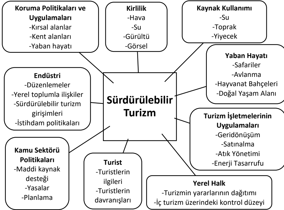
Şekil 2: Sürdürülebilir Turizmin Kapsamı

Şekil 1’de görüldüğü gibi sürdürülebilir turizm ekonomik, toplumsal ve ekolojik boyutları içerir. Sürdürülebilir turizm, turizm sisteminin pek çok unsurunu içine alan geniş kapsamlı bir alandır (Swarbrooke, 1999:15).