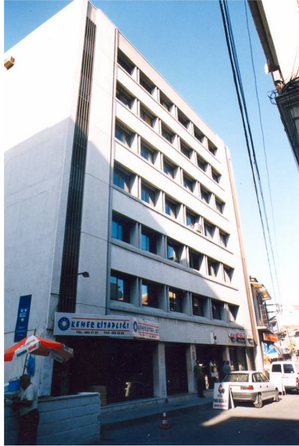
Foto 2: Sit alanı içindeki aykırı bir yeni yapı Photo 2: A discordant new building sample in conservation area

sağlanmasının gerekli olduğu düşünülmüştür. Ancak koruma planının gerektirdiği detaylı analizlerin kısa bir sürede tamamlanamayacağını biliniyor olması nedeniyle, daha plan sırasında küçük uygulamalarla esnaf ve kullanıcıların plan doğrultusunda yapılacak uygulamaların olumlu getirilerini görmeleri sağlayacak alt projeler hazırlanmıştır. Hemen uygulanabilecek ölçekteki bu projelerle, koruma amaçlı düzenlemelerin aynı zamanda mülk sahiplerini olumlu etkileyebileceği de gösterilerek plan sürecine inancın artırılmasına çalışılmıştır (Foto 3).