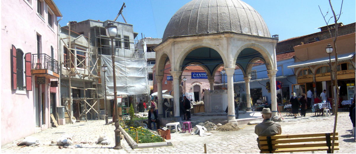
Foto 3: Alipaşa Şadırvanı ve Meydanında yapılan kentsel tasarım projesinin uygulaması Photo 3: Application of Alipasha Fountain and Square urban design project