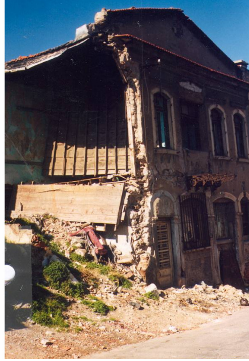
Foto 1: Kemeraltı’ndaki yok olma tehlikesindeki tarihi yapı örnekleri Photo 1: Ruinous historical building samples in Kemeraltı