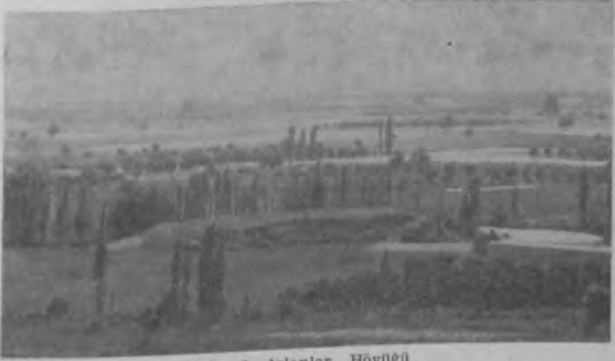
Res. 2 Aslanlar Höyüğü

K. Menderes havzasının yerleşim tarihi Geç Kalkolitik çağda başlamaktadır. En eski yerleşmeleri Torbalı ve Ödemiş ovalarında tesbit edilmiş olan höyükler teşkil etmektedir (6). Höyükler ova düzlüğünde ya ırmağa, ya da yan kollara yakın yerlere kurulmuştur. Uzunlukları 75 m ile 200 m arasında değişen bu ilk yerleşimlerin yükseklikleri de 5 m ile 10 m arasındaydı (res. 2). Yüzeyden toplanan seramik parçaları sayesinde her höyüğün ayrıntılı yerleşim kronolojisini ve yerleşim yoğunluğunu göreceli olarak saptamak mümkün olmaktadır. Bütün höyüklerin özellikle Erken Bronz Çağda, yani M.Ö. 3. binde yoğun şekilde yerleşim gördüğü, ayrıca M.Ö. 2. binde de yaygın bir yerleşimin var olduğu bulunan yüzey buluntuları sayesinde söylenebilmektedir.