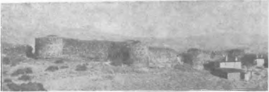
Res. 6 Kiraz-Asar Kaleci

Bizans Çağında daha önceki dönemde izlediğimiz büyüme ve gelişme oldukça azalmış olmalıdır. Sasani, Arap ve Türk tehditleri karşısında savunma gereksinimleri Hellenistik çağda olduğu gibi tekrar gündeme gelmiş ve Kaloe (Kiraz), Pyrgion (Birgi), Thyraion (Tire) gibi sağlam surlarla çevrili phourion (res. 6) denilen kale-şehir yerleşmeleri oluşmuştur (23).