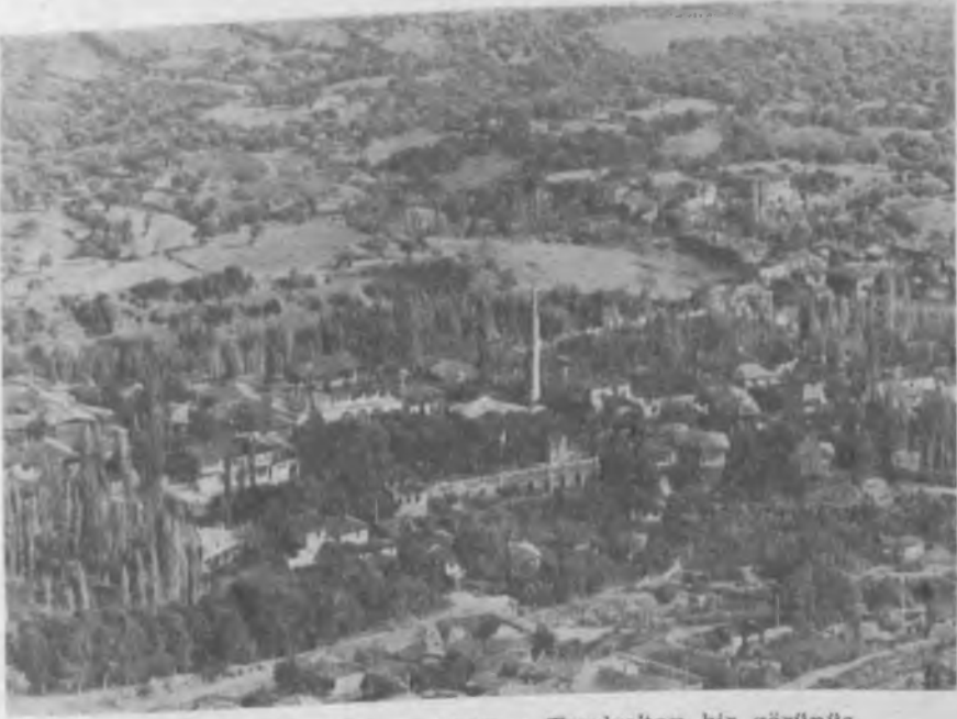
Res. 7 Birgiri modern yerleşim : Tmolos'tan bir görünüş