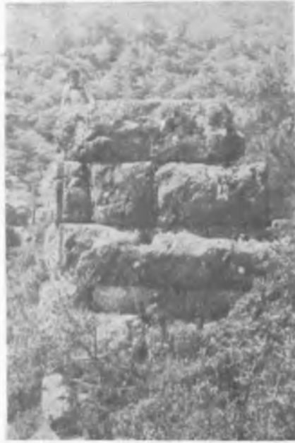
Res. 4 Ballicioluk Kalesi

Antik dönemde büyük bir öneme sahip Sardis-Ephesos yolu da K. Menderes ovasından geçmekteydi. Küçük kale altında bulduğumuz Hellenistik çağa ait bir mesafe taşı sayesinde her iki şehir arasındaki uzaklığın 500 stadion (yaklaşık 100 km) olduğunu saptamaktayız (17) (Res. 5).