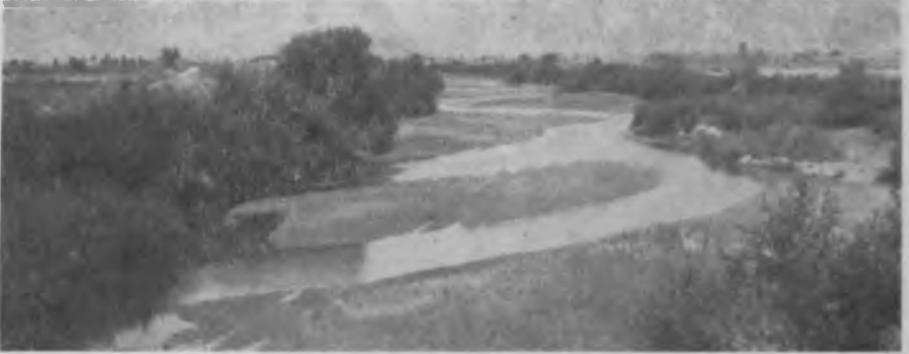
Res. 1 K. Menderes İrmağı

Büyük çoğunluğu itibariyle Lydia'da yer alan ve antik çağlarda adı Kaystros olan K. Menderes, ova içinde menderesler çizerek aktığından bu ismi almış olmaktadır(res.1). İrmağın ana kolu Kiraz çevresindeki Kadın deresidir. Bozdağ'dan inen diğer derelerle Kiraz önünde birleşen Kadın deresi K. Menderes ırmağının başlangıcını oluşturur. Antik kaynaklar ise Kaystros'un doğduğu yer olarak