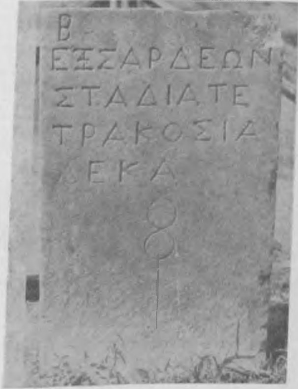
Res. 5 Sardis-Ephesos yolu mesafetaşı

antik yapı bilinmiyorsa da Aydınogulları dönemi anıtlarında devşirme malzeme olarak kullanılmış çok sayıda antik mimari blok, bunların Dioshieron şehri kalıntılarında alınıp kullanıldığını göstermektedir.