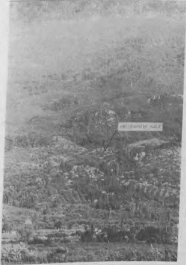
Res. 3 Küçükkale. Tıpkı bir yamaç yerleşimi

K. Menderes havzasında tesbit edilen elliye yakın yerleşme yerinin büyük bir çoğunluğu yamaç ve eteklerde bulunurken (res. 3), az bir bölümü ise —Bukolion, Khondria gibi— ova yerleşmeleri halindeydi. Dağ yerleşmeleri olarak da Messogis (Aydındağı) üzerindeki Pentakoma (Mendegüme) ve Uzgur antik yerleşimleri sayılabilir.