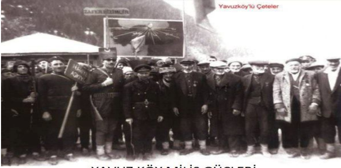
YAVUZ KÖY MİLİS GÜÇLERİ