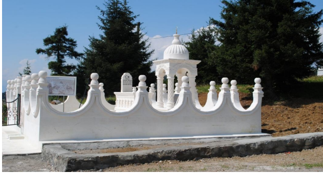
Çiçek Nene'nin Yavuzköy'deki Kabri