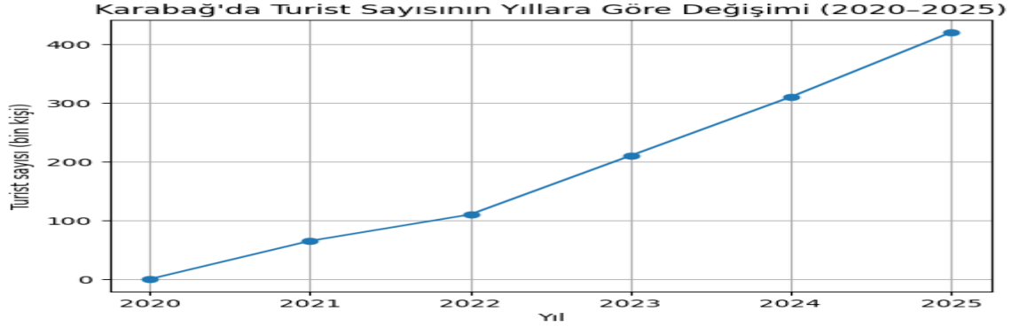
Şekil 1: Karabağ Bölgesinde Turist Sayısının Yıllara Göre Değişimi (2020–2025)