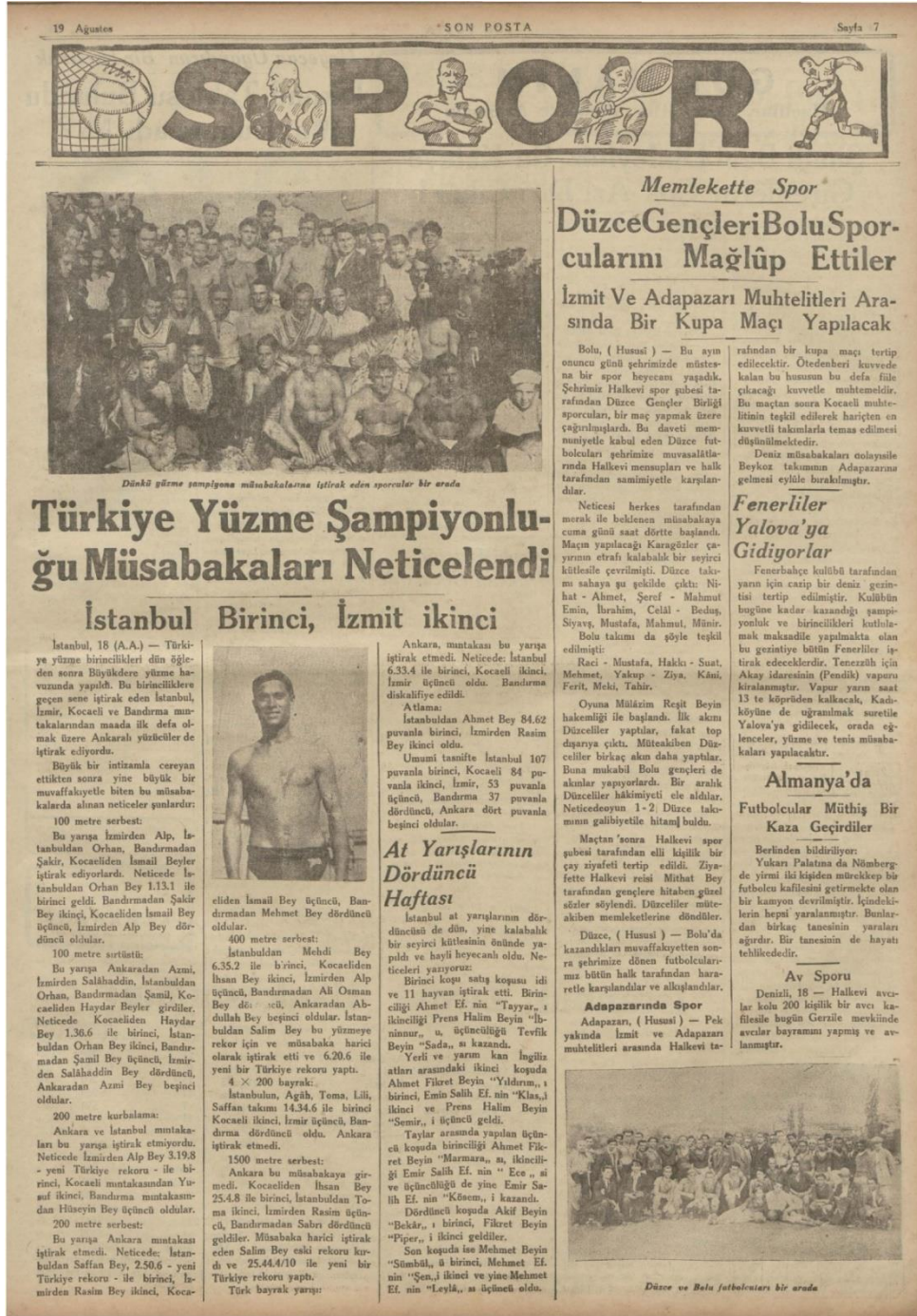
1933 Yılı Yüzme Şampiyonluğunda Kocaeli Sporcularının Dereceleri