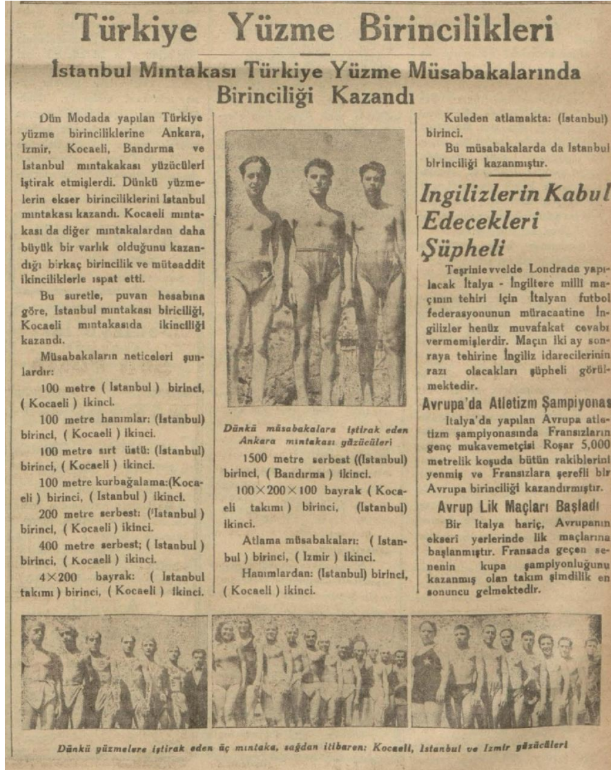
1934 Yılı Yüzme Şampiyonluğunda Kocaeli Sporcularının Dereceleri Kaynak: Son Posta, 15 Eylül 1934, s. 7.