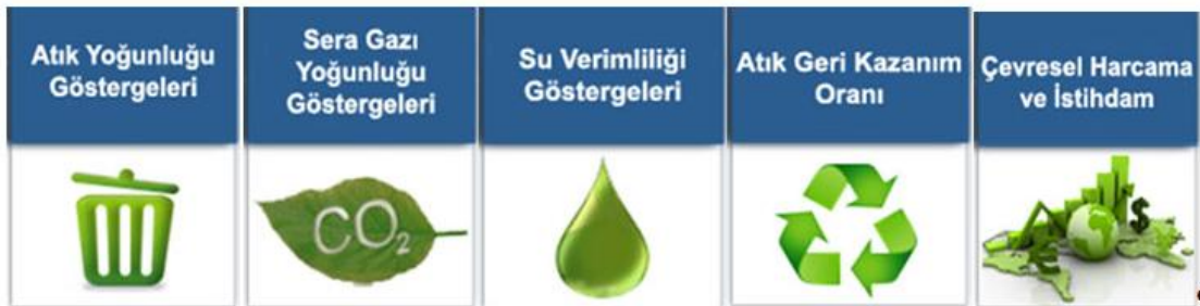
Şekil 1. İmalat Sanayi Sürdürülebilir Üretim (Sürdürülebilir Üretim Göstergeleri, 2017) [16]

8. Çevresel istihdam oranı: "Çevresel istihdamın" (çevresel faaliyetlerde tam zamanlı eşdeğer birimlerde ücretli çalışan sayısı) (tze), "toplam istihdama" (tüm tam zamanlı eşdeğer birimlerde ücretli çalışan sayısı) (tze) oranı (%).