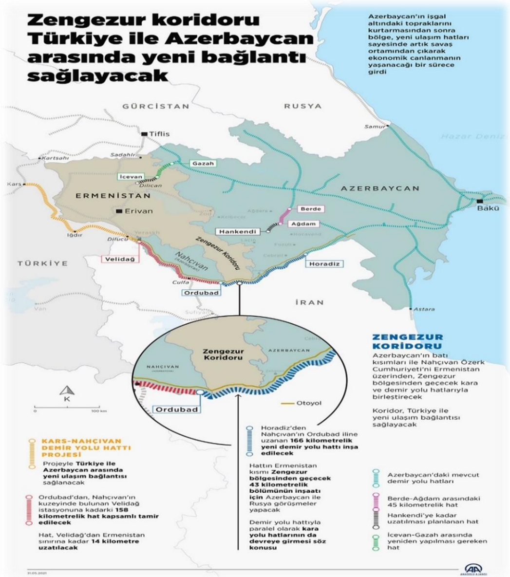
Harita 1: Planlanan Zengezur Koridoru (Trump Koridoru)