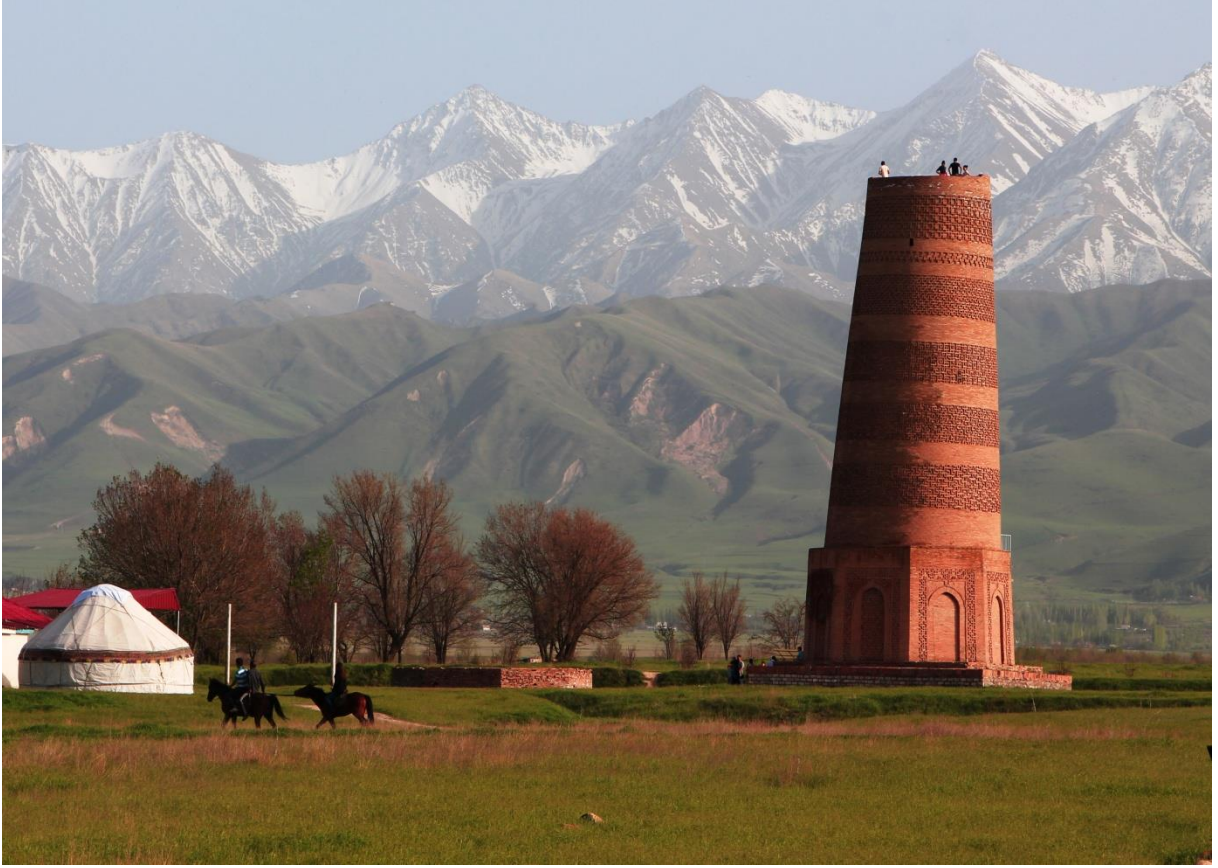
Balasagun şhrinden günümüze kalanlar