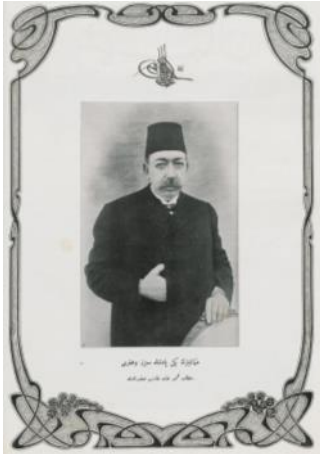
Resim 1. Yeni Padişah Mehmed Reşat [ Şehbal 28 Nisan 1909 (15 Nisan 325), s. 64.]