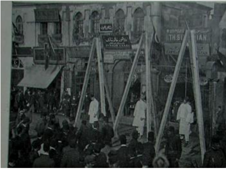
Resim 11. Divan-ı harb-i örfi tarafından mahkum edilen canilerden üçünün köprü başında alenen idamları [ Resimli Kitap , 21 Mayıs 1909 (8 Mayıs 1325), no. 8, s. 762.]