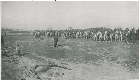
Resim 5. Ayastefanos'ta Hareket Ordusu [ Şehbal 28 Nisan 1909 (15 Nisan 325), s. 70.]