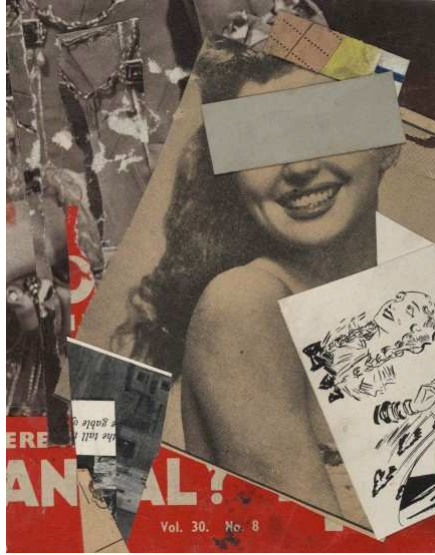
Resim 4: Kurt Schwitters, Karnaval, 1921

Pop-Art akımının bir akımın ressamlarından sayılabilen sanatçının, soyut dışavurumculuk ile pop sanatı arasında bir köprü görevi sağladığı söylenebilir. Kendisinden sonra gelen sanatçıları, geliştirdiği pek çok yöntem ve teknik ile etkilediğini söyleyebiliriz. Rauschenberg'in Dada akımının önemli sanatçılarından olan Kurt Schwitters'dan etkilendiği söylenebilir. Kolaj tekniğini kullanan Kurt Schwitters ise; yaramayan hurda eşyanın, gelişi güzel bir araya gelen döküntünün, çer çöpün Schwitters'in üzerinde büyüleyici bir etkisi olmuştur. Kolaj yaparken kullandığı öğeler; atılmış otobüs biletleri, paçavralar, gazete ilanları, düğme, tahta, tel örgü ve yosun parçalarıdır. Schwitters, "Karnaval" isimli çalışmasında kadın portresinden faydalanarak popüler kültür imgelerine dikkat çekmek istemiştir.