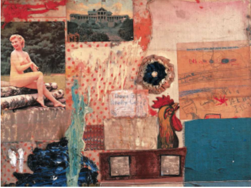
Resim 3: Robert Rauschenberg, “İsimsiz”, Kolaj, 39.3X52.7 cm, 1955

“İsimsiz” adlı tuval üzerine karışık teknik uyguladığı fotoğraf-kolaj çalışmasında; tuvalin üzerine gerçek nesnelere, kağıtlar, baskı resimler ve fotoğraflar yapıştırılmıştır. Resimsel olarak desenini çizdiği horoz kafası, popüler kültüre gönderme yapmak amacıyla Hamilton’un kolajında kullandığı gibi kadın bedeni imgesi ve bedenin dikkat çekiciliği üzerinde durmuştur. Bu iki eser karşılaştırmalı olarak ele alındığında tüketim toplumunun “Kadın Bedeni ve Beden” imgesi üzerine yüklediği anlamlar karşımıza farklı açılardan çıkmaktadır. Nesne olarak ele alınan bir olgu haline gelen “beden” popüler kültürün çarpıcı nesnesi haline dönüşmüştür.