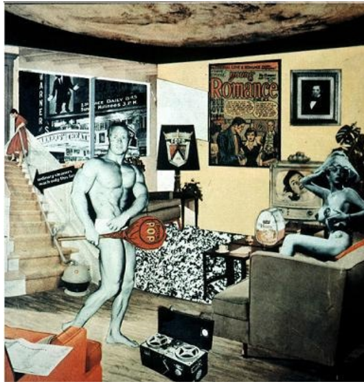
Resim 5: Richard Hamilton, Bugünün Evlerini, Bu Denli Çekici Kılan Nedir, 1956, Kâğıt Üzerine Kolaj, 26,5x25 cm.