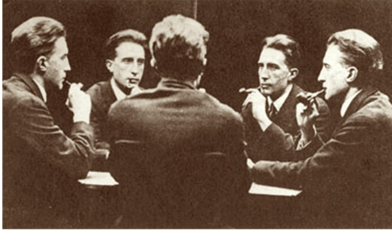
Resim 2. Marcel Duchamp, Bir Masa Etrafında, Photograph, 1917

Fransız sanatçı Marcel Duchamp yaratıcı eylemin, içsel (sinestetik) nitelikleri çözüp yorumlayarak dış dünyaya aktarılması yönündeki tanımı aynı zamanda sanatçının sorgulamacı kimliğinin de sanatsal yaratıcılık sürecine dahil edilmesi gerektiğini savlamaktadır. Duchamp bu düşüncesiyle, sineztesinin anestezi (Cox, 2014:96) ile yan yana kullanılmasını tavsiye eder durumdadır.