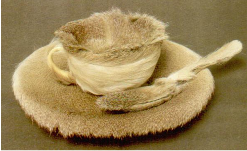
Resim 4. Meret Oppenheim, Kürk Kaplı Kahvaltı, 1936

Sanatçı Oppenheim'in "Kürk kaplı kahvaltı" (Resim 4) çalışması, duyuusal hazzın çeşitliliğine yani estetik sanatsal sinezteziye referans yapar; kürk dokunsal hazzı tatmin ederken, izleyiciyi de kürkle kaplı kapta bir içeceği, sosyalleşmiş insanın duyularını farklı psikolojik modlarını sistematize ederek (Erinç, 2011:51) düşündürüp neler hissedebileceğini hayal etmeye ve duyuların karışımı üzerindeki anti-estetik hissi sorgulamaya sevk eder.