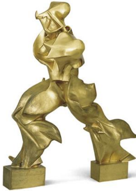
Resim 1. Umberto Boccioni, Uzayda Özgün Süreklilik Formları, Bronz, 1913

İtalyan fütürist heykeltıraş Umberto Boccioni, hız ve gücü, eşzamanlılık için bir arayışta (Boccioni,) sinestezik olarak hatırlananları ve görülenleri heykel formuna koyar. Figür (Resim 1) ileriye doğru ilerler, vücudun sınırlarını aşar, eğri ve akıcı çizgileri rüzgâra karşı savrulur durumdadır.