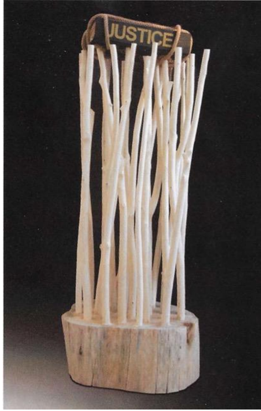
Resim 7. Önder Yağmur, Justice, 2006