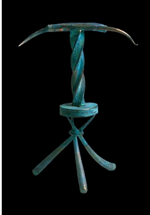
Resim 5. Carol Steen, Cyto, 1995

Bazı insanlar için, sinestezi, dünyayı algılayış biçimlerinin güçlü bir parçasıyken, bazıları için ise hayata yön veren duygulanım halidir. Sanatçı Carol Steen sinestezik halini sanatsal üretiminin merkezine koyan hatta sanatının kaynağı olarak sinestezisini görmektedir. Sanatçının Cyto (Resim 5) isimli çalışması kompozisyon, renk ve formlarının sinestezik görüntüsünün senteziyle ortaya çıkmıştır. Gördüğü birçok şekilden sade bir form oluşturmaya uygun olanlarını seçerek çalışmasını tamamladığını belirten (Carol, 2001:206) sanatçının eseri bir müzik eşliğinde dans eden formların birlikteliğini hissettirmektedir.