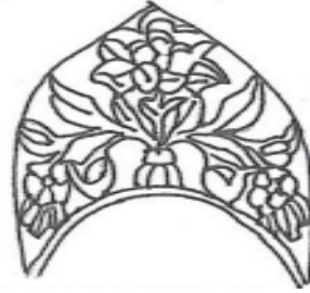
No.1, çizim 1, Vacide, baştaşı, 1916 Büyük Mezarlık

Tarih: H.1335/M.1916, Yeni Türk alfabesinin kabulünden sonra tekrar elden geçtiğinden dolayı ikinci tarihlendirme 1929 ile 1935 arası olabilir.