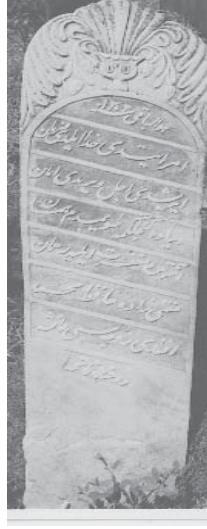
Fotoğraf 4. Müftüzade Hafız Muhammed Efendi zevcesi Aişe, 1885, Büyük Mezarlık