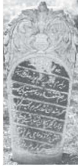
Fotoğraf 5. Müftüzade Hacı Ali Efendi zevcesi Gülsüm, 1793, Büyük Mezarlık