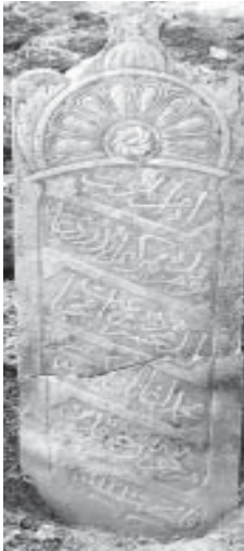
Fotoğraf 18, Muham- med Ağa kerimesi Rahime, 1795, Büyük Mezarlık