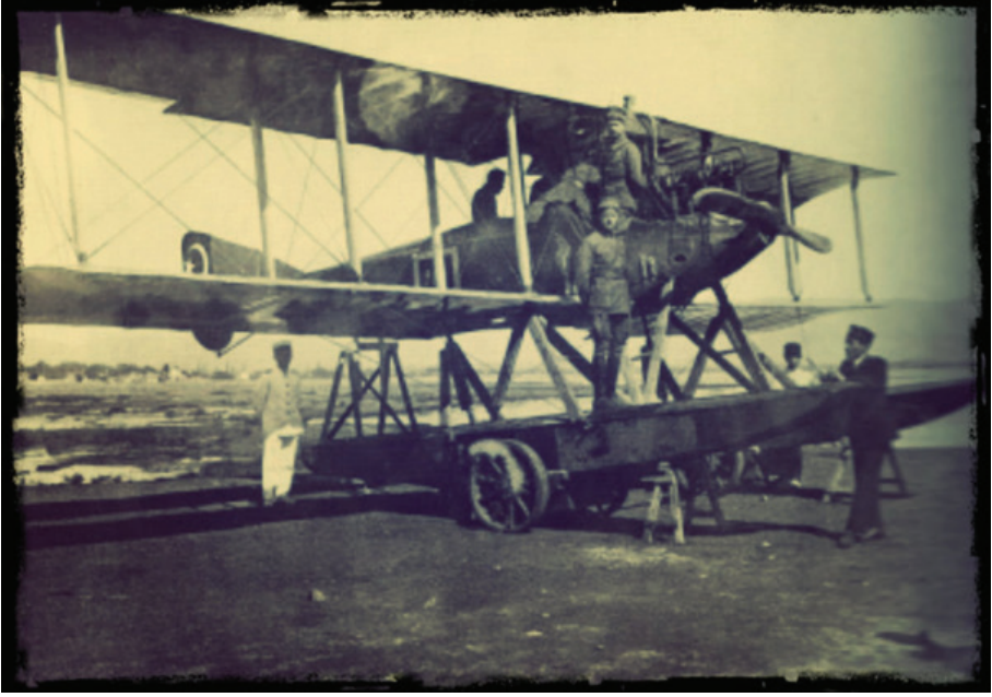
TÜRK DENİZ UÇAĞI