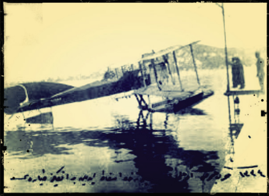
İNGLİZLERE AİT BİR DENİZ UÇAĞI