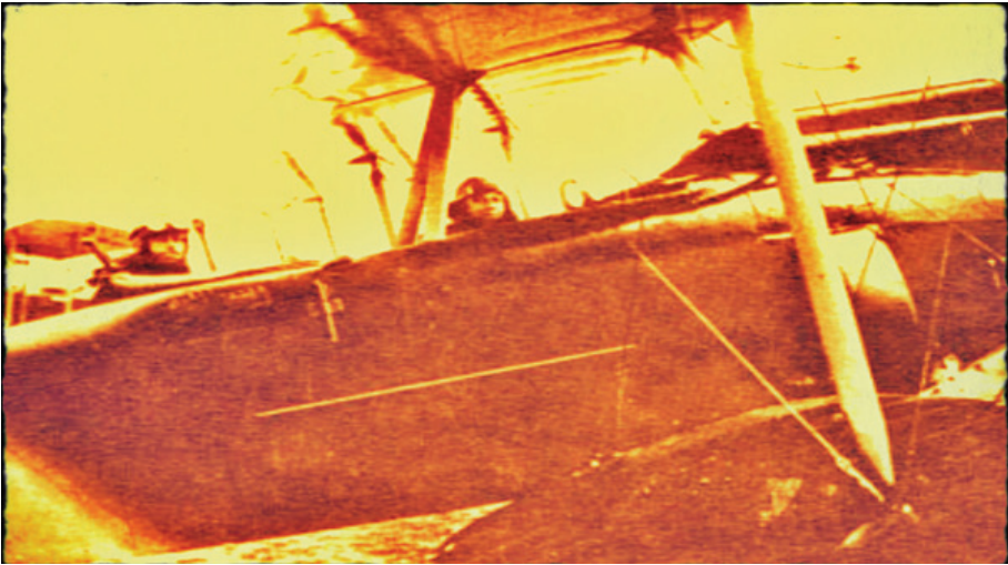
ALMAN GOTHA WD 2 DENİZ UÇAĞI