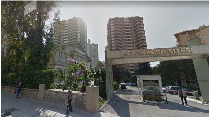
Şekil 12. Göztepe,2017

1950'lerden sonra, ülke yöneticilerinden Menderes, modern kent imgesinin temel bileşenlerinden motorlu taşıtlar için geniş bulvarlar açmış ve kent içerisinde meydanlar oluşturmuştur. İstanbul'da tüm bu operasyonlar yapılırken, sanayileşme ile gelen göç, artan nüfus ve buna bağlı oluşan konut sorunları hesaba katılmamıştır. Bu dönemde devlet, oluşan barınma problemlerini toplumsal bir sorun olarak ele almamış, bunun sonucunda bireyler kendi çözümlerini üretmişler ve gecekondulaşma artmıştır. 1960 yılına gelindiğinde kent nüfusu 1950 öncesi nüfusun neredeyse 3 katı kadardır. Anadolu'nun kırsal kesimlerinden kente göçenler, eski İstanbul'un(suriçi) semtlerine yerleşmiş, mevcutta burada ikamet eden nüfus ise yoğunluğun az olduğu sayfiye alanlarına ve kent çeperlerine taşınmıştır.