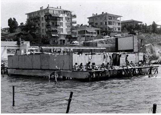
Şekil 6. Suadiye Gazinosu, 1931

Sayfiyeler, tüm aile üyeleri ile birlikte, dinlenme amaçlı gidilen yerler olsalar da, aile reisi her gün veya haftanın belirli günlerinde işe gidip gelirdi. Sayfiyede evi olmayan aileler ise belirli süreler için konut kiralar veya sayfiye otellerinde kalırlardı.