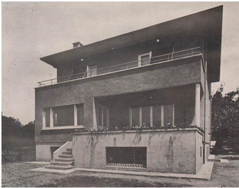
Şekil 10. Florya Atatürk Köşkü, 1935

Cumhuriyet'in ilanından önce Birinci Dünya Savaşı ile başlayıp İkinci Dünya Savaşı sonrasına dek devam eden dönemde, İstanbul neredeyse hiç müdahale görmemiş ve gelişmemiştir. Kentin İngilizler tarafından işgali, savaşlar ve Cumhuriyet'in ilanından sonra başkentin Ankara'ya taşınması kentin bu süreçte değişmemesinin nedenleridir. Tüm olumsuzluklara rağmen, İstanbul, konumu itibarı ile uluslararası ticarete bir liman olarak kullanılmış, mevcut endüstri birikimi kentin bütünüyle çökmesini engellemiştir. Bu süreçte gayrimüslim nüfus göç etmiş, böylece kentin kozmopolit yapısı ortadan kalkmış ve kent nüfusu neredeyse yarı yarıya azalmıştır.(Kuban, 2012, s. 501)