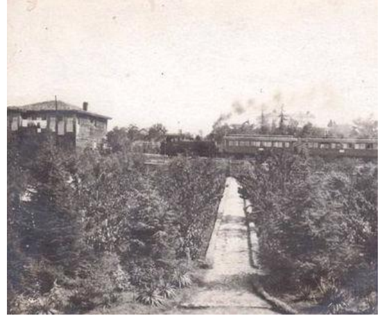
Şekil 4. Fenerbahçe Tren İstasyonu, 1870'ler