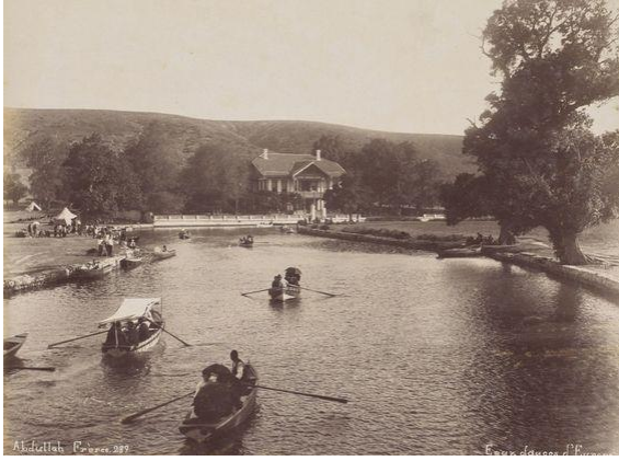
Şekil 1. Kağıthane Deresi,1880

Osmanlı'da sayfiye kültürü esasen, Lale Devri olarak anılan batılılaşma döneminde başlamıştır. İstanbul'a(suriçi) olan yakınlığı sebebiyle, Kağıthane ve Haliç bölgelerinde saray çevresindeki kişilere ait yazlık konutlar yapılmıştır. Ayrıca Kağıthane ve Haliç bölgesi, sayfiye kültürünün halk arasında yayılmasından önce, halk tarafından mesire alanı olarak da kullanılmıştır. (Yağın, Binan, 2016,s.175)