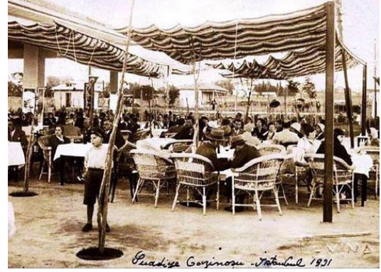
Şekil 7. Bostancı Sineması, 1970ler

Sayfiye alışkanlığının halk arasında iyice yaygınlaşmış olduğu 19. yüzyıl sonuna gelindiğinde, sayfiye yerleşimlerinde, konutların yanında deniz hamamları, plajlar, yazlık sinemalar, tiyatrolar, gazinolar, spor kulüpleri gibi rekreasyon amaçlı öğelerin de oluşmuş olduğu görülmektedir.