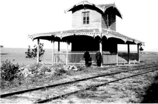
Şekil 3. Göztepe Erenköy arası banliyö treni, 1917

Şirket-i Hayriye'nin kurulmasından bir süre sonra yazlık ve kışlık konut kullanım alışkanlığı halk arasında iyice yaygınlaşmış, İstanbul(suriçi) ve Beyoğlu kışlık, Boğaziçi, Adalar, Kadıköy gibi semtler ise yazlık olarak kullanılmaya başlanmıştır. Beşiktaş, Ortaköy ve Kuruçeşme civarları padişahların ve ailelerinin, Bebek ve Rumelihisarı sadrazamlar ve Divan üyelerinin, Arnavutköy ve Kuzguncuk Hristiyan ve Yahudilerin, Yeniköy, Tarabya ve Büyükdere ise zengin Rumlar, Ermeniler ve Avrupalı diplomatların tercih ettikleri sayfiye yerleri olmuştur.(Kuban, 2012)