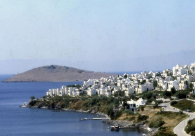
Şekil 12. Aktur Bodrum Turizm Yerleşmesi, 1976, EPA Mimarlık ve Şehircilik Atölyesi

Şirketler tarafından organize edilen yüksek yoğunluklu tatil sitelerinde otel, çarşı, disko, kamping gibi turistik hizmetler de yer almakta, bu da kıyılarda geniş alanlar kaplamaktadır. Bu tür projeler ilgili meslek gruplarının interaktif çalışması ile olumlu sonuçlar verebilmektedir. Ar-tur, Datça Ak-tur, Bodrum Ak-tur, Demir Tatil Siteleri bu konudaki başarılı örneklerdendir. (Kısa, 1998, s.45)