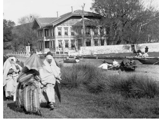
Şekil 2. Kağıthane Deresi

Ulaşım olanaklarının oldukça kısıtlı olduğu bu dönemde, sur dışı yerleşimler İstanbul'a(suriçi) yakın yerlerde bulunuyor, suriçine uzak yerlerde konutu olanların ulaşımı ise oldukça güç şartlarda sağlanıyordu.