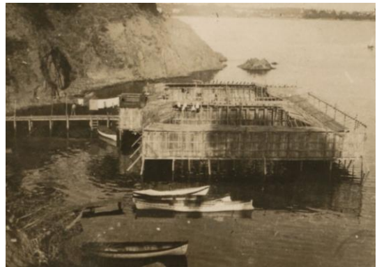
Şekil 9. Salacak deniz hamamı