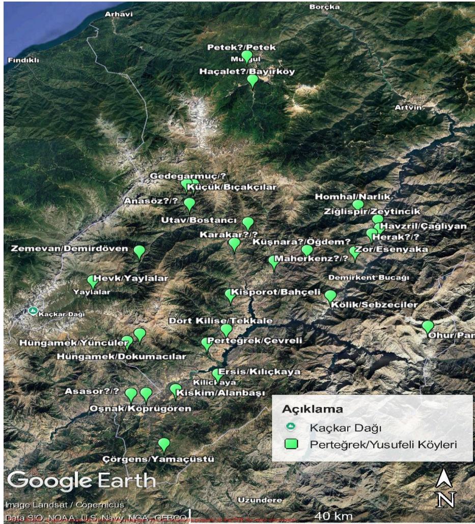
Şekil 1: Perteğrek (Yusufeli) kazasına bağlı köylerin dağılımı ve vakıf kurumlarının mekânsal yerleşimi

Kaynak: Bu harita mevcut bilgiler doğrultusunda yazar tarafından oluşturulmuştur.