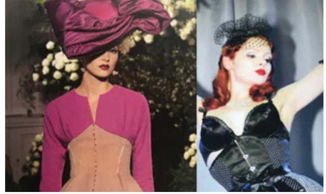
Resim 15: (soldan sağa) Christian Dior 2009/ Velda Lauder collection 2005/ “gothika” collection 2010

couture şovlarında gözükmüşlerdir. Fakat bu elbiseler giyilebilir elbiseler olarak tasarlanmamıştır.