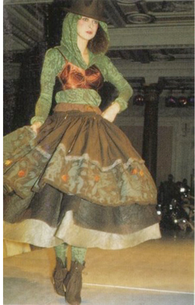
Resim 10. V. Westwood'un 1982 yılında oluşturduğu "Buffalo Girls" koleksiyonundaki kahverengi korse sütyen (Görsel kaynak: Valeria Steele The Corset A Cultural History )

Britanyalı tasarımcı "Vivienne Westwood" da 1982 yılında çıkardığı "Buffalo Girls" koleksiyonuyla "dış giyim olarak iç giyim" kavramını gözler önüne sermiştir. Koleksiyonunda kahverengi satenden yapılmış bir korse sütyen bulunmaktadır. Bu tasarım, dış giyim olarak kullanılan iç giyimi punk/fetiş piyasasının ötesine taşımıştır. Bu tasarım ile sütyenler alışıldak işlevinden çıkarak kuralları çiğnemiş ve dış giyimün üzerine giyilen iç giyim konumuna ulaşmıştır (Fogg, 2014, s. 460).