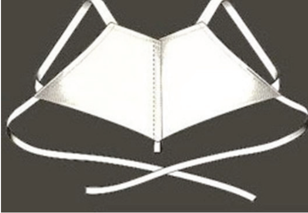
Resim 9. Mary Phelps Jacob tarafından tasarlanan ilk sütyen tasarımı (1913)

Modern sütyenler, ilk kez Amerikalı Mary Phelps Jacob (1891-1970) tarafından Cresse Crosby takma adıyla 1913'te tasarlanmıştır. Belli bir sosyal statünün, iffetli olmanın göstergesi olarak giyilen ve o zamanlar göğüsleri destekleyen tek araç olan korselerin aksine sütyenler, modernliği ifade etmiştir. Kadınların gövdelerini kısıtlanmaktan kurtarmış ve özgürleştirmiştir (Fogg, 2014, s. 460).