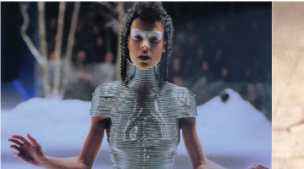
Resim 14: Soldan sağa Alexander McQueen’in 1999 ilkbahar/ yaz koleksiyonunda sunduğu Gerilla Korsesi / Alexander McQueen/ gümüş sarmal korse 2000 (Görsel kaynak: Lauder, V. A Modern Guide )

Aleksander McQueen’in 90’lı yıllardan 2010 yılındaki ölümüne kadar geçen süreçte yarattığı giysiler, sanatsal anlatım dili ve tematik yaklaşımı sebebiyle özgün ve öncü olarak kabul edilmektedir. (Sabanuç Gönül ve Bağrıışen, 2016, s. 101). 2000 yılında “The Overlok” koleksiyonunda sergilediği gümüş sarmal korse tasarımı ile farklı malzeme arayışına da vurgu yapmıştır. Böylece farklı bir bakış açısıyla, tasarımlarında ilginç malzemeler kullanarak farklı çözümlere ulaşmayı başarmıştır.