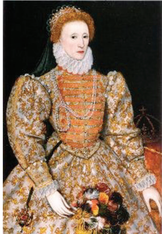
Resim 4. I.Elizabeth Portresi

Korse kelimesinin ilk kez 16. yy. da İngiltere'de kullanıldığı bilinmektedir. 16. yy. kadınları I. Elizabeth portresindeki görüntüyü yakalamak amacıyla korse kullanmayı yaygın hale getirmişlerdir (Çalışkan, 2012, s. 36).