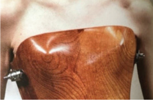
Resim 13. (soldan sağa) Hüseyin Çağlayan, Yanlış Ekvator Bodice boyunca, Sonbahar/ Kış 1995, Metropolitan Museum of Art, New York /1998 Hüseyin Çağlayan cerrahi korse tasarımı deri ve metal aksesuarlı