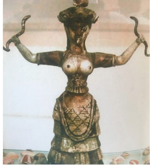
Resim 3. M.Ö. Girit Dönemi Yılanlı Tanrıça Figürü "Knossos Sarayı"

Knossos Sarayı'nda sergilenen "Yılanlı Tanrıça" heykelinde de yine korse kullanıldığı görülmektedir. Heykelde, bir tanrıça veya yılanlı rahibe iki eliyile iki yılanı tutmaktadır (Dönmez, 2017, s. 414).