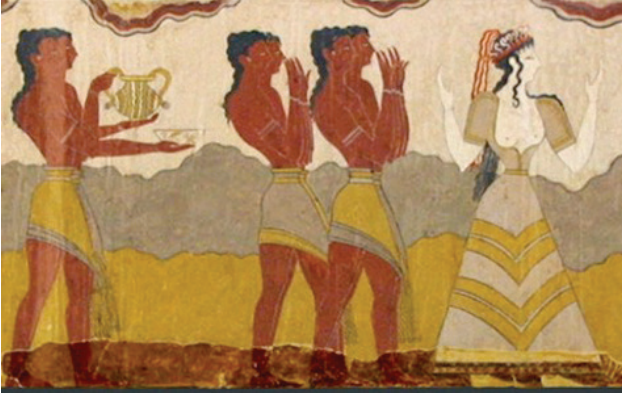
Resim 2. Knossos Sarayı Freskosu M.Ö. 2800 – 800

Korsenin ilk kullanım örneklerinin tarih öncesi çağlara temellendiği bilinmektedir. Eski Yunan uygarlığında kadınlar destek takarak göğüslerini yukarıya kaldırmışlardır. Daha sonra eski Romalılar devrinde ise modanın etkisi ile göğüslerini bol kıvrımlı, drapeli giysiler içine gizlemişler ve göğüslerini belirsiz hale sokmaya çalışmışlardır (Çileroğlu ve Gündüz, 1999, s. 69). M.Ö 2800-800 yıllarına ait duvar resimlerinde, Girit kadınlarının giydiği kıyafetler, korse biçimindeki kemerlerle kalçaların üzerine sıkıca oturtularak kullanılmıştır (Boucher, 1966, s. 82). Knossos Sarayı freskosuna ait aşağıdaki görselden hareketle; korsenin ilk kullanım örneklerinin sadece kadınlarda değil aynı zamanda erkeklerde de görüldüğünü söylemek mümkündür.