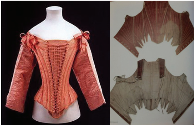
Resim 6. 16-17. yy. Fransız “stays” korse örnekleri

Fransız korselerine 17. yy. da “stay” veya “a pair of bodice” (çift üstlük) denirken zaman içinde korse adı ile yer değiştirmiştir. Bu dönemde kullanılan korselere “stays” denme sebebi; iki ayrı bölümden oluşarak iki ayrı yerden bağlanıyor olmalarıdır (Ertikin, 2017, s. 49).