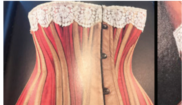
Resim 8. 19.yy. Fransız (1870-90) korse örneği (Görsel kaynak: Benaitt All A Century of French Lingerie (Farid Chenoune)

19. yy. da kadınların özgürlüğünü elinden alan korseler, feminist gruplar tarafından dışlanmış ve tepki görmüştür. Bu sesleniş sessiz kalamayan tasarımcı “Paul Poiret” korselerdeki balenleri, metalleri çıkararak bedeni incelten korseyi dış giyimde giysi olarak kullanmaya başlamıştır ( http://birgunbiryerde.blogspot.com ).