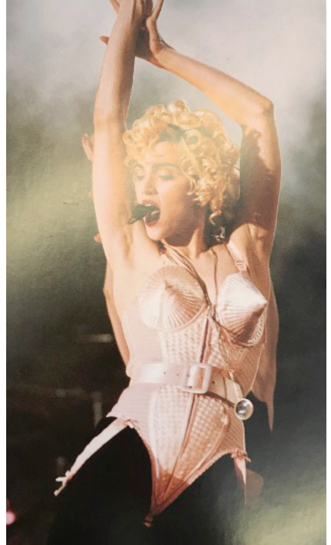
Resim 12. Jean Paul Gaultier'in Madonna'nın "Blond Ambition" turnesi için tasarladığı konik korse tasarımı 1990

Bu bağlamda Fransız tasarımcı Jean Paul Gaultier, Madonna'nın 1990 yılındaki "Blond Ambition" turnesi için bir dış giyim ürünü olarak tasarladığı konik göğüslü korseyi gözler önüne sermiştir.