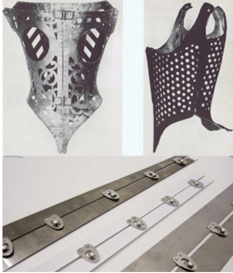
Resim 5. 16-17.yy " Busk" korse örneği ve modern busk çubuğu

Rönesans döneminde “busk” adı verilen korseler kullanılmıştır. Busk korseler, geometrik bir vücut yapısı vermeyi amaçlayan, ahşap, kemik veya metalden yapılmış, karın bölgesinde kullanılan çubuklu korselerdir ( http://corsetmaking.blogspot.com/2015/01/what-is-corset-busk.html ).