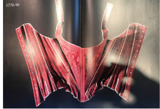
Resim 7. 18. yy. pamuk ve ipek karışımı kumaştan üretilmiş Büyük Britanya kökenli korse tasarımı

askılı ya da elastik malzemelerden yapılan destekler, hatları yumuşatırken; balenli ve silikonlu büstiyerler, göğüs bölgesini destekleyerek kullanılmaya başlanmıştır (Kolektif, 2013, s. 432).