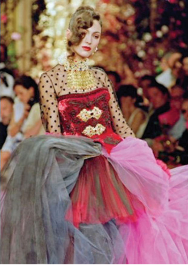
Resim 11. Lacroix'in Sonbahar/Kış 1987 yılındaki romantik tütülu, nakışlı korse tasarımı

Fransız Tasarımcı Christian Lacroix, 1987'deki ilk koleksiyonunda 18.yy. in tarihsel romantizminin bir versiyonunu sunmuştur.