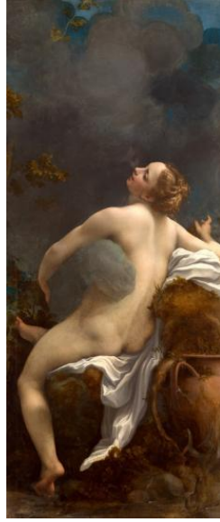
Şekil 5. Correggio, Jüpiter 3 ve İo, 1530, tuval üzerine yağlı boya, 162 x73,5 cm, Viyana Sanat Tarihi Müzesi, Avusturya (Correggio, 1530).

Kuzey Hollanda'da bu mitin en eski tasviri olarak bilinen Abraham Bloemaert'e ait 1592 tarihli Merkür, Argos ve İo isimli eserde (Şekil 6) Hermes, üç farklı şekilde tasvir edilmiştir (Boynudelik, 2017, s. 63). Resmin merkezinde kaval çalarak Argos'u uyutmaktadır. Ayaklarının hemen yanında atribülerinden biri olan burmalı asası ve kılıcı görülmektedir. Argos, başında yer alan yüz gözünden tanınmaktadır. Beyaz bir ineğe dönüştürülmüş İo ise uzaktan olanları izlemektedir. Resmin geri planında bir kaya üzerinde Hermes, Argos'un kesilmiş başını elinde tutmuş zaferle havaya kaldırırken resmedilmiştir. Gökyüzünde ise Hermes görevini tamamlamış ve uçarak uzaklaşırken görülmektedir.