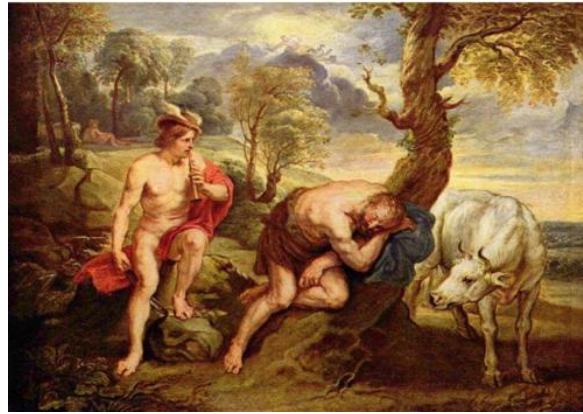
Şekil 8. Peter Paul Rubens, Hermes ve Argos, 1635, ahşap panel üzerine yağlı boya, 63 x 87,5 cm, Gemaldegalerie, Berlin (Rubens, 1635).

Peter Paul Rubens'in 1635 tarihli Hermes ve Argos isimli eserinde (Şekil 8) atribüsü olan kanatlı başlığın tanınan Hermes'in çaldığı kavalın sesiyle bir ağaca yaslanmış uyuyan Argos resmedilmiştir (Boynudelik, 2017, s. 57). Bu sırada Hermes elinde silahıyla Argos'u öldürmek için doğru zamanı beklemektedir. İo, resmin sağında ağacın altında olanları izlemektedir.