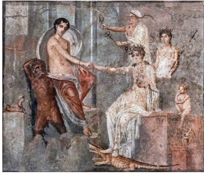
Şekil 4. İo, Nil ve İsis, M.Ö. 1. yy., Pompeii İsis Tapınağı'ndan fresk, Napoli Ulusal Arkeoloji Müzesi, İtalya (Anonim, M.Ö. 1. yy.).

M.Ö. 1. yy.a ait, Pompeii'de İsis Tapınağı'nda yer alan bir freskte (Şekil 4), İsis ve İo iki farklı kişi olarak gösterilmiştir (Kitat, 2025, s. 20). Zeus'un sevgilisi İo, Mısır'da Tanrıça İsis tarafından karşılanır. Yunan nehir tanrısı Neilos (Nil) tarafından omzunda taşınarak getirilmiştir ve beyaz bir elbise giymiş, elinde bir yılanı tutarken tasvir edilmiş İsis'i eliyle selamlamaktadır. İo'nun alnında yer alan boynuzlar dikkat çekmektedir. Bu resim, Yunan ve Mısır ikonografisinin iç içe geçtiğini ortaya koymaktadır.