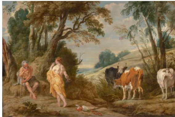
Şekil 9. Jacob Jordaens ve Jan Wildens, Merkür ve Argos, 1640, tuval üzerine yağlı boya, 121,3 x 184,8 cm, Norton Simon Müzesi, Pasadena, ABD (Jordaens ve Wildens, 1640).

Figürleri Jacob Jordaens'e, peyzajı ise Jan Wildens'e ait, Ovidius'un Dönüşümler eserinden esinlenerek yapılan 1640 tarihli Merkür ve Argos isimli eserde (Şekil 9) Zeus'un, kıskanç Hera'dan kurtulmak amacıyla sevgilisi İo'yu bir ineğe dönüştürmesi resmedilmiştir (Boynudelik, 2017, s. 53). Solda, Hermes'in Argos'u elindeki kavalı çalarak uyuttuktan sonra sinsice yaklaşma anı yer alırken