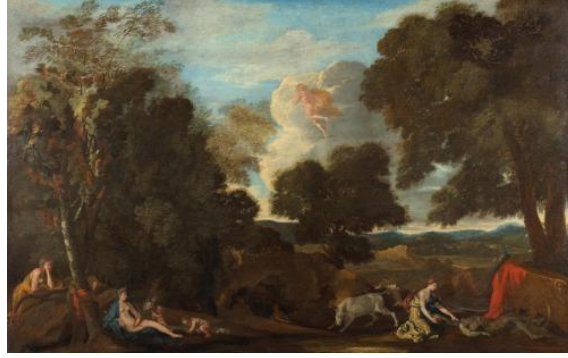
Şekil 7. Nicolas Poussin, Juno 4 ve Öldürülen Argos'lu Manzara, 1633, tuval üzerine yağlı boya, 122,5 x 198,5 cm, Gemaldegalerie, Berlin (Poussin, 1633).

Peter Paul Rubens'in 1635 tarihli Hermes ve Argos isimli eserinde (Şekil 8) atribüsü olan kanatlı başlığın tanınan Hermes'in çaldığı kavalın sesiyle bir ağaca yaslanmış uyuyan Argos resmedilmiştir (Boynudelik, 2017, s. 57). Bu sırada Hermes elinde silahıyla Argos'u öldürmek için doğru zamanı beklemektedir. İo, resmin sağında ağacın altında olanları izlemektedir.