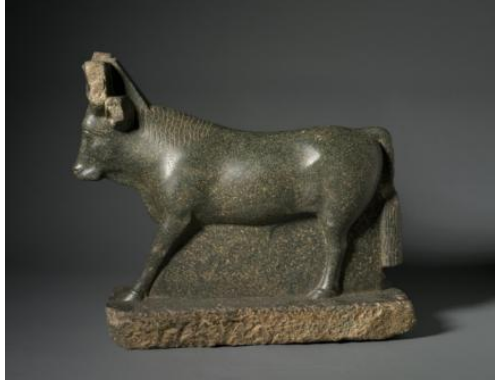
Şekil 12. Apis Boğası, M.Ö. 4. yy., serpentinit heykel, 53 x 19 x 59 cm, Cleveland Sanat Müzesi, ABD (Anonim, M.Ö. 4. yy.).

Antik Mısır'da Apis boğası ayrı bir kutsal varlık olarak saygı görmektedir. Yunan düşüncesinde İo'nun oğlu Epaphos'un Apis ile özdeş olduğu inancı ve Yunan yazarlarca Apis'in Mısır dilinde Epaphos'un karşılığı olduğunun düşünülmesi (Erhat, 2007, s. 158), Apis boğası tasvirlerinin (Şekil 12 ve 13) yaygınlaşmasını sağlamıştır. Mısır'ın kutsal boğa kültürünü temsil eden bu heykeller aynı zamanda İo'nun Mısır'daki soyunu simgelemektedir.