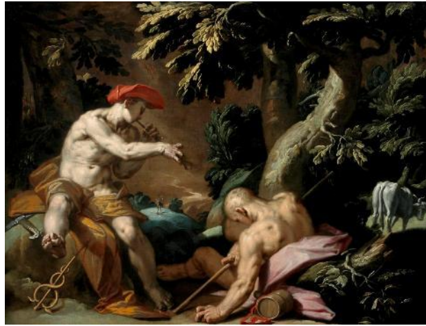
Şekil 6. Abraham Bloemaert, Merkür, Argos ve İo, 1592, tuval üzerine yağlı boya, 63,5 x 81,3 cm, Utrecht Merkez Müzesi, Hollanda (Bloemaert, 1592).

Kuzey Hollanda'da bu mitin en eski tasviri olarak bilinen Abraham Bloemaert'e ait 1592 tarihli Merkür, Argos ve İo isimli eserde (Şekil 6) Hermes, üç farklı şekilde tasvir edilmiştir (Boynudelik, 2017, s. 63). Resmin merkezinde kaval çalarak Argos'u uyutmaktadır. Ayaklarının hemen yanında atribülerinden biri olan burmalı asası ve kılıcı görülmektedir. Argos, başında yer alan yüz gözünden tanınmaktadır. Beyaz bir ineğe dönüştürülmüş İo ise uzaktan olanları izlemektedir. Resmin geri planında bir kaya üzerinde Hermes, Argos'un kesilmiş başını elinde tutmuş zaferle havaya kaldırırken resmedilmiştir. Gökyüzünde ise Hermes görevini tamamlamış ve uçarak uzaklaşırken görülmektedir.