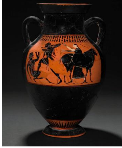
Şekil 1. Exekias Ressamı, Argos'u Öldüren Hermes, M.Ö. 540, Attik siyah figürlü amfora, 44,2 x 27,5 x 27,5 cm, British Museum, Londra (Exekias Ressamı, M.Ö. 540).

gösterilmiş Argos'a saldırmaktadır (Carpenter, 2002, s. 45). Bir inek olarak tasvir edilen İo sahneye arkasını dönerken Hera ise elleri havada yardıma gelirken tasvir edilmiştir.