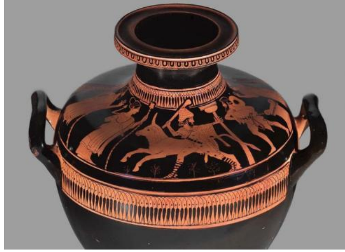
Şekil 3. Agrigento Ressamı, Hermes, İo ve Argos, M.Ö. 460, kırmızı figürlü hydra, 37 x 28 cm, Boston Güzel Sanatlar Müzesi, ABD (Agrigento Ressamı, M.Ö. 460).

erkek görülmektedir. Hermes'in arkasında yer alan dor başlıklı sütun, sahnenin Argos'ta yer alan Hera Tapınağı'nda gerçekleştiğini vurgulamaktadır.