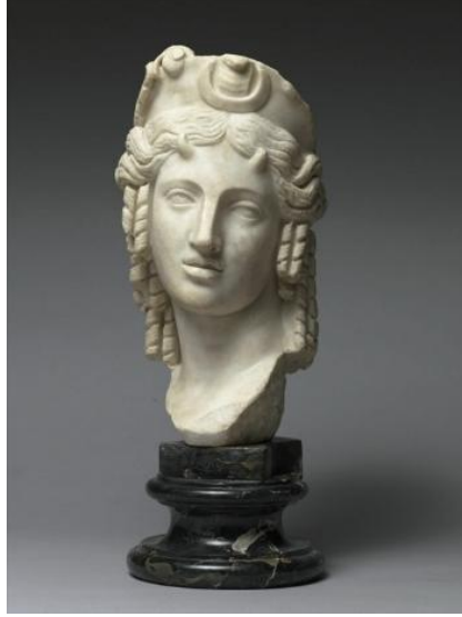
Şekil 11. İsis Büstü, M.S. 4. yy., mermer, 43x59x24 cm, Louvre Müzesi, Paris (Anonim, M.S. 4. yy.).

Antik Mısır'da Apis boğası ayrı bir kutsal varlık olarak saygı görmektedir. Yunan düşüncesinde İo'nun oğlu Epaphos'un Apis ile özdeş olduğu inancı ve Yunan yazarlarca Apis'in Mısır dilinde Epaphos'un karşılığı olduğunun düşünülmesi (Erhat, 2007, s. 158), Apis boğası tasvirlerinin (Şekil 12 ve 13) yaygınlaşmasını sağlamıştır. Mısır'ın kutsal boğa kültürünü temsil eden bu heykeller aynı zamanda İo'nun Mısır'daki soyunu simgelemektedir.