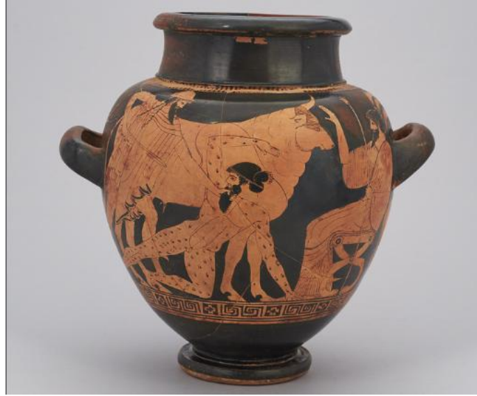
Şekil 2. Argos Ressamı, Hermes Yüz Gözlü Argos'u Öldürürken, t.y., Attik kırmızı figürlü stamnos, 29,8 x 24,5 cm, Viyana Sanat Tarihi Müzesi, Avusturya (Argos Ressamı, t.y.).

Argos Ressamına ait kısa boyunlu ve iki yatay kulplu bir şarap kabı olan stamnos (Şekil 2) üzerinde, Hera'nın emriyle, Zeus'un bir ineğe dönüştürdüğü güzel İo'yu korumakla görevli ve vücudunun her yerinde gözleri olan dev Argos'un, Hermes tarafından öldürülmesi betimlenmiştir (Carpenter, 2002, s. 45). Uzun sakalıyla betimlenen Hermes, sol dizinin üzerine çökmüş Argos'u sol eliyle sakalından yakalamış ve sağ eliyle tuttuğu kılıcını ona doğrultmuştur. Aslında bir inek olan fakat bu resimde boğa olarak tasvir edilen İo, arkalarında yer almaktadır. Sağda Zeus, sol elinde bir asa tutarak hayvan pençesi şeklinde ayaklara sahip katlanır bir taburede otururken görülmektedir.