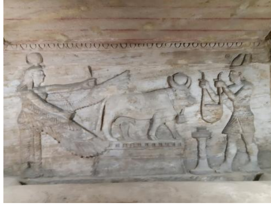
Şekil 14. Kom El Shoqafa Katakombuları, M.S. 2. yy., İskenderiye, Mısır (Anonim, M.S. 2. yy.).