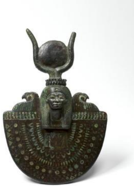
Şekil 10. İsis Kalkanı, M.Ö. 664, bronz veya bakır alaşımli yeşil ve mavi cam, 21 x 14x 4,7 cm, The Metropolitan Museum of Art, ABD (Anonim, M.Ö. 664).

M.Ö. 664'e tarihlenen İsis Kalkanı'nda (Şekil 10), İsis'in sembolü olan kutsal inek, tanrıçanın tüm ikonlarında olduğu gibi başının üzerinde yer alan boynuzlar aracılıđıyla vurgulanmış ve güneş diski ile birlikte tasvir edilmiştir.