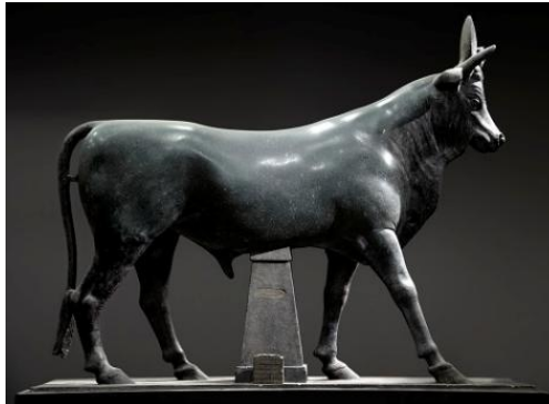
Şekil 13. Apis Boğası, M.S. 2. yy., heykel, İskenderiye Greko-Romen Müzesi, Mısır (Anonim, M.S. 2. yy.).

İskenderiye Kom El Shoqafa katakomplarında bulunan ve Tanrıça İsis'i, kanatlı kollarıyla kutsal boğa Apis'i ayakta kucaklar şekilde tasvir eden rölyef (Şekil 14), antik Mısır'da Tanrıça İsis'in, Apis boğasının annesi olduğu anlatısını kanıtlar niteliktedir.