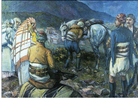
Resim 1. İbrahim Çallı, Zeybekler

Tabloda bir ayrılık sahnesi işlenmiştir. Eser bu gün İstanbul Resim ve Heykel müzesindedir (Resim 1).