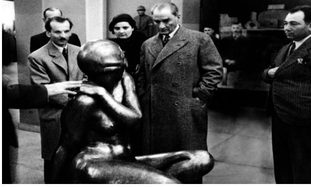
Resim 4. Atatürk Ankara'da açılan bir sergideki heykeli incelerken

( http://www.ataturkinkilaplari.com/depo/ataturk_resimleri/SDAMNB-ataturk-sergi-de-heykel-incelerken.jpg )