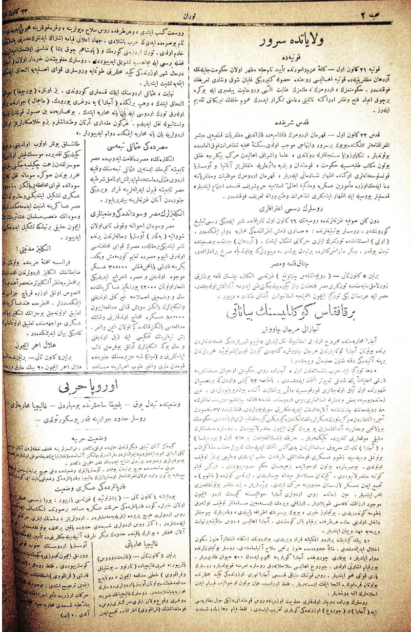
Ruslara karşı savaşırken aralanan bir Kafkas gönüllüsünün İstanbul basınında yer alan açıklaması [Turan, 23 Kânunuevvel 330 (5 Ocak 1915)]