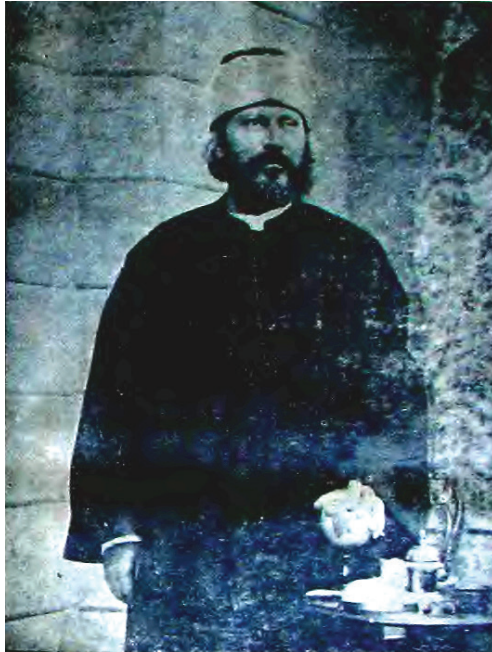
Ek- 2 Şeyh Cemaleddin Afgani. Kanun-i Esasi , 26 Şevval 1314/29 Mart 1797, S 14, s. 4.