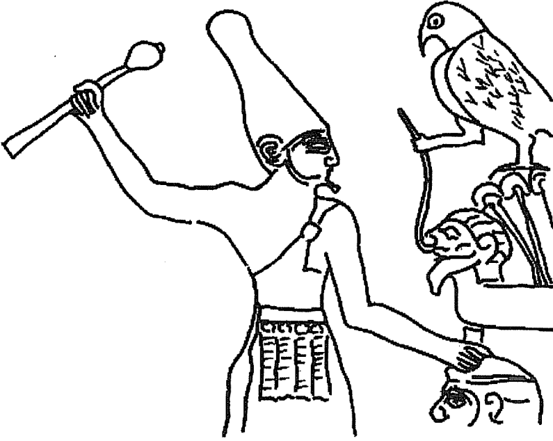
Resim 1: Narmer Paleti'nin arka yüzünde betimlenen burun tasması, Kahire Müzesi (krş. Smith, 23. dipnottaki eser, levha 7). (Çizim: Huw Geddes )

tutsaklarına uygulanmıştı. 6 Ayrıca eski İsraililer de bundan haberdardılar (Resim 1). 7