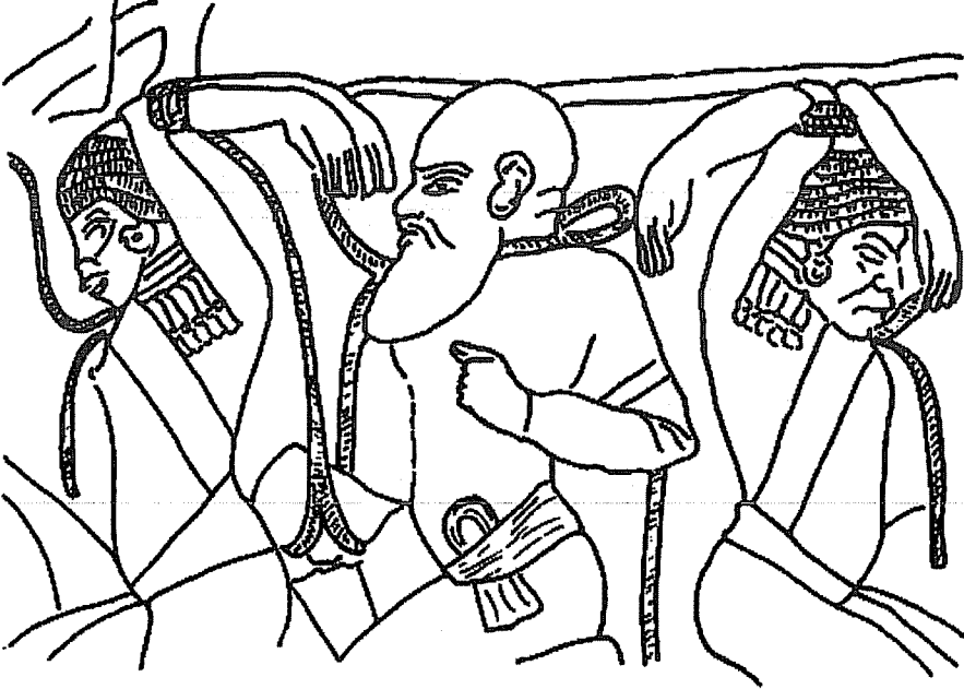
Resim 3: Tutankhamon'un kraliyet arabasında betimlenen tutsakların kollarına yönelik farklı bağlama yöntemleri, Kahire Müzesi (krş.Desroches-Noblecourt, 8. dipnottaki eser, levha XIXb). (Çizim: Huw Geddes )

bağıyla kolları bağlanarak kolayca kontrol altında tutulabilirdi. Asurlu muhafızlar kılavuz bir halatla, bağlı tutsaklara rehberlik bile ediyorlardı. Bazen Asurlular tutsakların iki bileklerini birbirine zincirleyerek onların ilerleyişlerini daha da zor duruma sokuyorlardı. Çoğu kez kollar arkaya alınır ve bir halatla arka tarafta dirseklerin az üstünden sıkıca bağlanırdı. 25 Sadece Mısır sanatında tutsaklar belli şekillerde gösterilirdi; tutsakların, mensup oldukları millete göre, kolları gelişigüzel başın üstünden bağlanırdı (Resim 3). 26