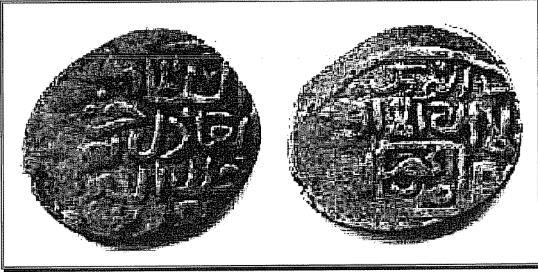
Resim 1: Akkoyunlu hükümdarı Sultan Yakup (1478-1490) adına Hasankeyf'te basılmış sikke 36 .

Akkoyunlu Devleti'nin Hasankeyf'teki hâkimiyetleri uzun süreli olmamıştır. Uzun Hasan'ın 1478'de ölmesiyle Sultan Halil, Akkoyunlu tahtına çıkmıştır. Ancak kendisine muhalif olan odaklar bulunmaktadır. Onların faaliyetleri neticesinde devlet içerisinde karışıklıklar nüksetmiş, babasının yerine tahta çıkan Sultan Halil, kardeşleri ile saltanat mücadelesine girişmiştir. Nihayetinde Sultan Halil, 1478 yılında kardeşi Yakup'la yaptığı savaşta ölmüştür 37 . Uzun Hasan'ın ölümünden sonra Akkoyunlu Devleti'nin kendi içinde yaşadığı karışıklıklar, Eyyubiler'in Hasankeyf'i yirmi yıllık inkıta döneminin ardından tekrar ele geçirmelerine zemin hazırlamıştır. 1482 yılında Hasankeyf'de Eyyubi hâkimiyeti tekrardan başlamıştır.