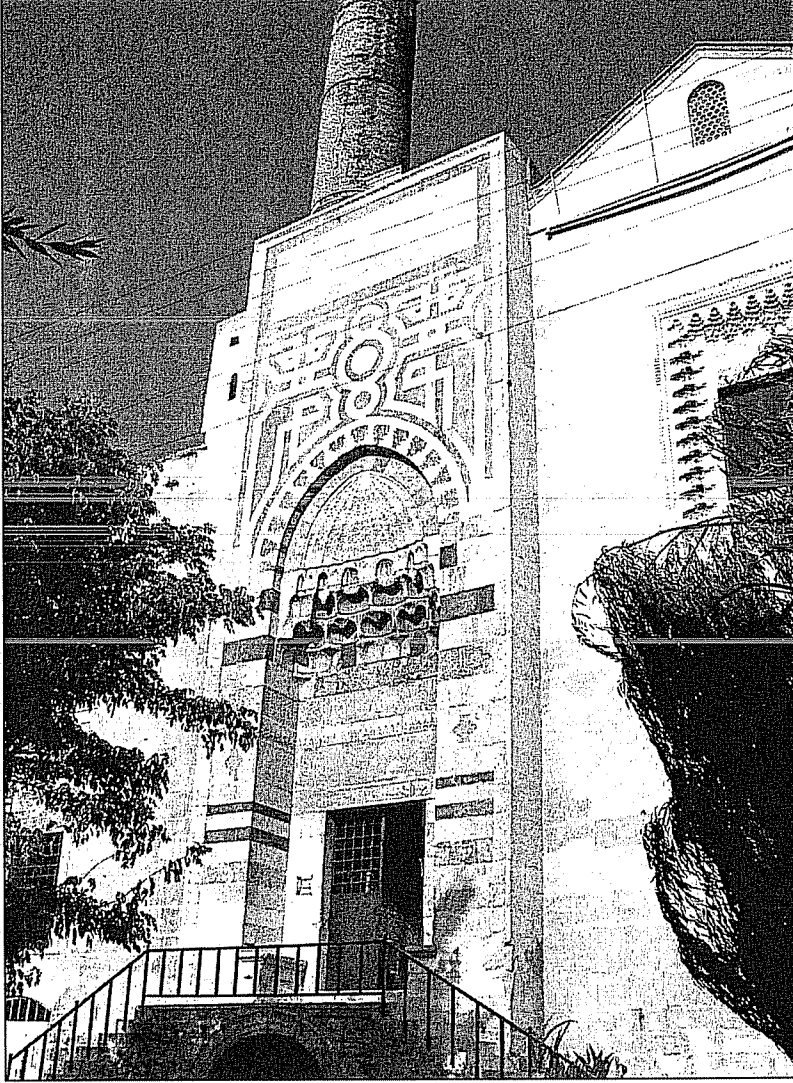
Resim 3: Ayasuluğ (Selçuk) İsa Bey Camii.

Bu caminin inşası ile şehir tamamen sur dışına taşınmamış, ahali bir müddet cuma ve sair ihtiyaçlarını görüp, tekrar kaleye dönmüş olmalıdırlar. Kezâ iç kalenin batı kapısından başlayarak, yamaçlardan aşağıya doğru inen ve bugün toprak kayması ile yer yer kaybolan patika yol, İsa Bey Camii'ne ulaşmaktadır. Bu yol, sur içi ve cami arasındaki bağlantıyı da ortaya koymaktadır.