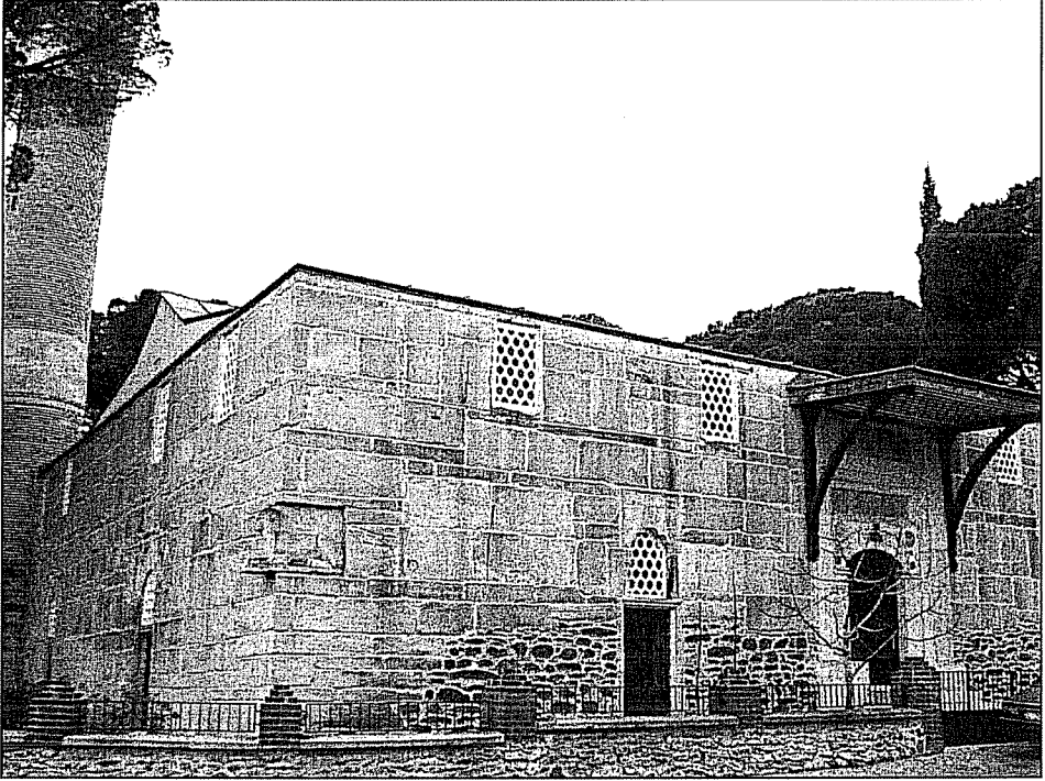
Resim 1: Birgi Ulu Cami

Aydınolu dönemine atıfta bulunan Osmanlı vakıf kayıtları, Mehmed Bey adına yapılmış olan hiçbir camiyi kaydetmez. Bunun yanında onun adına ve muhtemelen kendisi tarafından yapıldığını bildiğimiz sadece bir medrese bulunmaktadır 7 .